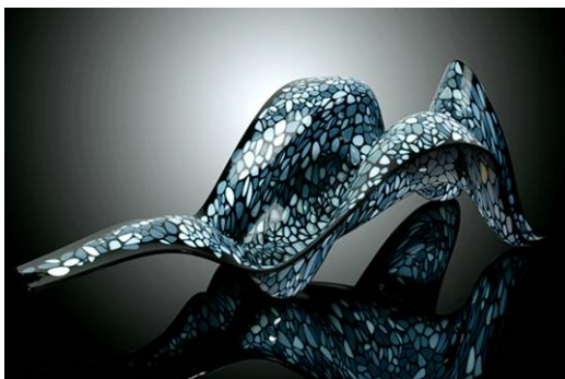
Ryc. 7. Bio-inspirowany prototyp szeszlona.

Fig. 7. Bio-inspired Prototype for a Chaise Lounge.