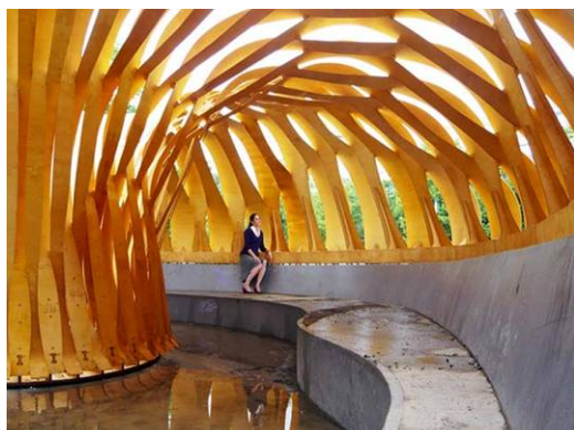
Ryc. 3. Ukończony pawilon Research Pavilion ICD/ITKE.

Technologie cyfrowego wspomaganie produkcji dzielą się na technologie addytywne, subtraktywne oraz formatywne 11 . Cięcie laserowe oraz frezowanie CNC, wspomniane w poprzednich akapitach w kontekście optymalizacji, należą do grupy tzw. subtraktywnego cyfrowego wspomaganie produkcji, polegającego na odejmowaniu materiału. Ze względu na niewielkie ograniczenia gabarytowe elementów, jest to technologia dosyć często eksplorowana w architekturze.