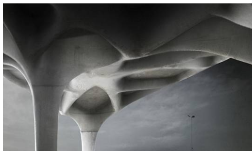
Ryc. 1. Zdjęcie pokazujące ukończoną strukturę Unikabeton.

Digital Project to jeden z niewielu programów, który umożliwia pracę nad skomplikowanymi projektami. Dla budynków o złożonej geometrii, takich jak np. Galaxy Soho w Pekinie (Zaha Hadid Architects), dokumentacja dwuwymiarowa jest obowiązkowo uzupełniana modelem trójwymiarowym, który – podobnie jak jego papierowa reprezentacja - jest pełnowartościowym dokumentem kontraktowym.