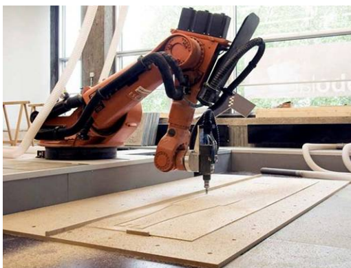
Ryc. 4. Zdjęcie pokazujące proces wycinania sklejkę ramieniem robota przemysłowego.