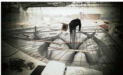
Ryc. 2. Zdjęcie pokazujące proces formowania konstrukcji.

Fig. 1. Picture showing formed structure of Unikabeton.