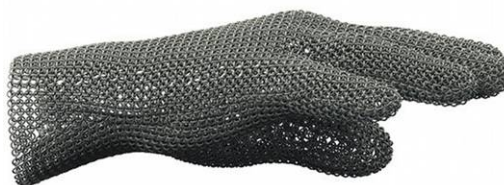
Ryc. 8. Rękawiczka drukowana sproszkowanym tytanem. Źródło: http://www.economist.com .

Fig. 7. Bio-inspired Prototype for a Chaise Lounge. Source: http://web.media.mit.edu/~neri/site/projects/projects .