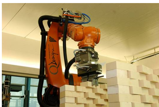
Ryc. 5. Robot KUKA układający elementy modułarne.

wanych elementów pozwoliły na stosowanie ich jako docelowych produktów. Dostyc szybko pojawił się pomysł zastąpienia szybkiego prototypowania - szybką produkcją (rapid manufacturing 14 ). Technologia ta szybko znalazła zastosowanie w produkcji narzędzi medycznych, w stomatologii. W architekturze zastosowanie tej metody produkcji, było bardziej wymagające, głównie ze względu na skalę planowanych elementów. Jednakże kilka uniwersytetów i firm rozwija wspomniany koncept osiągając pewne sukcesy. Przykładem może być metoda „Contour Crafting 15 ” rozwijana przez profesora Khoshnevis'a z placówki badawczej University of Southern California. Wykorzystywanym materiałem do szybkiej produkcji jest specjalny beton. Inne procesy to D-Shape 16 (Monolite UK) oraz Free-form Construction 17 , projekt zainicjowany przez uniwersytet Loughborough.