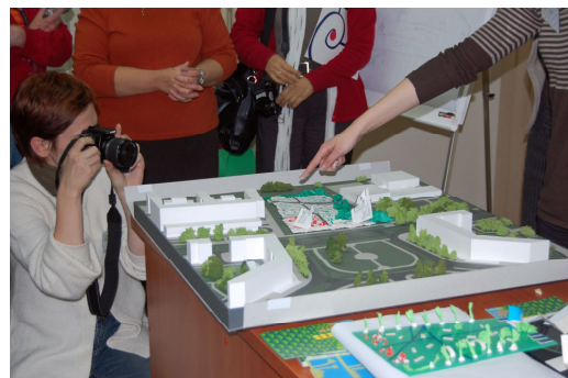
Ryc. 4. Debata nad makietą jednej w wypracowanych koncepcji.

Fig 3. One of the presentations during the workshop participating in Nowa Huta.