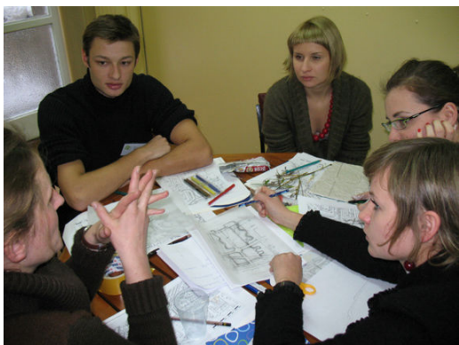
Ryc. 5. Wspólna praca architektów krajobrazu i mieszkańców podczas warsztatów w Nowej Hucie.