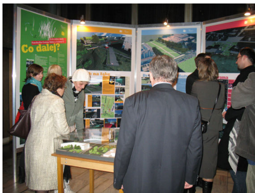
Ryc. 6. Końcowa prezentacja koncepcji wypracowanych podczas warsztatów partycypacyjnych w Nowej Hucie.