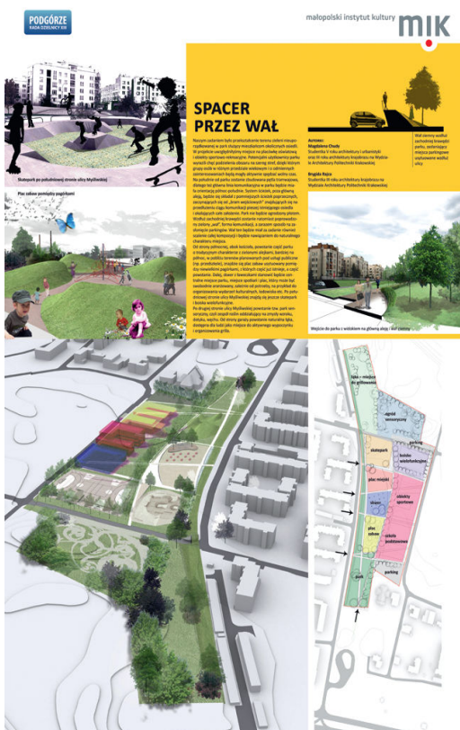
Ryc. 8. Wariant II koncepcji rekreacyjnego zagospodarowania terenu zielonego w Podgórzu. Plansza prezentująca idee a nie konkretne rozwiązania estetyczno-techniczne.