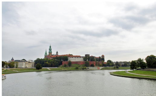
Ryc. 1. Jedna z najcenniejszych ekspozycji Wzgórza Wawelskiego. Widok z mostu Dębnickiego jest jednym z najbardziej charakterystycznych dla krajobrazu Krakowa.

Fig1 One of the most valuable exposition of the Wawel Hill. View from the Dębnicki Bridge is one of the most characteristic landscape of Krakow.