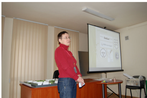
Ryc. 3. Jedna z prezentacji podczas warsztatów partycypacyjnych w Nowej Hucie.

Jak pokazuje przykład Podgórze okazuje się, że warsztaty partycypacyjne mogą być dobrym narzędziem do obrony pewnych przestrzeni przed zabudowaniem ich i pozbawieniem tym samym przestrzeni społecznej. Przykład z Mszany Dolnej pokazuje, że wspólna praca nad konkretnym tematem może przynieść efekt w projekcie łączącym funkcje pozornie trudne do połączenia.