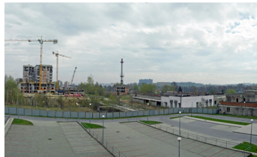
Ryc. 2. Widok z osiedla Na Kozłówce. Nawet daleki wgląd, który należy traktować jako wartość dodatnią nie rekompensuje mieszkańcom opresyjnego najbliższego otoczenia.

Fig1 One of the most valuable exposition of the Wawel Hill. View from the Dębnicki Bridge is one of the most characteristic landscape of Krakow.