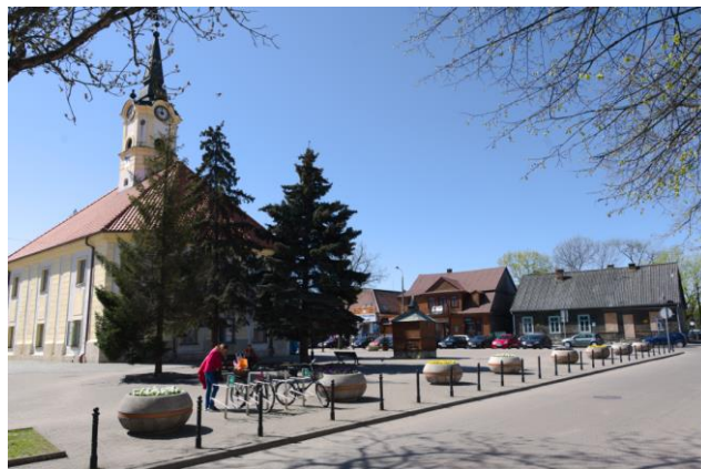
Fig. 4. Bielsk Podlaski. The town hall and the western frontage in the town hall square. Author: A. Owerczuk (2018)

Ryc. 3. Bielsk Podlaski. Ratusz. Autor: A. Owerczuk (2018)