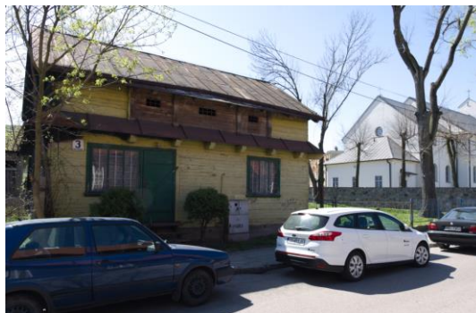
Fig. 11. Bielsk Podlaski. A wooden building in the center of the town. Kościelna St. Author: A. Owerczuk (2018)

Ryc. 10. Bielsk Podlaski. Domy drewniane w centrum miasta. Ul. Kościuszki. Autor: A. Owerczuk (2018)