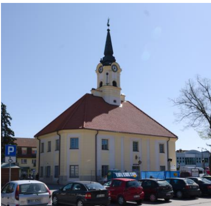
Fig. 3. Bielsk Podlaski. The town hall. Author: A. Owerczuk (2018)

well as improved fire safety. Gentry mansions were similar in forms to town houses and cottages. Besides the center, there was a dispersed construction among gardens. Lower housing density and the character change of the building outside the centre was common in small towns in Poland [2, s. 86]. Straw was also used to cover the roofs [3, p. 2]. Jewish community, which contributed to the appearance and character of the town, must be mentioned here. It was a numerous group in the eastern towns. In 1878 there were 5810 inhabitants in Bielsk, among whom about two thirds were Israelites.[16, p. 215]. A former wooden railway station should be indicated as one of the most important architectural objects. It was erected as a part of developing infrastructure of railroad line Kiev- Brest – Bielsk – Białystok – Königsberg (1873) at the end of the 19 th century with a later expansion of a section to Białowieża (1894) [14, p. 17]. During the First World War the railway station was destroyed. In this place, during inter-war period, a new, bricked station was raised. At the end of the 19 th century, Bielsk had almost 8 thousand inhabitants and 675 houses, but only 16 brick-built houses [11].