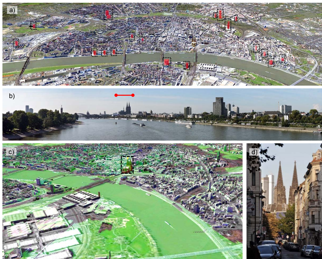
Ryc. 2. Analiza lokalizacji zabudowy wysokiej w Kolonii: a) rozmieszczenie obiektów wysokich w strukturze miasta; b) panorama miasta od strony północnej; c) analiza pola oddziaływania wizualnego katedry; d) niekorzystne oddziaływanie budynku z bryłą katedry na osi ulicy Palmstrasse.

Fig. 2. Analysis of tall buildings in Köln: a) location of tall buildings in city structure; b) city panorama from north; c) analysis of visual impact of cathedral; d) unfavourable interaction between building and cathedral within axis of Palmstrasse.