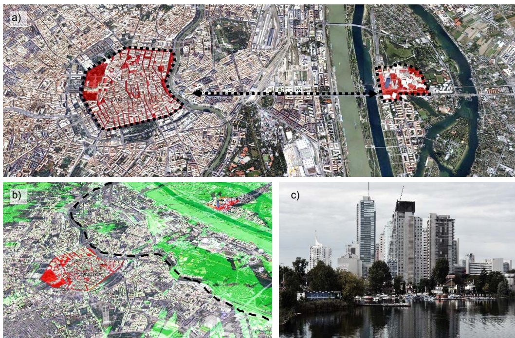
Ryc. 1. Analiza lokalizacji zabudowy wysokiej w strukturze urbanistycznej Wiednia: a) osiowa relacja starego miasta i kompleksu budynków wysokich Donau City; b) analiza oddziaływania wizualnego (oznaczonego na zielono) dla obiektu DC Tower 1 o wysokości 220 m; linią przerywaną oznaczona jest granica bezpośredniego oddziaływania wizualnego obiektu; dalej budynek widoczny jest na pojedynczych otwartych terenach w mieście; c) panorama wieżowców od strony wschodniej z brzegu Starego Dunaju.

Szerokie koryto rzeki Dunaj stanowi właściwej wielkości przedpole widokowe, które pozwala na oglądanie zabudowy wysokiej jako grupy w otwartym krajobrazie. Jest to bardzo atrakcyjne wizualnie rozwiązanie. Zabudowa wysoka jest widoczna zarówno od strony miasta przez koryto Nowego Dunaju, jak i ze wschodniego brzegu Starego Dunaju, gdzie znajdują się osiedla zabudowy jednorodzinnej oraz liczne ciągi spacerowo-rekreacyjne. Kompleks wieżowców prezentuje się z tych terenów w sposób dość uporządkowany, jako zwarty zespół budynków (ryc. 1c).