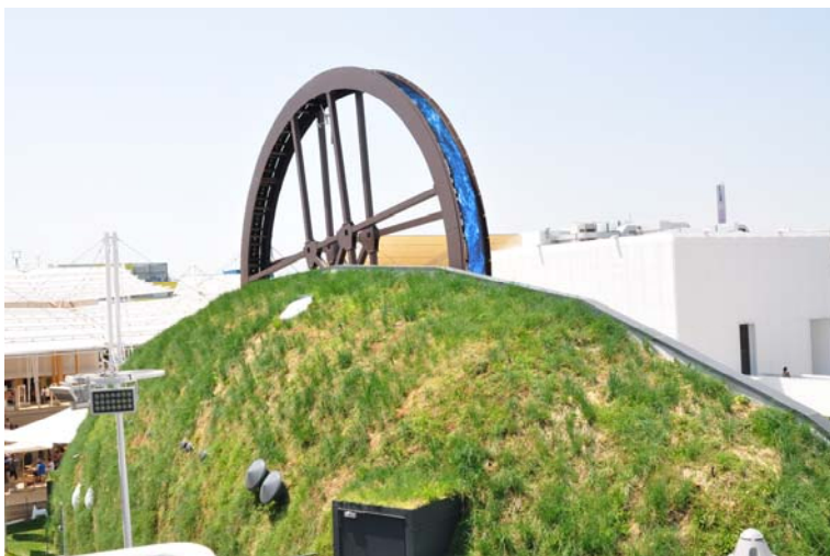
Ryc. 12. Pawilon Białorusi, Expo 2015.