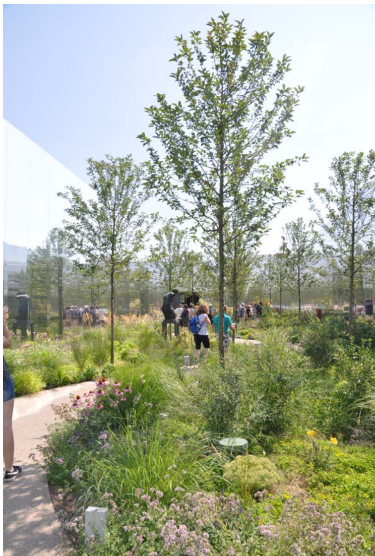
Ryc. 10. Pawilon Polski, Expo 2015.

Najbardziej czytelne odwołanie do idei Magdaleny Abakanowicz można odnaleźć w dekoracyjnych „drzewach” stojących przed pawilonem Wietnamu (ryc. 9). Jest to jednak odwołanie tylko wizualne, nie odnoszące się do samej idei domów drzew.