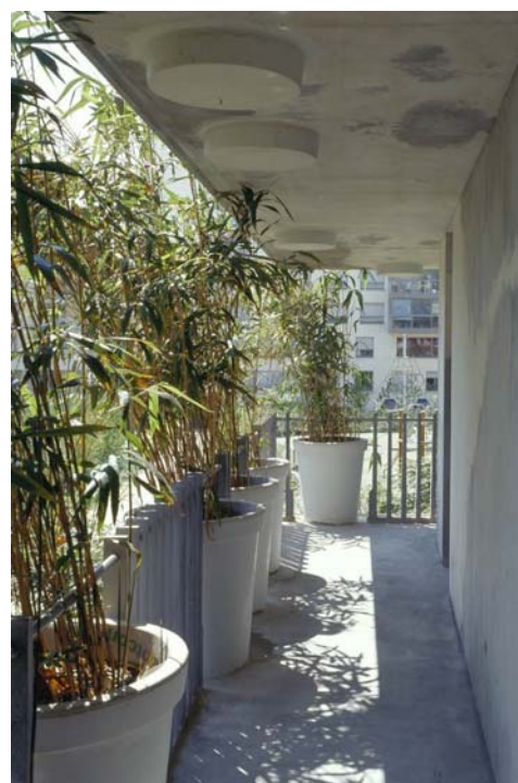
Ryc. 4. Flower Tower, Paryż. Źródło: [4] Fig. 4. Flower Tower, Paris. Source: [4]

Z kolei ukończony w 2014 r. w Mediolanie projekt pracowni Boeri Studio, opracowany we współpracy z architektami krajobrazu Laurą Gatti i Emanuela Borio, Bosco Verticale wyróżnia się z wielkomiejskiego otoczenia widocznymi z daleka drzewami. Swoją nazwę „pionowy las” zawdzięcza blisko 9 tys. m 2 tarasów, na których posadzono specjalnie wyselekcjonowane drzewa i mnóstwo innych roślin aktywnie redukujących smog 5 . Dwa wieżowce zostały obsadzone 800 drzewami o wysokości 3 – 9 m, 11 tys. bylin i roślin okrywowych oraz 5 tys. krzewów, co w sumie składa się na ponad 100 różnych gatunków roślin – w układzie poziomym odpowiadałoby to obszarowi równemu 20 tys. m 2 zieleni miejskiej. Przed realizacją projekt nasadzeń testowano w tunelu aerodynamicznym, by zyskać pewność, że silniejsze porywy wiatru nie powywracają drzew, z kolei betonowe podstawy balkonów o grubości 28 cm wzmocniono dodatkowo konstrukcjami stalowymi, aby mogły przenieść obciążenie roślinnością. Budynek spełnia wszystkie wymogi budownictwa ekologicznego 6 (ryc. 5, 6). Architekci Boeri Studio nazywają swój projekt – „projektem zalesiania metropolitalnego”, który ma się przyczynić do regeneracji środowiska,