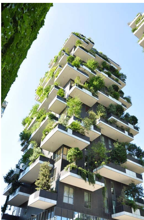
Ryc. 6. Bosco Verticale.

Fig. 5. Bosco Verticale.