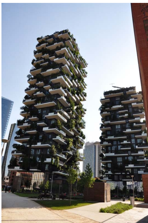
Ryc. 5. Bosco Verticale

ponadto Bosco Verticale pomaga kontrolować i ograniczać ekspansję miasta. Każdy wieżowiec stanowi odpowiednik obszaru budownictwa jednorodzinnego, które na peryferiach miast zajmowałoby powierzchnię około 50 tys. m 2 [11].