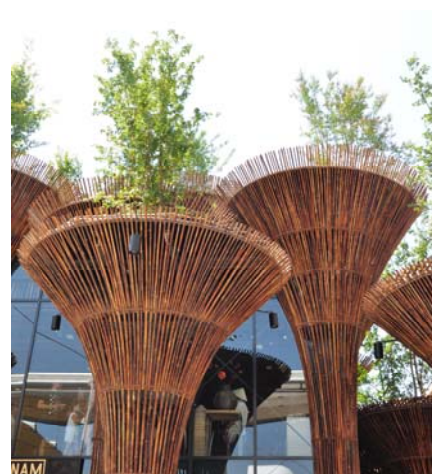
Ryc. 9. Pawilon Wietnamu, Expo 2015.

Fig. 8. Bosco Verticale.