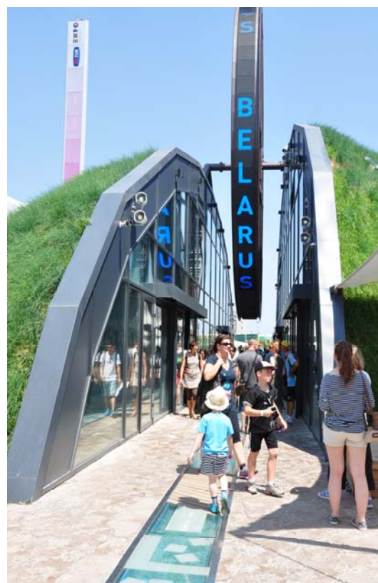
Ryc. 11. Pawilon Białorusi, Expo 2015.

Idea architektury arborealnej Magdaleny Abakanowicz miała swoje głębokie odniesienia, zarówno do europejskiej i światowej tradycji kulturowej, jak i do ekofilozofii. W martwą, geometryczną strukturę miasta Abakanowicz wpisała formę żyjącego domu – drzewa, wprowadzając tym samym porządkujący rytm i harmonię w chaotyczną przestrzeń. Początek alei stanowiły dwa zespolone drzewa domy, odwołujące się prawdopodobnie do biblijnych dwóch drzew w raju, które odnosi się do dwóch różnych sfer w boskiej dziedzinie 7 [8]. Prowadzona przez artystkę subtelna Gra w zielone , krąży również wokół idei miasta – ogrodu Ebenezera Howarda. Obecnie powstające domy drzewa, choć odwołują się do idei architektury arborealnej, czy też idei miasta – ogrodu, to jednak bardziej wydają się po prostu Grą w zielone – zabawą architektów, architektów krajobrazu i ogrodników, konstruktorów i in.