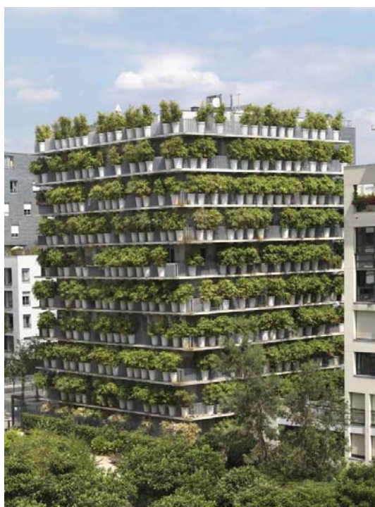
Ryc. 3. Flower Tower, Paryż. Fig. 3. Flower Tower, Paris.

kowymi. Kwiatowa wieża, nazywana również „domem donicą”, ma być wyrazem potrzeby wprowadzania natury do miasta [4]. Wybrany do nasadzeń bambus jest rośliną tanią, bardzo szybko rosnącą i niewymagającą szczególnej pielęgnacji, co stanowi niewątpliwą zaletę w budownictwie komunalnym, ale daje przy tym niespotykane efekty, jeśli chodzi o możliwości kształtowania elewacji. Falujące na wietrze pędy bambusa wprawiają widoczną z oddali fasadę w ruch, zapewniają przefiltrowany, migoczący cień we wnętrzach, a szeleszczące liście dostarczają mieszkańcom wrażeń dźwiękowych niemożliwych do osiągnięcia w tradycyjnym budynku [3].