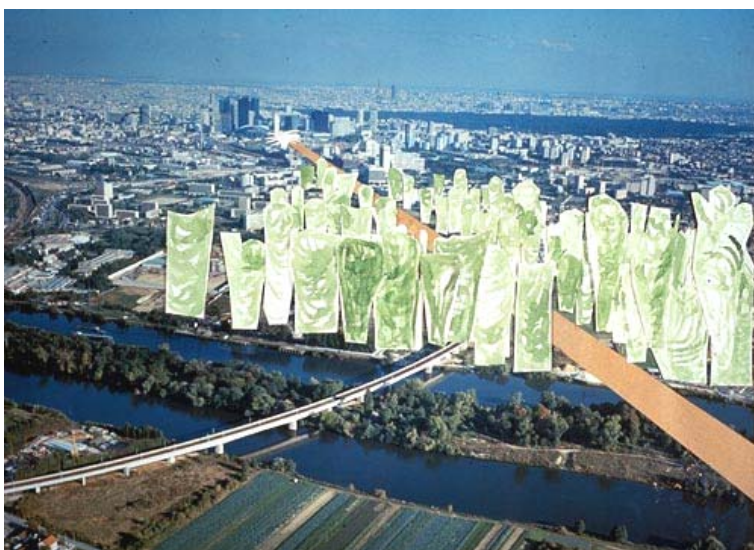
Ryc. 2. Architektura arborealna Magdaleny Abakanowicz.

Architektura arborealna wykracza poza czysto estetyczną zabawę formą, a wchodzi głę-boko w treści antropologiczne. Projekt Magdaleny Abakanowicz poza tym, że doskonale wpisuje się w modny obecnie nurt ekofilozofii, przedstawia również określoną koncepcję człowieka i natury. Jak pisze Jerzy Walkowiak [10], idea domu – drzewa jest odwołaniem się przez artystkę do jednej z koncepcji barokowego ogrodu francuskiego, polegającej na strzyżeniu drzew w geometryczne formy architektoniczne. Natura staje się wówczas archi-teksturą. Abakanowicz dokonuje jednak zamiany – to architektura staje się naturą, a pro-jektant z naśladowcy natury staje się jej twórcą [10].