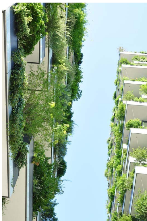
Ryc. 7. Bosco Verticale

tów wykonanych z polerowanej blachy chromowanej, które znajdują się na całym wewnętrznym obwodzie ścian, multiplikują cienie odbicia w każdym kierunku (ryc. 10). Ogród na dachu polskiego pawilonu pozwala na bezpośrednie obcowanie z naturą, jest odizolowany od otaczającego zgiełku, zmienia się wraz z porami roku – jabłonie kwitną, owoce dojrzewają, wreszcie nadchodzi pora zbiorów – co pokazuje zmienność natury.