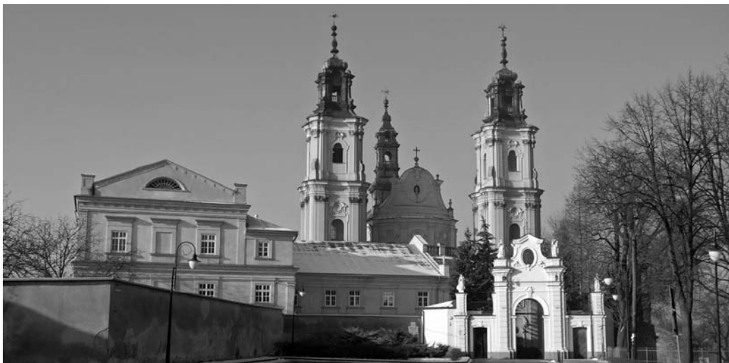
Ryc. 4. Bazylika Matki Bożej Bolesnej w 2011 roku. Fig. 4. The Mother of Sorrows Basilica in 2011.

okazała świątynię. Były to najprawdopodobniej lata 1629-1635, 20 jednonawowa budowla powstała w stylu późnorenesansowym.