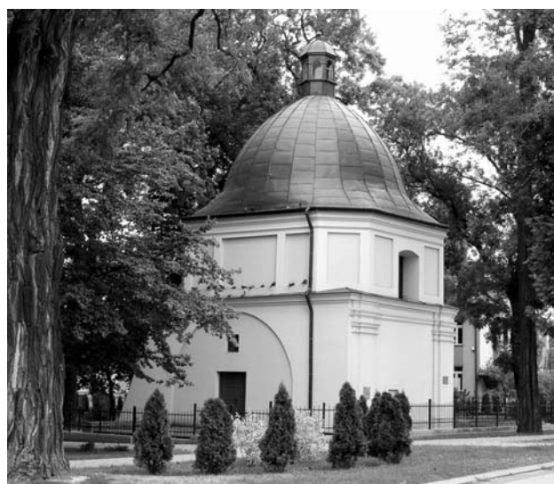
Ryc. 10. „Cerkiewka” w roku 2012, po remoncie.

Fig. 9. The „little church” in the interwar years.