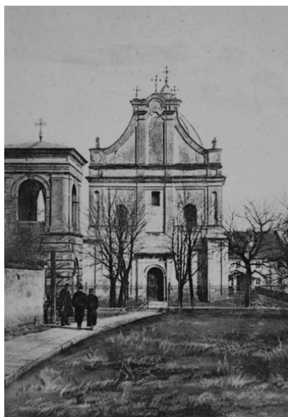
Ryc. 5. Cerkiew przed przebudową (stara Ryc. 6. Cerkiew sto lat po przebudowie (2012). pocztówka).

zowano ją na terenie dawnego zamku właścicieli miasta, który w II połowie XVII wieku popadł w ruinę, aż w końcu został rozebrany.