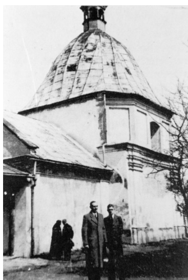
Ryc. 9. „Cerkiewka” w okresie międzywojennym.

jarmarkom do Jarosławia ściągęli kupcy z całego świata, przywożąc swoje zwyczaje i religie. Stopniowo Grekokatolicy i Żydzi zyskiwali coraz większy wpływ na krajobraz miasta. Powstawały świątynie i dzielnice etniczne, zaś Kościół Katolicki utracił monopol na wznoszenie okazałych obiektów. Najbardziej wyraźnym śladem znaczenia innych religii jest fakt, że cerkiew Przemienienia Pańskiego wznosi się na miejscu dawnego zamku – do którego wiodła jedyna ulica przekątniowa wychodząca z rynku – dodatkowo podkreślająca znaczenie lokalizacji. Ta przewrotność losu to doskonały symbol wielokulturowości Jarosławia.