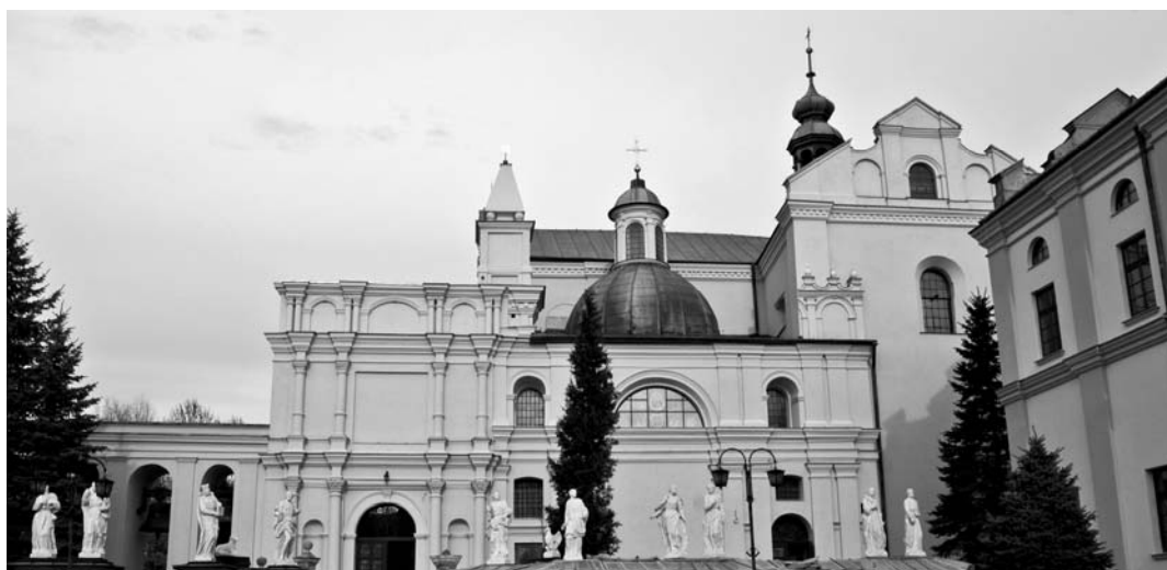
Ryc. 2. Kolegiata Bożego Ciała w roku 2011.

Zofii Kostkowej miasto zawdzięcza również budowę kolegium jezuickiego – w którym później nauki miał pobierać Bohdan Chmielnicki - i sprowadzenie do miasta zakonników.