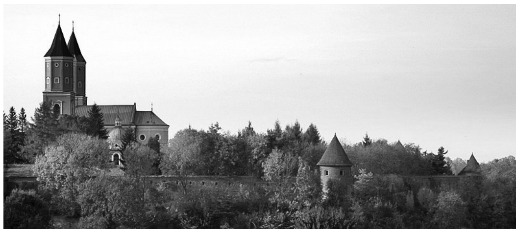
Ryc. 3. Widok ogólny Opactwa od strony południowej. Fig. 3. View on the Abbey from the south.

wotnego miasta. Benedyktynki przejęły stary, drewniany kościół, a następnie – w 1615 roku – wybudowały kościół. 15 Późnorenesansowa świątynia była budowlą orientowaną; wg A. Miłobędzkiego 16 miała specyficznie polski, krzyżowy schemat planistyczny – z prostokątną nawą i półkolistym prezbiterium. Pseudotransept tworzyły umieszczone po bokach kaplice. Z 1622 roku pochodzi piękny portal bez sygnatury twórcy; Jan Sas-Zubrzycki nazywa go arcydziełem i łączy z osobą Jana Pfistera, rzeźbiarza z Brzeżan, autora grobowców Ostrogskich w katedrze tarnowskiej i rzeźb w kaplicy Boimów we Lwowie. 17 Całość założenia otoczona jest murem z 8 basztami, typu średniowiecznego.