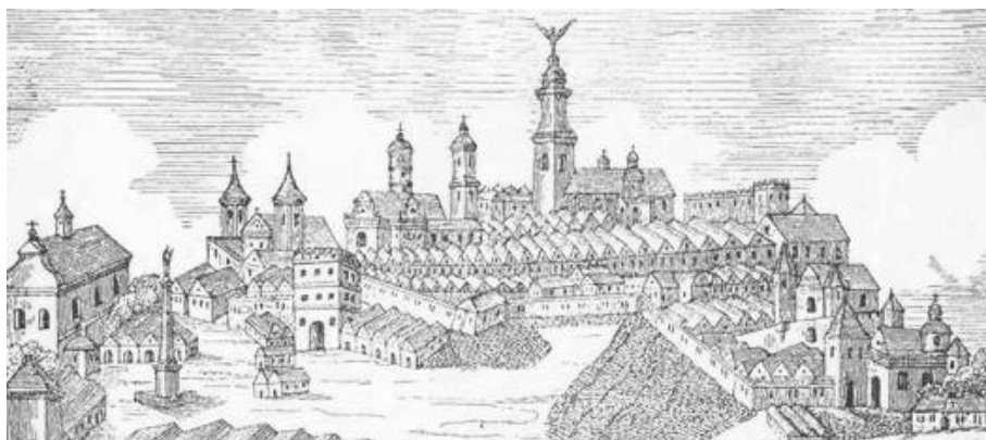
Ryc. 1. Widok Jarosławia z drugiej połowy XVII wieku. 10 Widoczna wyraźnie górująca nad miastem sylwetka Kolegiaty, zwieńczona pomnikiem św. Michała.  11 Fig. 1. View on Jarosław. 2 nd half of 17 th century. 12 One can clearly see the body of Collegiate church (finished

Od XV do XVIII wieku najważniejszym kościołem w mieście była przyrynkowa kolegiata Wszystkich Świętych, ulokowana w zachodniej pierzei, rozebrana przez Austriaków w 1807 roku z powodu złego stanu technicznego. Pierwotnie gotycka (fundacja Spytka, kasztelana krakowskiego z ok. 1473 roku 7 ) przebudowana została w stylu barokowym w XVII wieku staraniem Anny Ostrogskiej. Odbudowana świątynia miała 38 metrów długości i 9 metrów szerokości, sklepiona była gotycko, posiadała trzy kaplice. Zwieńczona była 60-cio metrową wieżą z 15-sto metrowym posągim św. Michała Archanioła, patrona miasta, 8 („wysoka więcej niż 100 łokci, w cztery kondygnacje o wielkich oknach zbudowana” 9 ), i stanowiła zdecydowaną dominantę panoramy Jarosławia. Do kościoła przylegał cmentarz i budynki parafialne, zaś w podziemiach mieściły się grobowce dziedzicznych właścicieli miasta, m.in. Ostrogskich, Spytków, Kostków i Odrowążów.