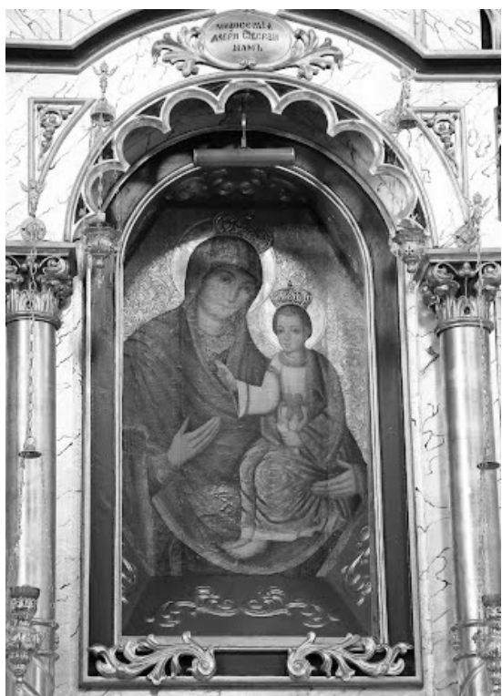
Ryc. 7 Ikona Matki Bożej Bramy Miłosierdzia.

Druga świątynia grekokatolicka to cerkiew Zaśnięcia Najświętszej Maryi Panny (lub Zaśnięcia Bogurodzicy) położona w parku im. Baśki Puzon – założonym na terenie dawnego cmentarza grekokatolickiego. Przez mieszkańców zwana „cerkiewką”, istniała już w 1520 roku. Pierwotnie była drewniana, w połowie XVII wieku przebudowaną ją na murowaną. 25 W 1789 roku została zamieniona przez Austriaków na prochownię; niedługo później wystawiona została na licytację. Dzięki staraniom ówczesnych proboszczów parafii została w 1791 roku odkupiona przez Rusinów. Wykonano wówczas remont, zachowane prezbiterium zaadoptowano na kaplicę liturgiczną.