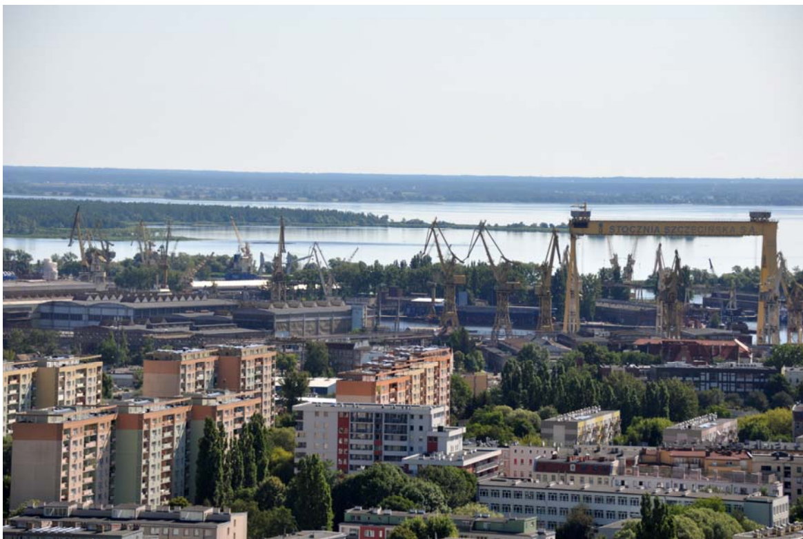
Ryc. 3. Widok terenów Stoczni Szczecińskiej i Jeziora Dąbie z perspektywy realizowanego budynku wysokościowego Hanza Tower w Szczecinie. Fot. Zbigniew Paszkowski, 2019