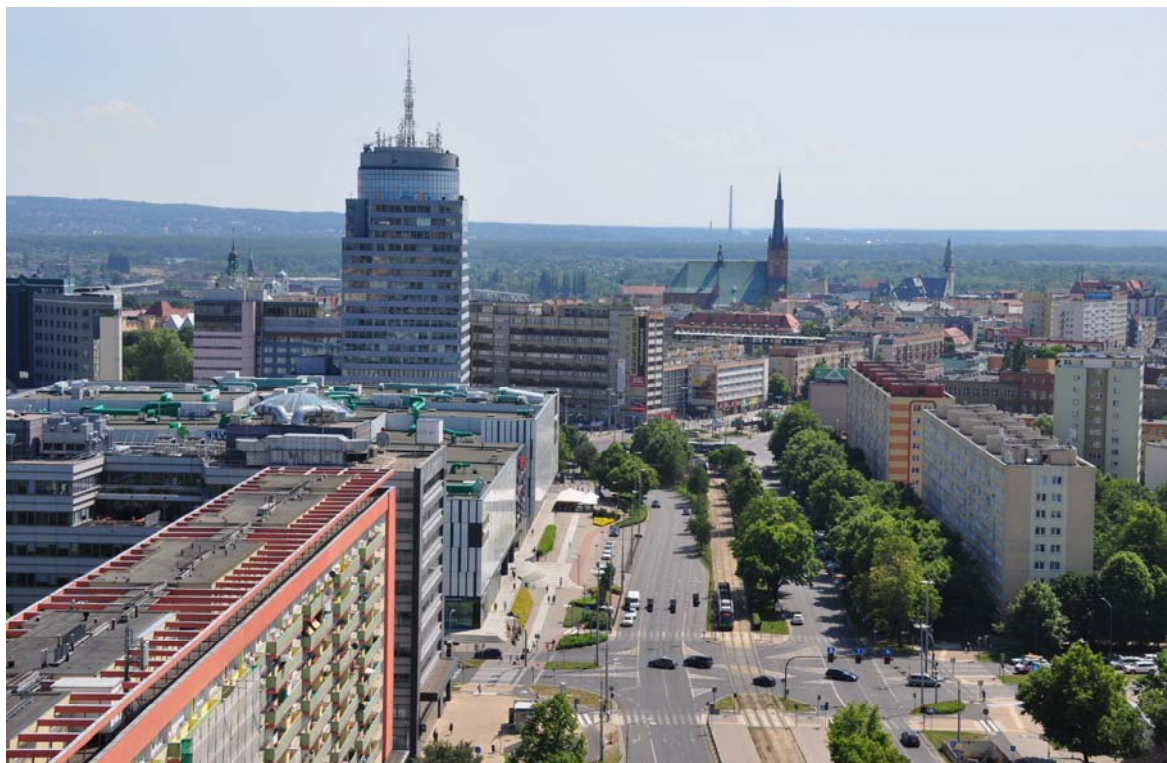
Ryc. 4. Widok ul. Wyzwolenia w Szczecinie, CH Galaxy, budynku biurowego PAZIM, Katedry św. Jakuba, z perspektywy realizowanego budynku wysokościowego Hanza Tower w Szczecinie. Fot. Zbigniew Paszkowski, 2019.

It means, that however the responsibility in decision-making seems to belong to different institutions and person, the crucial person, which can give the most important incentives and undertake the strategic decisions for the development of the city, remains the city mayor or the president.