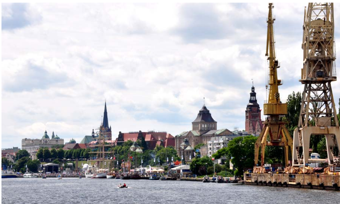
Ryc. 5. Widok śródmieścia Szczecina z perspektywy toru wodnego wiodącego przez centrum miasta. Od prawej widoczne są obiekty zabytkowe: Zamek Książąt Pomorskich, Katedra św. Jakuba, Muzeum Narodowe, Urząd Wojewódzki, a także Stocznia Szczecińska. Zdjęcie pokazuje złożoność problematyki miejskiej odpowiedzialności w zakresie różnorodnego dziedzictwa architektonicznego. Fot. Zbigniew Paszkowski, 2019

The phenomenon of distributed responsibility also has a different dimension. When state power fails to solve problems that cities face (smog, climate change, migrations, education, etc.), the cities take the initiative in the name of responsibility. They solve problems as part of agreements between leading cities and on the principles of mutual cooperation. This phenomenon, known in the United States under President Trump under the name "new locality" is described in the Financial Times in 2017 1 .