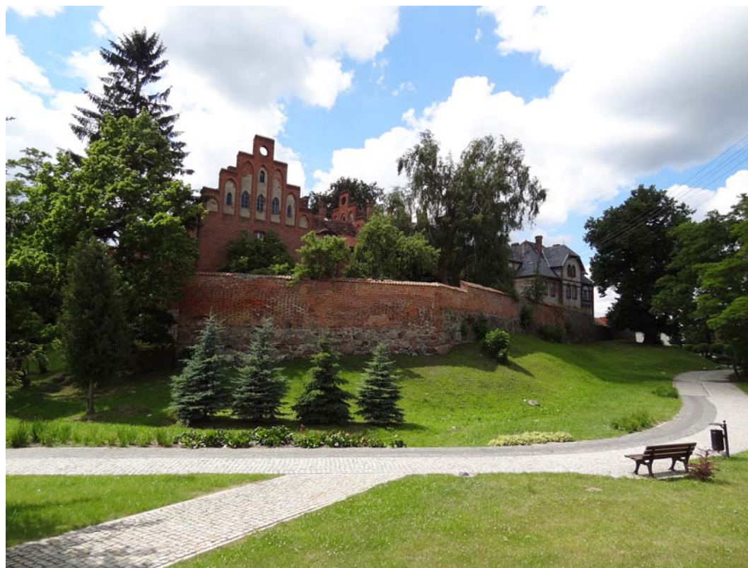
Ryc. 1. Stan istniejący zamku w Sztumie.

Pierwszą kartę dziejów pisanych Sztumu wypełnia relacja krzyżackiego kronikarza Piotra z Dusburga z drugiej wyprawy krzyżowej do Pomezanii w 1236 r. którą dowodził margrabia Miśni-Henryk III. Dusurg pisze: W ziemi pomezkańskiej znajdował się niegdyś obszar zwany Rezją, w którym mieszkali sławni i doświadczeni wojownicy. Na nich to – wspomniany książę – przykładając rękę do pługu i nie oglądając się do tyłu – mężnie natarł, niszcząc raz po raz grabieżą, ogniem i wielkim rozlewem krwi niewiernych. Zamek ich położony w pobliżu rzeki Mokrej oraz wszelkie umocnienia, jakie mieli w tym miejscu, które nazywa się Sztum, i jakie mieli w pobliżu Postolina, w pobliżu Prabut i Obrzymowa, w pobliżu jeziora Družno i Wielbarka, przemocną zbyły i obróciwszy w perzynę zrównał z ziemią, a niewiernych zabił lub wziął do niewoli. Lecz jak dzielnie i jak mężnie wspomniany margrabia jakby lew, który przed niczym się nie cofa, pokonał wymienione plemiona, tego nikt nie może dokładnie opisać ani słowami, ani piórem. A tak był wobec nich nieustępliwy na wojnie, że poddały się one wierze i braciom. I tym prawom i wolnościami, jakie wówczas in nadano, podlegali także inni nowo nawróceni [7, s. 53].