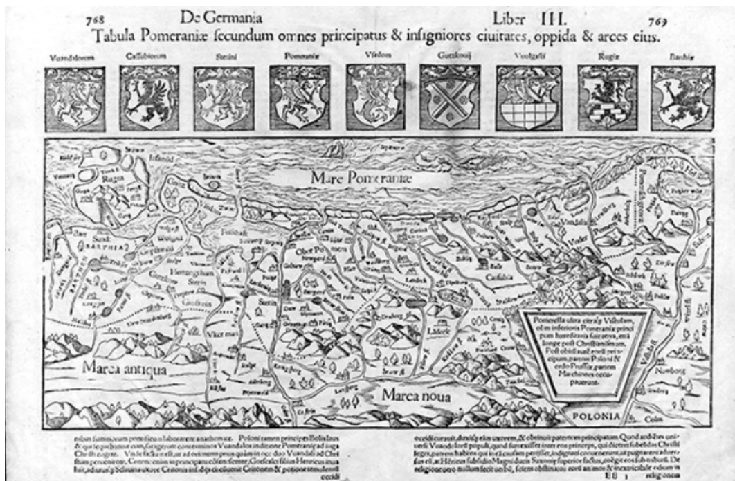
Fig. 2a. Map - woodcut. Made by Petrus Artopaues - the sixteenth century.

Ryc. 2a Mapa - drzeworyt. Wykonał Petrus Artopaues - XVI wiek.