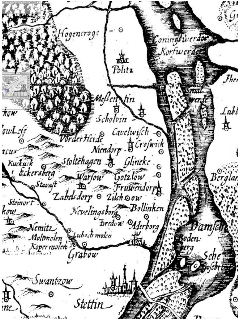
Fig. 3 A fragment of the map made by Eilhardus Lubinus in the 17th century Ryc. 3 Fragment mapy którą wykonał Eilhardus Lubinus w XVII wieku.