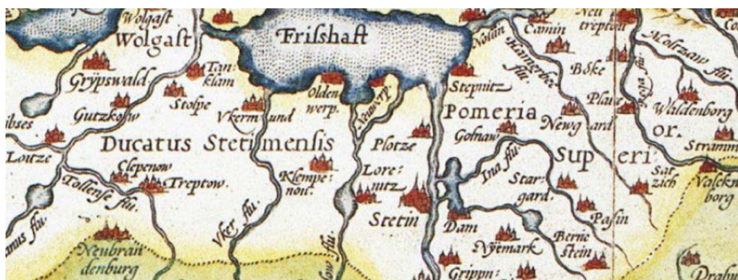
Fig. 1 Map made by Abraham Ortelius in 1573.

Ryc. 1 Mapa sporządzona przez Abraham Ortelius w 1573 roku.