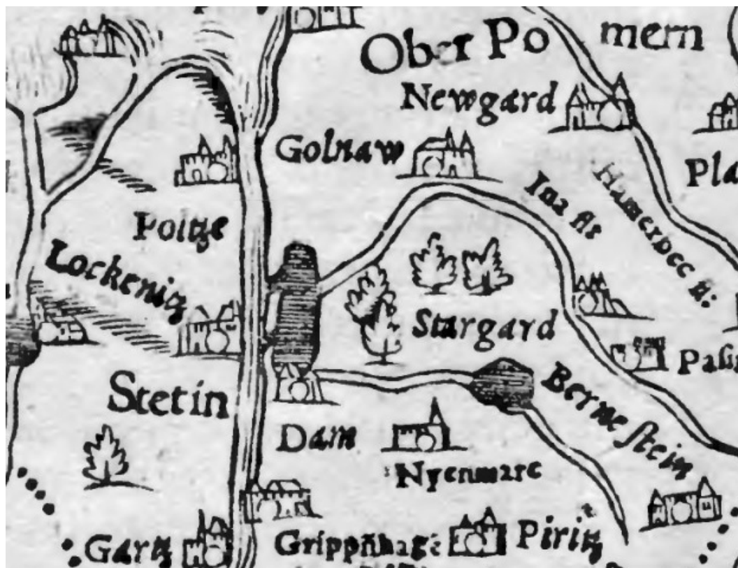
Fig. 2b. Fragment of a map from the sixteenth century made by Petrus Artopaeus. Ryc. 2b Fragment mapy z XVI wieku wykonanej przez Petrus Artopaeus.

In the sixteenth century, the city had about 450 permanent residents [4, p. 207]. It appeared on the map of Pomerania, which was prepared by Petrus Artopaeus (1500-1563), which is an illustration of Sebastian Münster's work: Cosmographiae universalis Lib. VI published in Basel in 1552 [3] 1 .