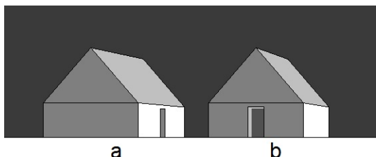
Fig. 1. Schematic representation of wide- (a) and narrow-fronted (b) house.

Previous research projects have allowed to state that, apart from Poland, narrow-fronted cottages in the past were common in large areas of Europe south of the North Sea and the Baltic Sea [1, s. 228-231]. Hall house, also called Lower Saxon in the past, is particularly widespread. It covers northern European plains along the coasts of the North Sea and the Baltic Sea, from the mouth of the Rhine in the Netherlands to the lands of Kashubians near Łeba. The hallway houses are similar to the so called Gulflhaus – a peasant house from the southern part of Friesland, and in Brandenburg the so-called Mitelfurhaus . There are archaic narrow-front cottages called Nams (also: noms , nums ) preserved in Samogitia. There are indications that the oldest houses on the island of Gotland may have been narrow-fronted.