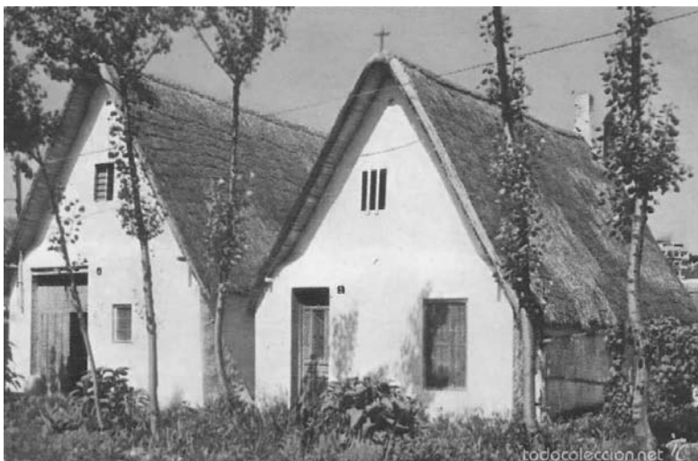
Fig. 3. Two Barraca huts in parallel arrangement, an old postcard. Source: [6]

Regarding ownership issues, it should be noted that the Barraca huts have served, depending on the surroundings in various proportions, both to the owners of huerta farms, and to their tenants, and sometimes also to agricultural workers. Some, small part of the Barraca type houses on the seacoast was inhabited by fishermen in the past, but only within the Bay of Valencia. These often combined income from fishing with the cultivation of a small huerta .