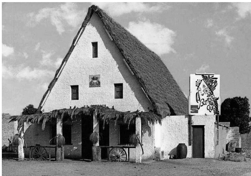
Fig. 4. An entertainment facility in a Barraca Valentina , 1960s. Source: [7]

The roof over the Barraca hut was traditionally gable and relatively high. The pitches could even reach a 60° slope. It is believed that this is due to precipitation, but according to the author, design considerations may have been decisive here. The roof has a rafter structure (with a beam in the ridge), sometimes without any spanning elements, such as collars. Its entire weight is transferred to external walls. The cover is customary thatch reed, but laid in a specific way, on a foundation made of a thick mat ( cañizo ). The rolled ends of the mats protect the thatch roofs, from the side of the peaks, from tearing them by the wind.