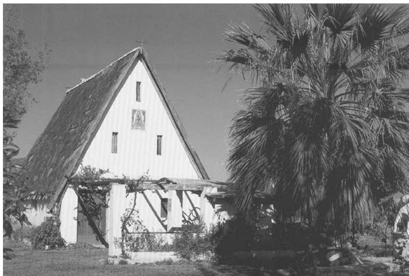
Fig. 2. The most typical form of Baracca Valenciana , an old postcard.

the eastern part of Spain. Geographically, the area is coastal plains that extend to a broader or narrower belt at the foot of the Iberian and Betycian Mountains. They run along the coast of the Mediterranean Sea from the Costa Blanca in the southwest, along the wide bay of Valencia towards the north-east, up to the Ebro estuary.