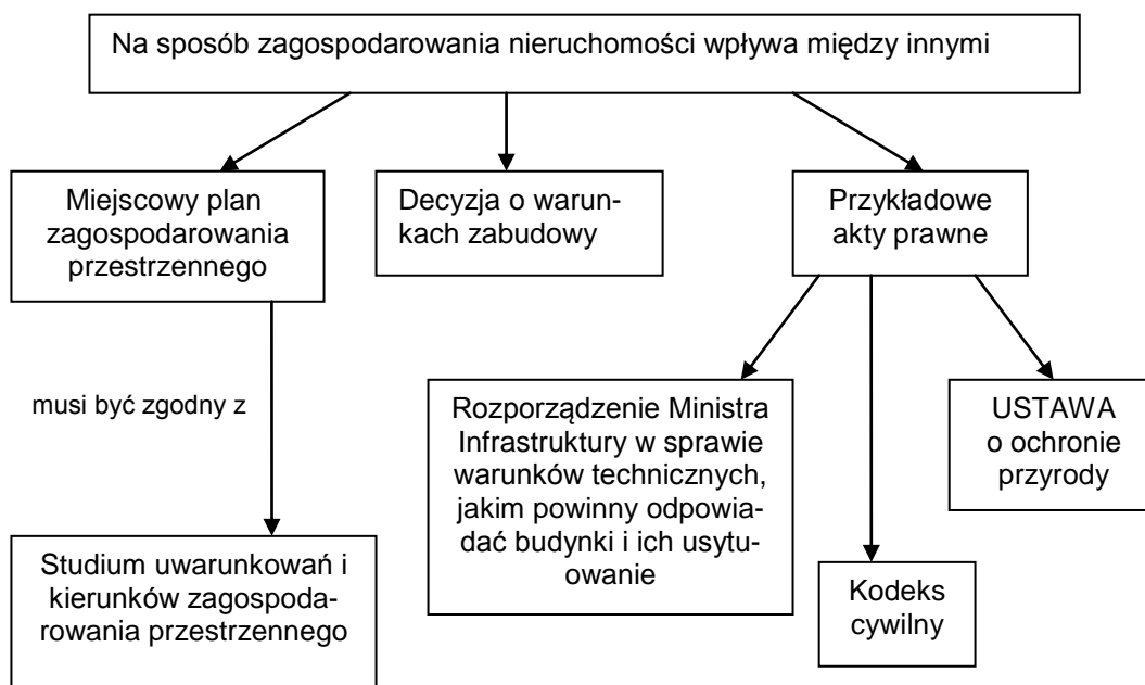
Ryc. 1 Schemat pokazuje jakie podstawowe elementy prawne wpływają na możliwość zagospodarowania nieruchomości, bez względu czyją jest własnością.

Pewne ograniczenia są regulowane prawem 1 (ryc. 1), o czym będzie w dalszej części artykułu.