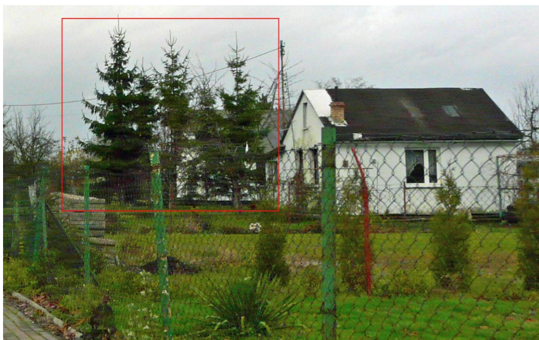
Ryc. 2 Zdjęcie pokazuje zbyt wysoką zieleń posadzoną na granicy między działkami zabudowy jednorodzinnej.

minimalną wielkość powierzchni biologicznie czynnej oraz wyposażenie w odpowiednie place, natomiast nie reguluje się spraw dotyczących nasadzeń. Przepisy, do których można się odnieść, dotyczące wszelkich nasadzeń na działce, również w zabudowie jednorodzinnej, znajdują się w Kodeksie cywilnym, którego między innymi Art. 144 przedstawia się następująco: Właściciel nieruchomości powinien przy wykonywaniu swego prawa powstrzymać się od działań, które by zakłócały korzystanie z nieruchomości sąsiednich ponad przeciętną miarę, wynikającą ze społeczno-gospodarczego przeznaczenia nieruchomości i stosunków miejscowych. Zacytowany artykuł stosowany jest w orzecznictwie sądowym między innymi do spraw dotyczących nasadzeń w szczególności krzewów i drzew. Zieleń posadzona zbyt blisko granicy działki może przeszkadzać właścicielom sąsiedniej działki poprzez zacielenie ogrodu, okien domu lub przesłanianie ciekawego krajobrazu. Może to być powód, żeby usunąć zieloną przesłonę. Problem może się pojawić, jeżeli jest to zieleń, którą można usuwać tylko za zgodą, o której jest mowa w Ustawie o ochronie przyrody. 3