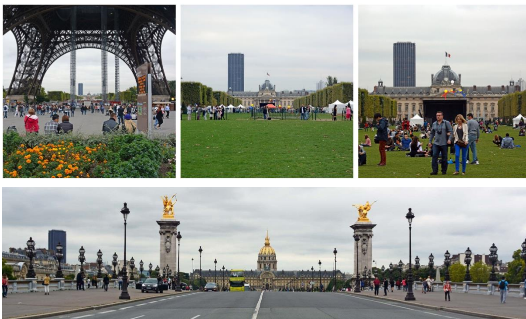
Fig. 4. Paris – Tour de Montparnasse seen from Champ-de-Mars and the Eiffel Tower (top) and along the axis towards the Les Invalides dome (bottom). The building distorts the symmetry of the urban composition.

One of the major examples of the above mentioned disharmony, which has gained bad fame in the world, is Tour de Montparnasse built in the centre of Paris in 1972. The tall building (210 m) dominates with its scale above the medium-height buildings in the area and it can be seen from a large number of locations around the city. Its negative visual impact is the strongest along some of numerous axes in Paris. It distorts a number of symmetrical arrangements, including the view from the Eiffel Tower towards Champ-de-Mars and the military school (fig. 4). It is one of the most popular vistas due to the Eiffel Tower, a prime tourist attraction. Other distorted vistas are those extending from Place de la Concorde and the axis towards the Les Invalides dome (fig. 4). In 2008, the tall building was declared the second ugliest building in the world [32]. It was concluded that its only attraction is the view of the city from its observation deck, only because the building cannot be seen from up there. The building was very controversial before it was built, so after its completion the City set height limits (1973) for buildings in the city centre and designated a new district of La Défense at the outskirts as a new location for tall buildings [31, p. 154].