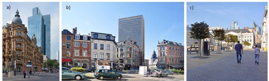
Fig. 3. Examples of negative impact of tall buildings in vistas encompassing streets and squares.

Ryc. 2. Zespoły budynków wysokich w relacji do historycznych centrów miast: a), b) dzielnica La Défense w Paryżu na zakończeniu Wielkiej Osi; c) oddalona o 5 km dzielnica wysokościorców Zuidas w Amsterdamie.