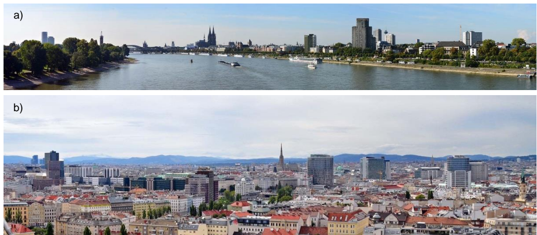
Fig. 1. Individual tall buildings obscure historical landmarks: a) Cologne – view from gondola lift towards the cathedral; b) Vienna – view from the Ferris Wheel in the Prater Park towards the old town and St. Stephen's Cathedral (middle).

Ryc. 1. Pojedyncze budynki wysokie osłabiają ekspozycję historycznych dominat: a) Kolonia – widok z kolejki gondolowej w kierunku katedry; b) Wiedeń – widok z Diabelskiego Młyna w parku Prater w stronę starego miasta i katedry św. Szczepana (na środku zdjęcia).