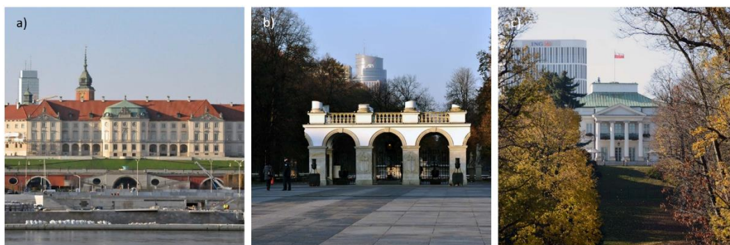
Fig. 6. Warszawa – examples of unfavourable relations between tall buildings and major historical monuments in the city: a) Royal Castle and tall building at Bankowy Square; b) Tomb of the Unknown Soldier and Warsaw Trade Tower; c) Belvedere seen from the Royal Łazienki Park and ING building at Unii Lubelskiej Square.

panoramic view from the Śląsko-Dąbrowski Bridge (fig. 6a) above the roof of the Royal Castle and it distorts the integrity of the castle. It is the first tall building in Warsaw which interfered with the beautiful panorama of the Old Town from the side of the Vistula River [21, s. 37]. Other tall buildings are grouped near the Palace of Culture and Science, away from the axis leading to the Castle. In panoramic views from the Vistula River, they form a compound second wall. Yet another self-contained tall building which distorts the symmetry of the axis is the Warsaw Trade Tower. 4 It was erected at the extension of the Saska Axis (fig. 6b). It can be seen above the Tomb of the Unknown Soldier from the side of Marshal Józef Piłsudski Square. Moreover, in the same panoramic view from the Śląsko-Dąbrowski Bridge, its view clashes with the tower of the St. Anna Church [23, p. 37].