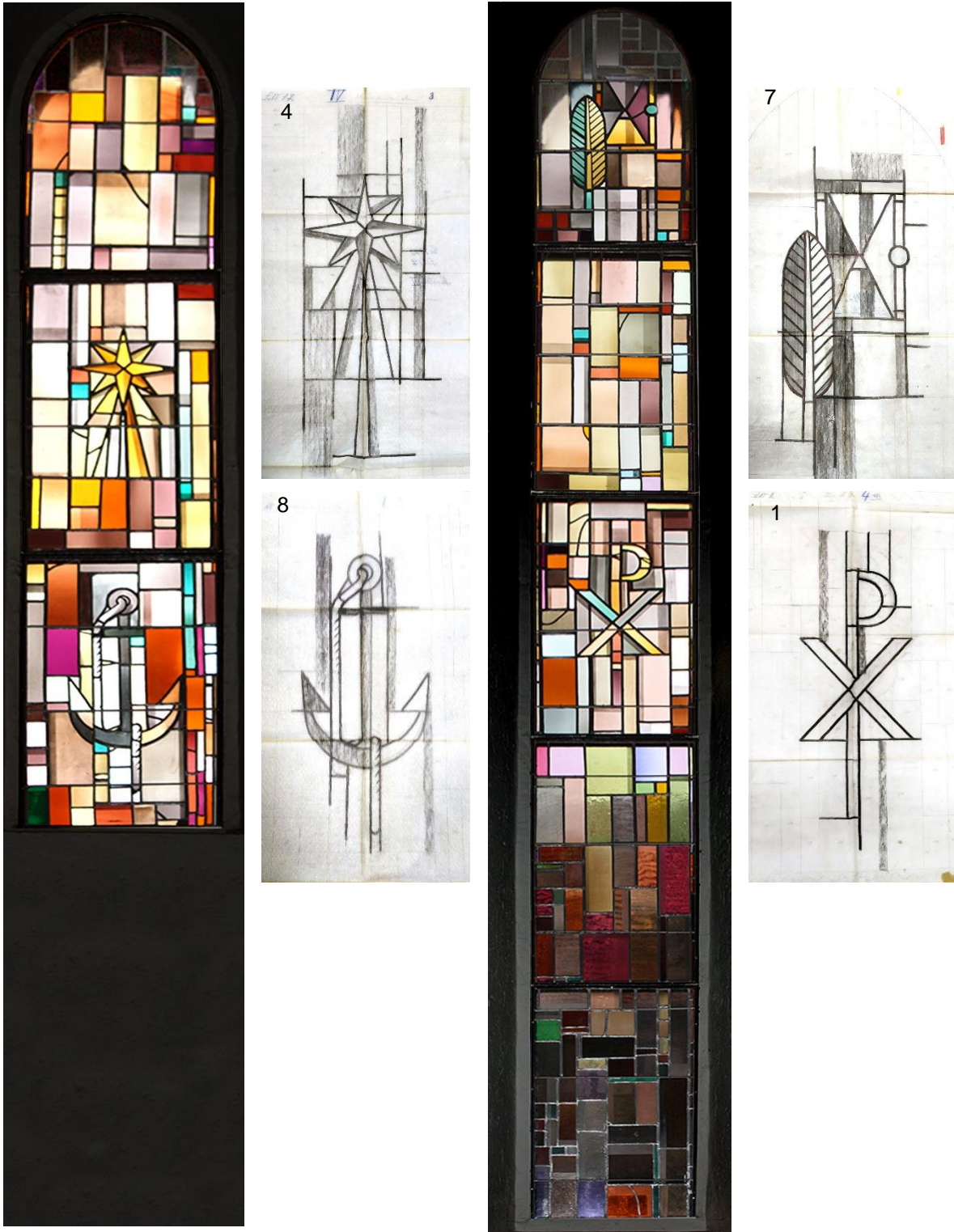
Fig. 4 Two of stained glass from lower part of north-west elevation of the nave and design cartoons with figurative motifs ( 4, 8, 7, 1 ) being dedicated to them.

Ryc. 4 Dwa witraże z części dolnej elewacji pn.-zach. nawy oraz przeznaczone do nich kartony projektowe (4, 8, 7, 1) z motywami przedstawieniowymi.