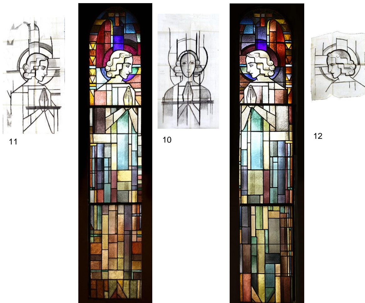
Fig. 3 Two of the three original stained glass windows preserved till today in an apse adjacent to the west porch and original design cartoon 10, 11, 12 with figural motifs dedicated for these stained glass windows. In the middle, a cartoon 10 for not existing stained glass, which was probably located on the axis of symmetry of the recess (now replaced by a stained glass window with Marian motifs).

Ryc. 3 Dwa zachowane do dziś z trzech oryginalnych witraży w apsydzie przyległej do kruchty podwieżowej oraz oryginalne kartony projektowe 10, 11, 12 z motywami figuralnymi do tychże witraży; na środku karton 10 z witraża niezachowanego, który znajdował się zapewne na osi symetrii wnęki (obecnie zastąpiony przez witraż z motywami maryjnymi).