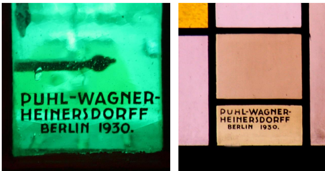
Fig. 1 Glass panes with the stained glass manufacturer's signature. To the left a panel in origing from the stained glass window in the north-west facade of the tower. To the right a panel from the stained glass window located on the edge of the upper part of north-west elevation of the nave.

The tower section that forms the entrance avant-corps was highlighted by topping it with a different profile, composed of a layer of vertically laid bricks, three layers of horizontally laid bricks, with the lower and upper layer protruding from the wall's surface, and another strip of vertically laid brick above.