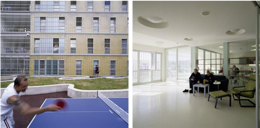
Fig. 8. Leoben Centre of Justice: a courtyard and an open space with natural lighting.

Such a design has led to more successful rehabilitation of prisoners and has put human life first. The Justice Center in Leoben has won the following awards: ULI – Urban Land Institute for Excellence 2009 in Europe, Middle East and Africa; Architecture prize of Styria Province 2004, Geramb-Rose, in appreciation for excellent construction 2006 [10,13].