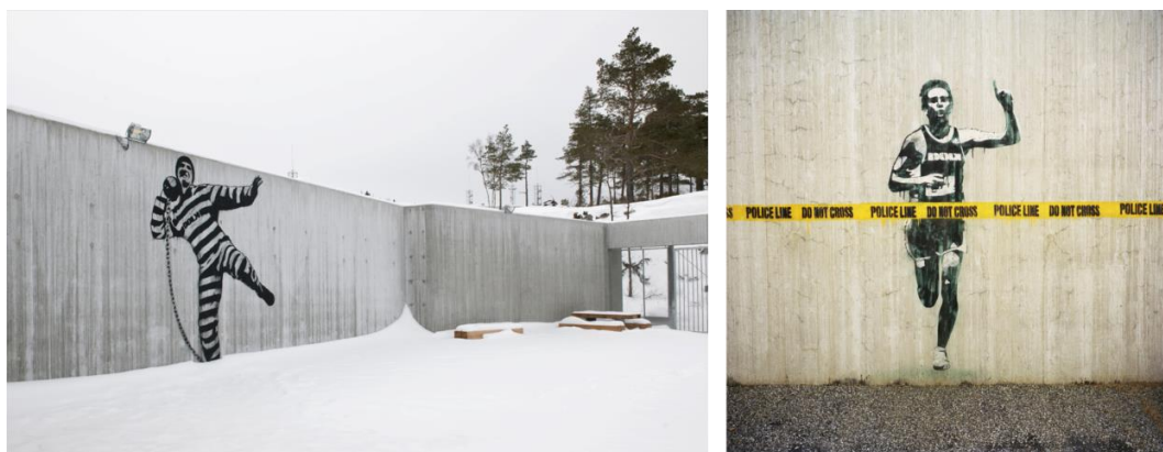
Fig. 1. Halden Prison: Murals made by Norwegian graffiti artist - Dolk. Source: [11] [12]

The aim of this project was to provide the highest standards of security while simultaneously respecting human rights, making it one of the best examples in the field of penitentiary architecture. Living conditions inside this facility were designed to be as similar to those on the outside as possible in order to allow the prisoners the chance to take part in the normal, daily routines of life away from prison. The housing blocks are separated from areas for activities and work. All the inmates participate in recreational, cultural and educational activities [10, 11].