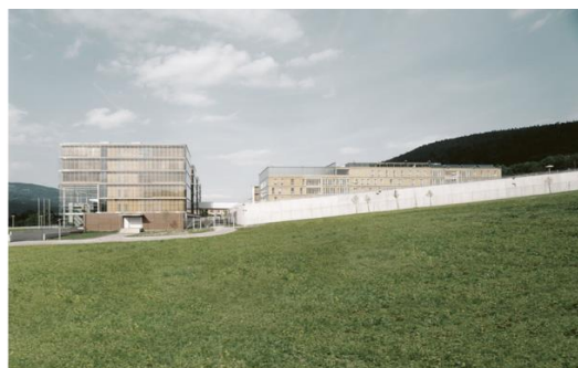
Fig. 7. Leoben Centre of Justice: on the left: a view of the Court – Part ; on the right: a view of the Prison - Part. Source: [13]

Ryc.7. Leoben Centre of Justice: po lewej: widok na część zajmowaną przez sąd; po prawej: widok na część zajmowaną przez więzienie. Źródło: [13]