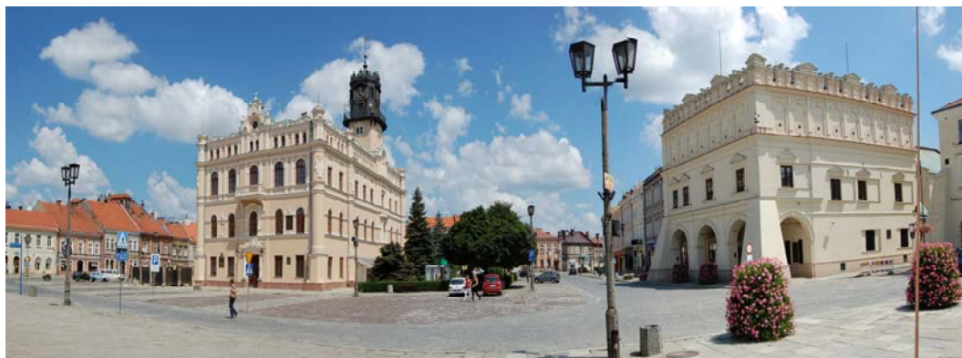
Ryc. 1. Panorama Rynku – Ratusz i kamienica Orsetti.

Fig. 1. Panorama of Market Square – Town Hall and Orsetti's House.