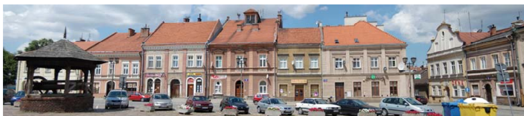
Ryc. 11. Kamienice przy Rynku.

Rewitalizacja miasta, oprócz jego ożywienia turystycznego, przyniesie wymierne efekty także jego mieszkańcom. Rynek, obecnie zaniedbany i służący głównie za parking, zacznie znów tętnić życiem; zabytkowe kamienice i uliczki odzyskają dawny blask, stając się siedzibą kawiarenek i hoteli, turyści zaczną chętniej odwiedzać miasto, co przełoży się na dochody z turystyki. Rewitalizacja pociągnie także za sobą nowe miejsca pracy – szczególnie w turystyce, co zachęci do osiedlania się i pozostawiania w Jarosławiu, a ten fakt z kolei – na rozwój miasta.