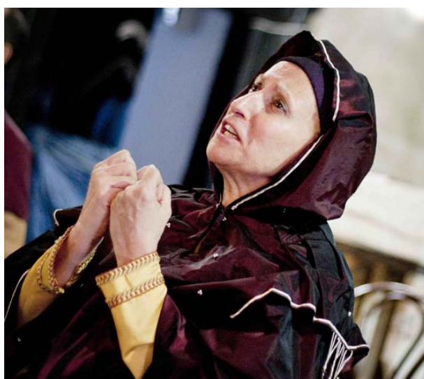
Ryc.10. XX Festiwal Muzyki Dawnej – Pieśń Naszych Korzeni, 2012.