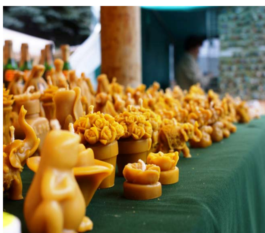
Ryc. 3. III Jarmark Benedyktyński w opactwie, wrzesień 2013.

Popularność krakowskich jarmarków na Rynku Głównym (m.in. bożonarodzeniowego i wielkanocnego) czy bożonarodzeniowych jarmarków w Kolonii pozwala domniemywać, iż przedsięwzięcie to ma szanse powodzenia ze względu na przychylność społeczną. Zaletą jest również położenie miasta – u zbiegu głównych szlaków komunikacyjnych – kiedyś bursztynowego i śląsko-ruskiego, dziś blisko granicy Polski z Ukrainą, przy międzynarodowej trasie A4/E-40. Dodatkowo tradycja targowa w Jarosławiu wciąż jest żywa (wystarczy popatrzeć na popularność bazarów i hali targowej) – możliwe więc, że w wersji uporządkowanej i unowocześnionej ma szansę na przebicie się na rynku ponadlokalnym.