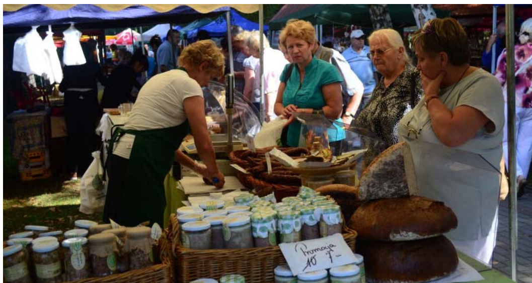
Ryc. 5. IV Jarmark Benedyktyński w opactwie, wrzesień 2014. Źródło: [14]

Fig. 4. The third Benedictine fair, september 2013. Source: [14]