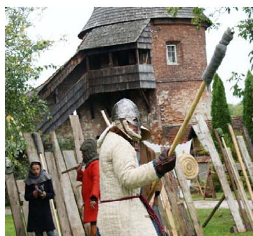
Ryc. 4. III Jarmark Benedyktyński w opactwie, wrzesień 2013. Źródło: [14]

Fig. 3. The third Benedictine fair, september 2013. Source: [14]