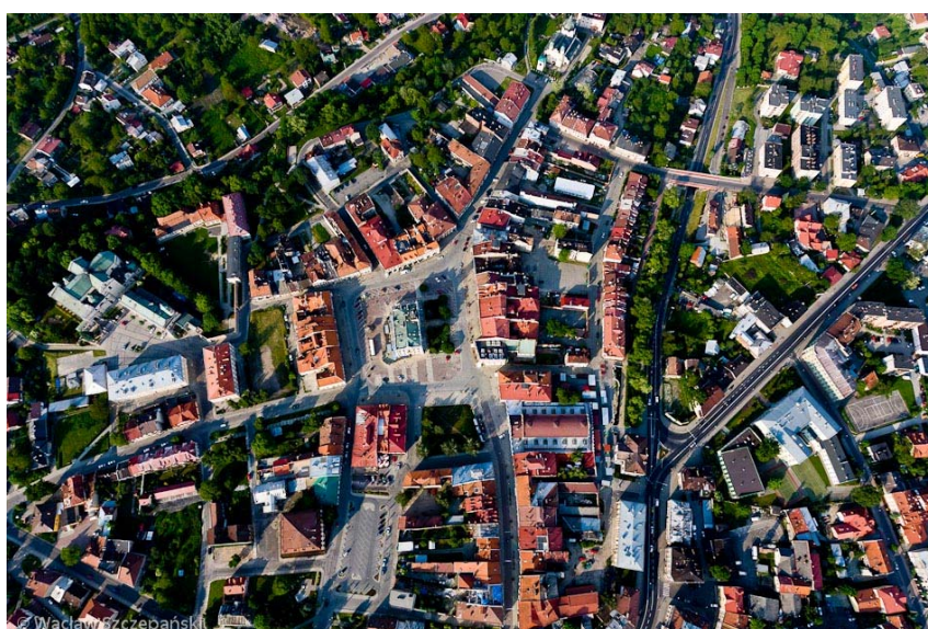
Ryc. 8. Stare Miasto z lotu ptaka. [15]

Nobilitacja ta sprawi, że Jarosław także stanie się rozpoznawalny, będzie to początek tworzenia marki miasta. Promocja i prestiż bezpośrednio przełożą się na korzyści dla miasta – zarówno niematerialne, jak i finansowe, a samo miasto dołączy do elitarnego grona ośrodków o ugruntowanej pozycji i renomie. Tytuł Pomnik Historii zwiększy także konkurencyjność Jarosławia, stając się jego reklamą.