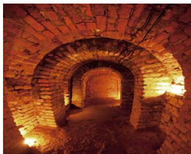
Ryc. 7. Podziemna Trasa Turystyczna, 2012.

Fig. 6. The Underground Touristic Route named after Prof. F. Zalewski, 2012.