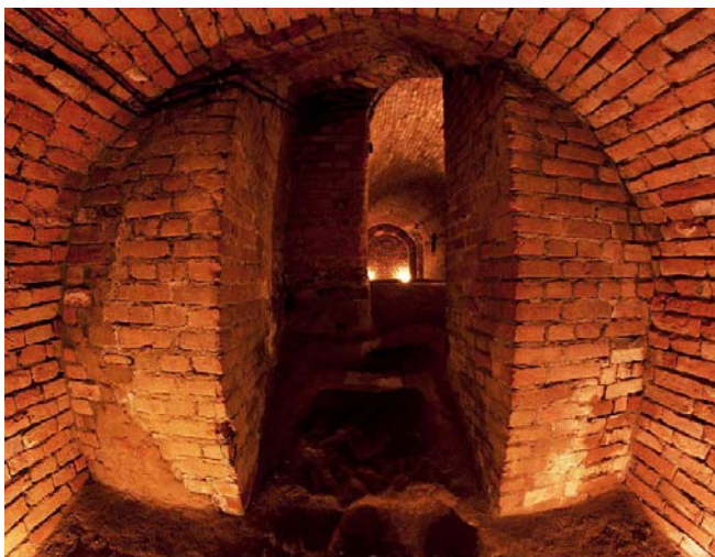
Ryc. 6. Podziemna Trasa Turystyczna im. Prof. F. Zalewskiego, 2012.

Koncepcja ta wymaga zdecydowanie większych nakładów finansowych niż obecna propozycja Urzędu Miasta, jest jednak realna, a to odważne posunięcie mogłoby w przyszłości znacznie zapocentować.