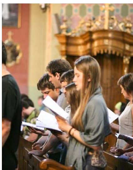
Ryc. 9. XXI Festiwal Muzyki Dawnej – Pieśń Naszych Korzeni, 2013.