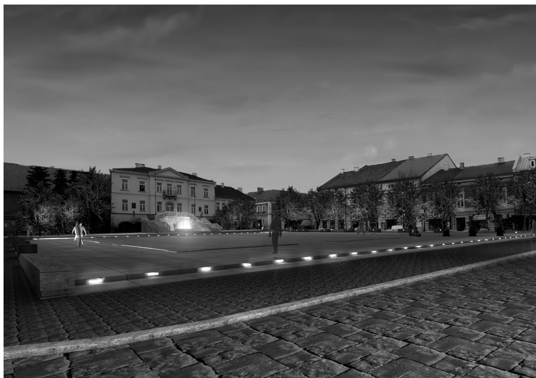
Ryc. 2. Wizualizacja jednego projektu rewitalizacji w Małopolsce powstałego w wyniku konkursu architektonicznego, Rynek Górny – po rewitalizacji (projekt) Wieliczka (oprac.: Studio Projektów Sc. EKSP0, 2007), źródło: Strona internetowa miasta Wieliczka.

nych wewnątrz rynkowych 13 . O, ile LPR-y zostały wykonane według ścisłej instrukcji postępowania (i tak często łamanej). O, tyle projekty już nie i to spowodowało, że w ich przypadku możemy mówić głównie o regeneracji 14 przestrzeni. W, tym kontekście należy zgodzić ze słowami W. Kosińskiego dotyczącymi braku tworzenia miejsc w miastach. Ta największa akcja realizacji przestrzeni publicznych w okresie powojennym województwa małopolskiego przyczyniła się do poprawy ich standardów technicznych, ale równocześnie zaprzepaszczono możliwość stworzenia nowej jakości przestrzeni publicznych i określenia nowych funkcji dla rynków, tych miast w XXI w.