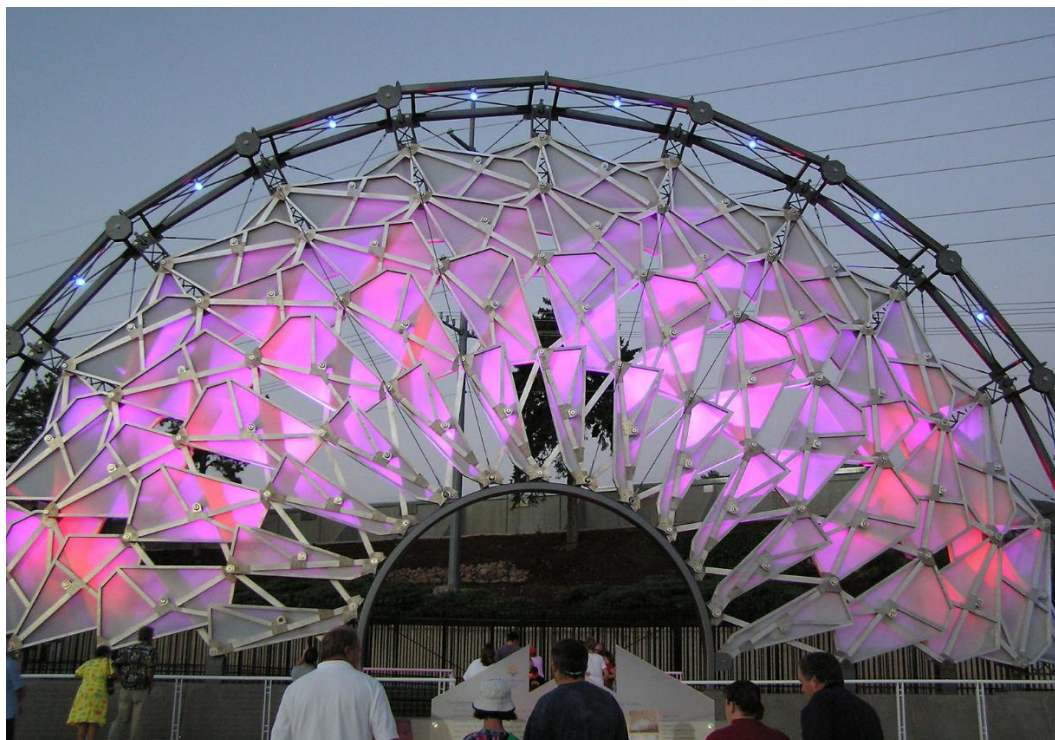
Fig. 3. A modern form of application of kinematic architecture, Hoberman Arch 2002

been able to show the potential of geometry to create spatially complex structures from simple components, where each of the designed panels can function independently or the facade as a whole can create complicated simulations showing any geometric patterns. [11] Visually, one can find great similarity to the classic Jean Nouvel's facade from 1987, created for the needs of the Arab World Institute.