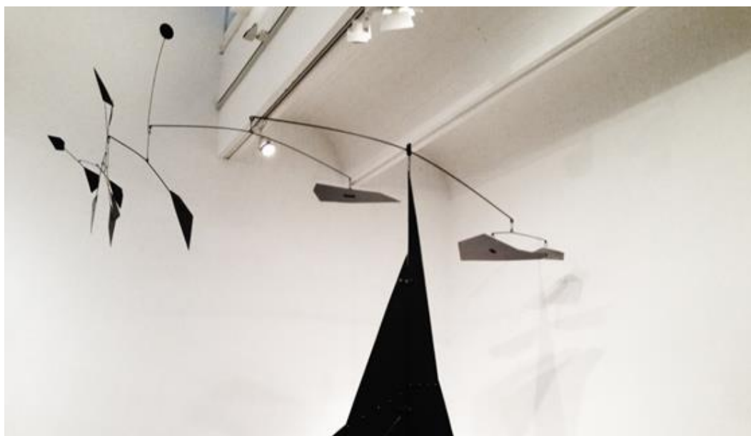
Fig. 1. Kinetic sculpture based on the principle of balance, Alexander Calder – El Corcovado 1951, Source: Jan Cudzik, 2015

For theoreticians of the perception of space from the late nineteenth century, space had kinematic features, because it was associated with the reception in motion. The contemporary observer can remain motionless and space can be perceived as a variable because it undergoes actual transformations due to the application of kinematic solutions. Many artists explored that field to achieve unique spatial effects. Starting in the early 1910s with Marcel Duchamp's Bicycle Wheel that can be considered first kinetic sculpture. The movement was also presented in the form of balance, an example of such is El Corcovado (Fig. 1) created in 1951 by Alexander Calder. At the time artists were inspired not only with new philosophical theories but also by photography, where artists experimented with diverse techniques to capture movement. In this aspect, the time-varying spaces presented by Duchamp, Calder or László Moholy-Nagy in the form of kinematic sculptural installations can be considered as precursors to contemporary kinetic architecture. [5]