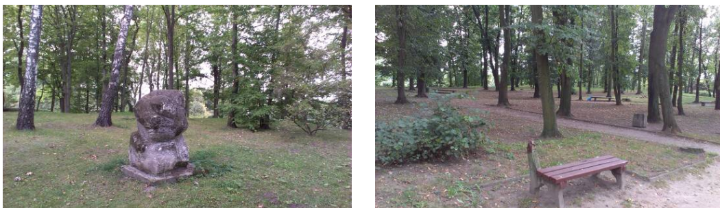
Ryc. 4. Elementy zdewastowane małej architektury. Fig. 4. Elements devastated landscape architecture.