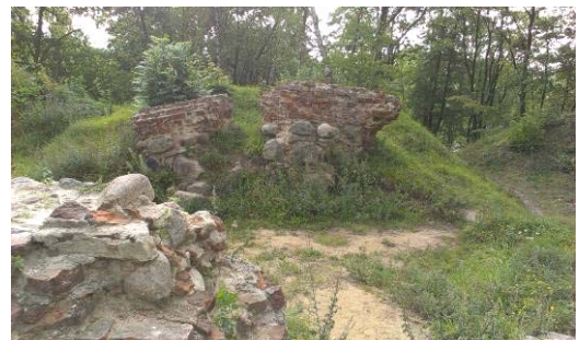
Ryc. 6. Niewyeksponowane ruiny zamku biskupiego, położone na szczycie Góry Zamkowej, stanowiące najciekawszy zabytek miasta.

Fig. 6. Underexposed Episcopal castle ruins, situated on the top of the Castle Hill, which are the most interesting monument of the city.