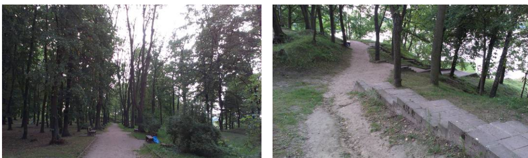
Ryc. 3. Najstarsza część parku, silnie zdegradowana. Fig. 3. The oldest part of the park, heavily degraded.