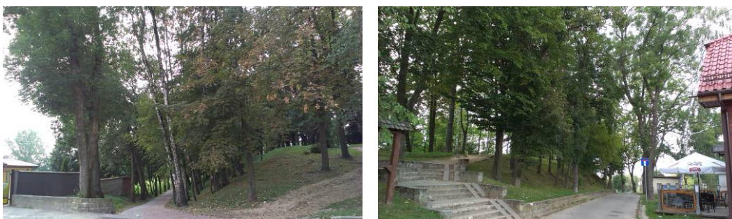
Ryc. 2. Brak wypracowanej głównej strefy wejściowej do parku miejskiego. Fig. 2. None developed the main entrance area to the city park.

mona i Judy Tadeusza, dawny kościół ewangelicki, obecnie kościół rzymskokatolicki pw. Matki Boskiej Królowej Polski, budynek sądu grodzkiego wraz z willą sądową i ogrodem oraz liczne kamienice [7, s. 8–10].