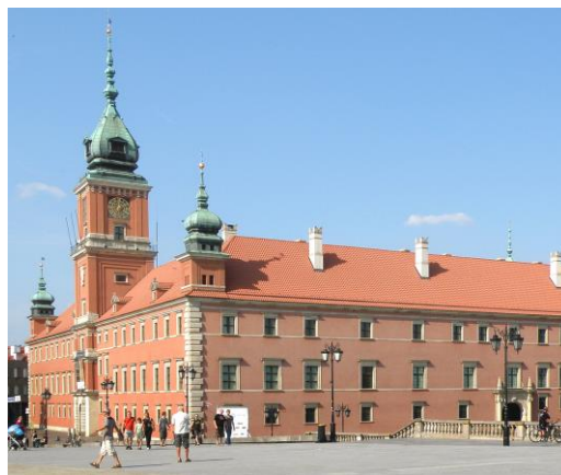
Fig. 8. The Royal Castle in Warsaw - condition after reconstruction in 1984.

Ryc. 7. Ruiny Zamku Królewskiego w Warszawie.