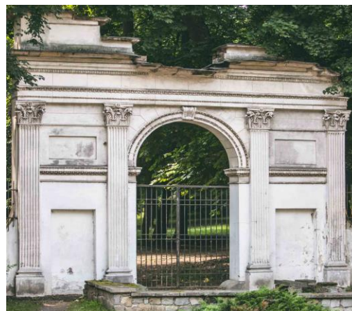
Fig. 12. A romantic ruin in the form of the Arch of Titus in the Izabela Czartoryska Park in Puławy.

Ryc. 11. Rzymska Ruina w ogrodach Pałacu Schönbrunn w Wiedniu.