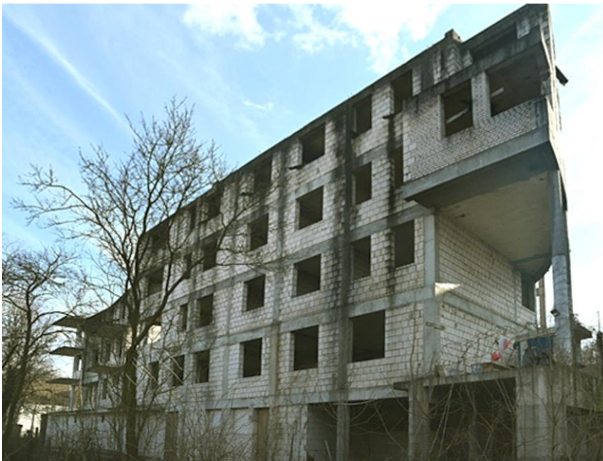
Fig. 10. Ruin of an apartment block on Emaus in Krakow.

New ruins - the ruins of a new building that has never been completed or has turned to ruin due to lack of use or abandonment. This is a paradoxical state in that it is, as it were, a state of suspension between the future and a state of complete disappearance, with the leaping over the present state as a state of use. More often than not, such ruins arise when the creator's or builder's ideas of the actual needs of the user diverge glaringly. The communist government's idea of the needs of the working people was a prime example of this. After all, it was at that time that whole housing estates of blocks of flats were built with shared toilets on the first floor, designed to serve several flats at the same time, where the Western European standard was already a bathroom in the flat. "Making people happy by force" may be another of the reasons for this state of affairs. The developer, believing that he knows better what the market needs, without having researched it beforehand, experiences a painful lesson when the finished building or the flats in the new building do not find buyers. By going bankrupt then, he leaves behind a 'new ruin' which, only after being demolished, can make room for new investments. These are unintentional ruins.