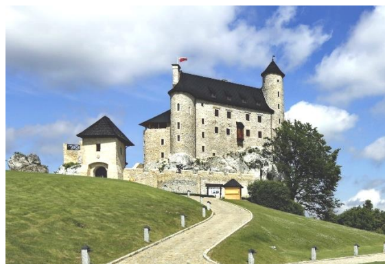
Fig. 3. Bobolice Castle after revitalization. Reconstruction based on scientific research lasting 6 years and performed by Polish scientists.

Ryc. 2. Ruiny Zamku Bobolice, stan destrukcji integralnej części zamku przed rekonstrukcją.