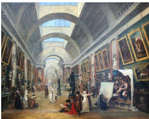
Fig. 13. Hubert Robert – Design of the Grand Gallery in the Louvre, 1796.

moment, or even more: made to last in this state indefinitely. This is perverse and illusory insofar as 'ruin' is synonymous with destruction and decomposition, while 'permanence' is synonymous with ametamorphousness and immortality. Adding the adjective 'permanent' to something that, for example, was produced in excess during the Second World War, condemning tens of thousands of Polish monuments to death, made something that by its very nature we should be ashamed of, something we should weep over, something we should oppose, suddenly become innocent, positive, acceptable. It is impossible not to look for the genesis of the notion of "permanent ruin" in the ideological conditions of the concepts of rebuilding Poland after the destruction of the war, especially Warsaw. Perhaps due to the influence of the so-called consultants, Sergei Chernyshev, chief architect of Moscow, or Viktor Baburov, assigned by the Soviets to Jozef Sigalin, to consult on projects for the reconstruction of the Capital, according to which the Old Town, Nowy Świat, Krakowskie Przedmieście, were to be a historical enclave, a kind of open-air museum, with "permanent ruins", surrounded by a sea of modern apartment blocks in the Soviet fashion. But who was the first to use this manipulated and contradictory term, 'permanent ruin', is not known today.