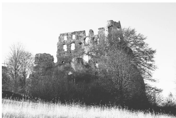
Fig. 2. Ruins of Bobolice Castle, state of destruction of an integral part of the castle before reconstruction.

The present considerations are based on the author's practical and theoretical experience gathered during several decades of revitalisation of Bobolice Castle (Fig. 2, 3), Mirów Castle and many other monuments. The revitalisation works, preceded by a study of archival documents - including preserved iconography, inventories, descriptions, chronicles, archaeological and architectural research, as well as specialist research of the structure and form based on preserved threads and material traces, carried out by research teams from the Jagiellonian University and the University of Łódź - history of art and archaeology, the Cracow University of Technology – architecture, construction and technology, and researchers from various other universities, have made it possible to 'decipher' quite accurately the entirety of the foundation, the individual threads of masonry, the layout of all rooms and the individual phases of the creation of these buildings, where the oldest documents concerning Bobolice dated its elements to the years 1350-1352 (Lasecki 2024).