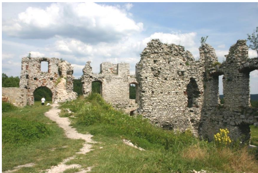
Fig. 1. Ruin of the castle in Rabsztyn.

In the Polish literature on the conservation of monuments, so many terms related to ruin have already been coined that it is difficult to find one's way around them. It is not easy to determine which of them, belong to the workshop vocabulary of conservators and creators of various conservation doctrines. Which of them are "wanted", which are "positive", and which, as being rather decidedly negative and destructive, should be forgotten, as they are associated with a collective shame, a lack of care for monuments that have passed away precisely because a work of art, a monument, a souvenir or just a plain old object has turned into ruin. The phenomenon of the very notion of "ruin" lies in the fact that, despite its pejorative overtones, it arouses the romantic imagination, purging it, as it were, of negative meanings, connotations and associations. The term ruin itself is quite clearly defined in the Polish language. It is nothing but "a state of destruction, devastation" (Słownik, 2012). A ruin, on the other hand, is defined as: "the remains of destroyed buildings".