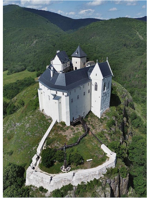
Fig. 15, 16. Fuzer Castle in Hungary, in ruins for several hundred years, before and after reconstruction.

Ryc. 15, 16. Zamek Fuzer na Węgrzech, będący kilkaset lat w ruinie, przed i po rekonstrukcji.