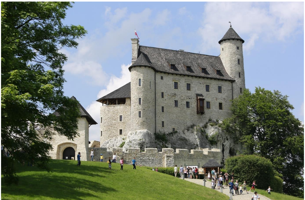
Fig. 17. Bobolice Castle after reconstruction, available to tourists. After years of scientific research, it emerged from ruin. Today, his participation in social life is full.

Ryc. 15, 16. Zamek Fuzer na Węgrzech, będący kilkaset lat w ruinie, przed i po rekonstrukcji.