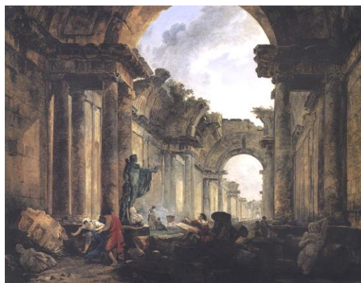
Fig. 14. Hubert Robert, The Imaginary Ruin of the Grand Gallery in the Louvre, 1796. Source: Louvre Museum.

Ryc. 13. Hubert Robert – Projekt Wielkiej Galerii w Luwr, 1796. Źródło: Robert H.