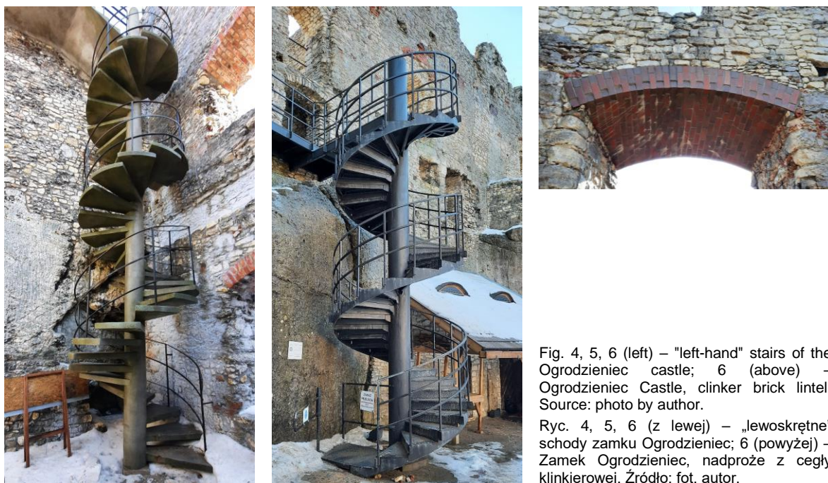
Fig. 4, 5, 6 (left) – "left-hand" stairs of the Ogródzieniec castle; 6 (above) – Ogródzieniec Castle, clinker brick lintel.

of tension (Mackiewicz 2024). With changes in temperature and humidity, masonry elements naturally, in their own way, shrink and swell, which always leads to damage. After a few years, without the protection of a roof, any such masonry structure will deteriorate (Potocka 2001). So it is not sustainable. It can be seen, if only from this example, that a ruin, no matter how secured, will never be permanent. (Unless a building is built around it to protect it from the outside elements. Just what sense does that make?) It will be a ruin that, constantly repaired, will exist, but will no longer have much in common with its original, authentic matter and authentic structure (Jasieńko 2011). That is, it will not be a monument. Therefore, it is important to remember that there are no permanent ruins.