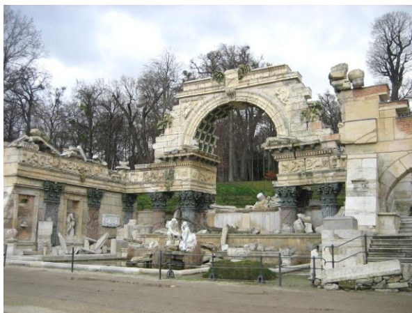
Fig. 11. Roman Ruin in the gardens of Schönbrunn Palace in Vienna.

Ryc. 11. Rzymska Ruina w ogrodach Pałacu Schönbrunn w Wiedniu.