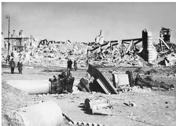
Fig. 7. Ruins of the Royal Castle in Warsaw.

Ryc. 7. Ruiny Zamku Królewskiego w Warszawie.