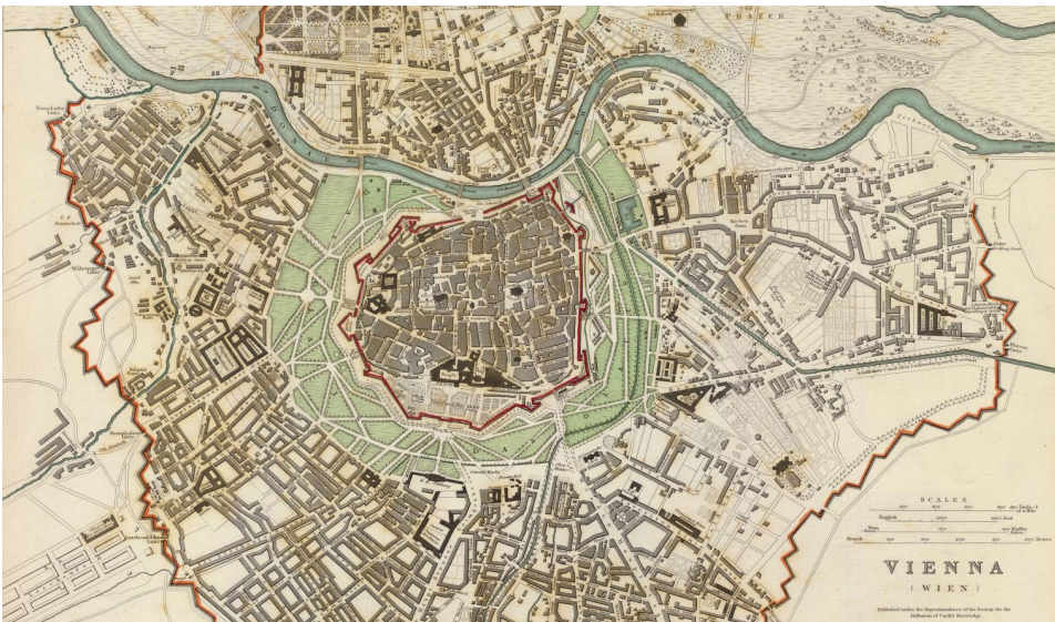
Ryc. 2. Wiedeń, 1833 r.

Promenada w Münster (ryc. 3.) w Niemczech jest jednym z najważniejszych zabytków miasta. Ciągnie się na długości około 4,5 km i tworzy zielony pierścień wokół centrum, wyraźnie oddzielając stare miasto od sąsiednich dzielnic.