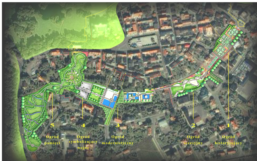
Ryc. 5. Park Disy – Projekt zagospodarowania terenu pszczyńskich plant. W

tym zachowanie cennego układu urbanistycznego oraz podkreślenie jego istoty. Ważną rolę odgrywa tu spójność założenia pałacowo-parkowego i Starego Miasta.