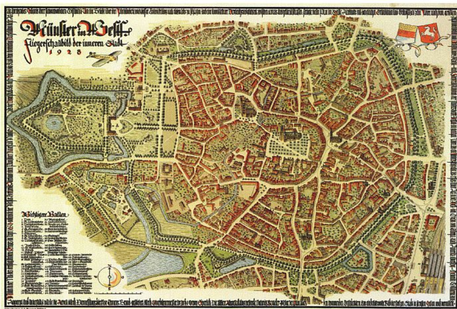
Ryc. 3. Münster – widok z lotu ptaka 1928.