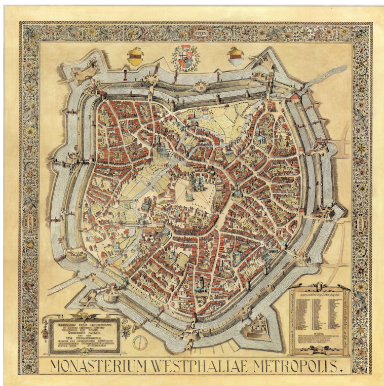
Ryc. 1. Plan miasta Münster 1636. Fig. 1. City Map of Münster 1636.

Poprzez mury obronne, wzmocnione wieżami i bastionami, nastąpiło architektoniczne i urbanistyczne zamknięcie miasta na otaczający krajobraz, a życie mieszkańców skupiło się wewnątrz grodów (Rys.1). Jeśli wewnątrz brakowało miejsca, wytyczano nowe miasto – nawet w bezpośrednim sąsiedztwie starego 3 .