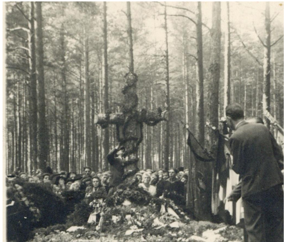
Fig. 2. One of the graves in the Piaśnickie Forests during the ceremony. Date and author: unknown.

The first actions concerning the commemoration of the burial sites were taken in secret by the local inhabitants and the families of the victims already during the war. These activities consisted, among other things, of cutting the sign of the cross in the bark of the trees growing near the camouflaged graves or of laying stones on them. Exhumations and official burials were only possible after the Germans left Pomerania in 1945. Preparations then began to permanently mark the graves in the Pomeranian forests and to build memorials (Kubicki 2023, p. 145). The first monuments and cemeteries were erected back in the 1940s. (Fig.2). Today, more than 80 years after the crimes, in many forests the old forms of commemoration are being renovated. New monuments are also being erected, such as those in the Szpęgawski Forest (2019) and monuments on mass graves in the Piaśnickie Forests (2023).