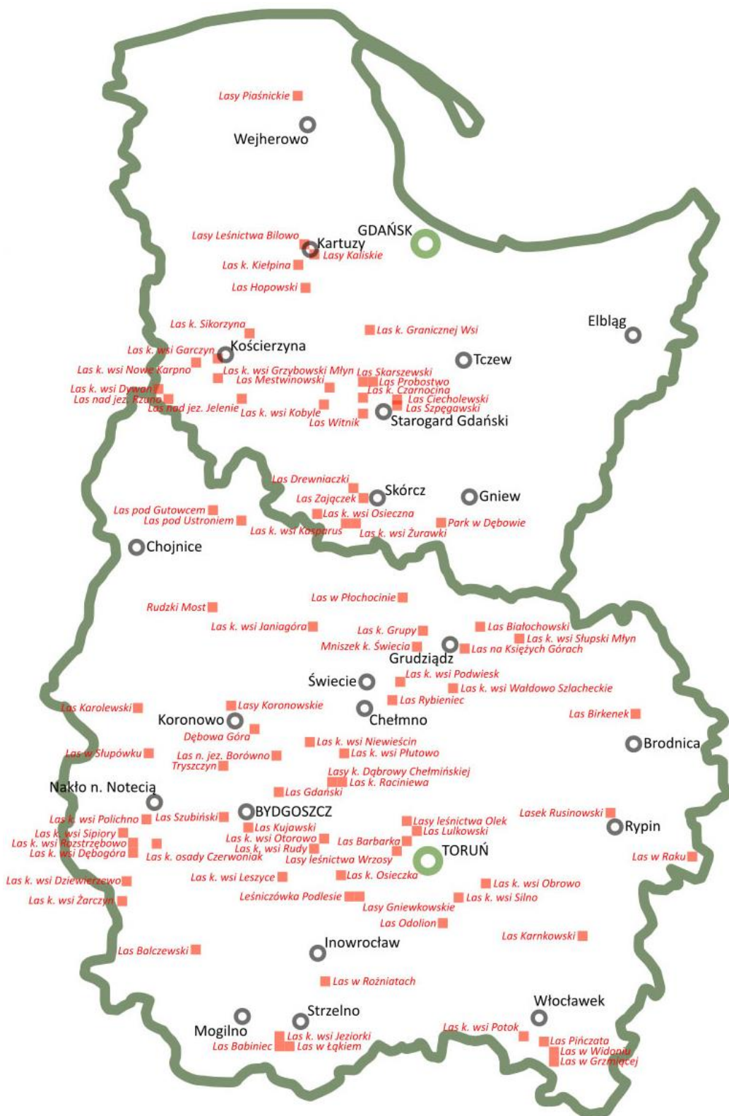
Fig. 4. Sites of Pomeranian Crime of 1939 in the forests of Pomerania and Kuyavia administered by the Regional Directorates of State Forests in Gdańsk and Toruń.

Ryc. 4. Miejsca Zbrodni Pomorskiej 1939 roku w lasach Pomorza i Kujaw w zarządzie Regionalnych Dyrekcji Lasów Państwowych w Gdańsku i Toruniu.