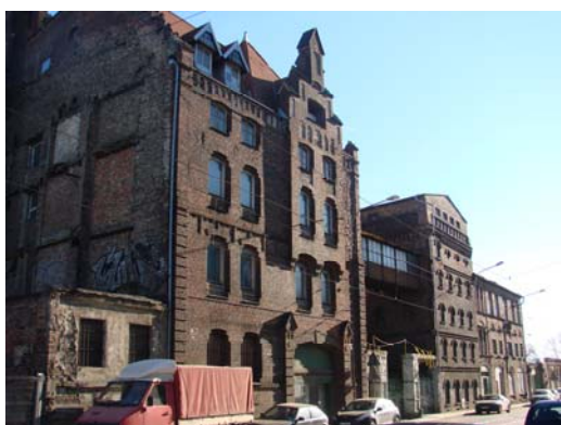
Fig. 10. C. Lefever's factory - view from Kolumba Street, 23.02.2019r.

and adopting factory buildings for hotel and exhibition purposes. This area in the historical context (regularly held events under the SS gate, strikes, martyrdom, political happenings), is the carrier of tourist demand. From an urbanistic point of view, the shipyard is a "city in the city" - a kind of urban island with a unique character. It has a convenient communication connection with Wały Chrobrego - a place of cyclically celebrated events, such as Days of the Sea, The Tall Ship Races , Pyromagic Festival of Fireworks .