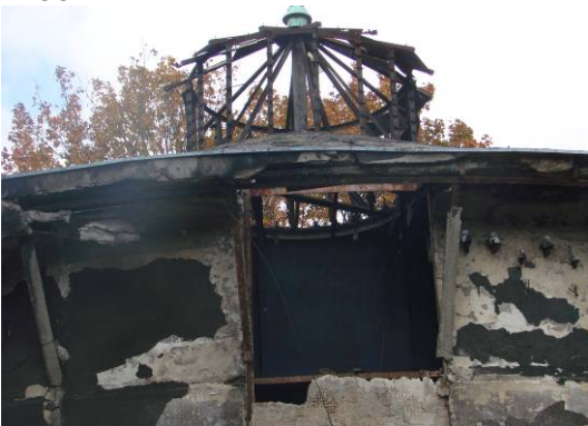
Fig. 6. Steel structure of the wall and roof of a degraded water tower, 2012. Ryc. 6. Stalowa konstrukcja ściany i dachu zdegradowanej wieży ciśnień, 2012r.