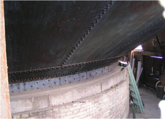
Fig. 4. Intze steel container in the interior of the degraded water tower 2012. Ryc. 4. Stalowy zbiornik typu Intze we wnętrzu zdegradowanej wieży ciśnień, 2012r.

gine, workshops, a railway turnstile. On the western side it borders with Potulicka street with a tram track located there.