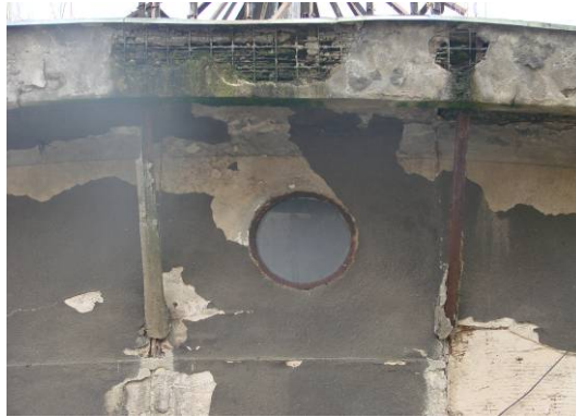
Fig. 5. Metal window opening, 2017. Ryc. 5. A metal window opening of a degraded water tower, 2017r.