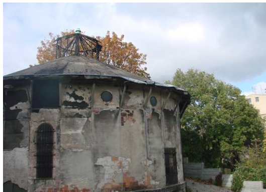
Fig. 7. Land development around a degraded water tower, 2012. Ryc. 7. Zagospodarowanie terenu wokół zdegradowanej wieży ciśnień, 2012r.