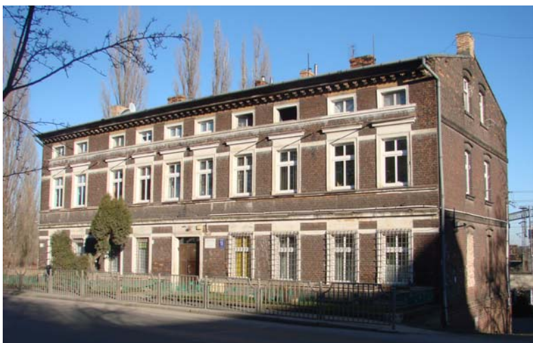
Fig. 13. Administrative building of Huta Kraft, 23.02.2019r.

Proposed function of the object. Due to the location, size and form described, the building meets the requirements for small accommodation and catering facilities. The location near the road leading from Szczecin to Police and further to Trzebież and Nowe Warpno, a place for a car park behind the building and the lack of accommodation facilities in the area is well argued for the proposed tourist use of the object.