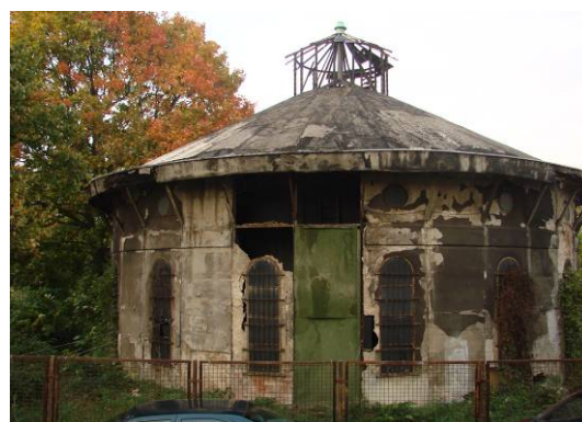
Fig. 3. View of a degraded water tower, 2012 r.