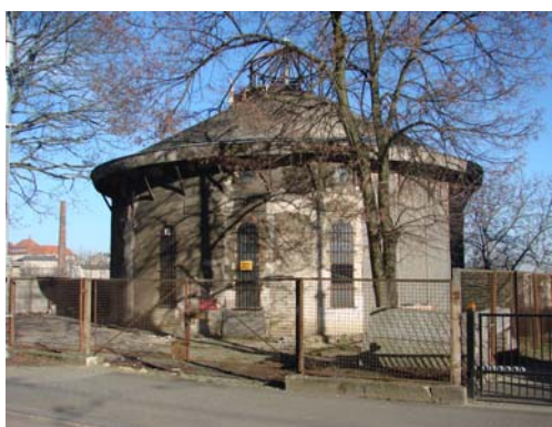
Fig. 2. View of a degraded water tower, 23.02.2019r.

structures (Fig. 5, Fig. 6). Compared to the state of the 2012 facility, fewer original elements have been preserved, however, the condition of the object allows its exact reproduction and modernization, keeping the form close to the original (Fig. 2, Fig. 3). There are several trees of common species located irregularly on the site, wild shrubs, the whole is overgrown with grass, unordered (Fig. 7). From the Potulicka street (west side) through a larger plot area, the area gently descends to the end of the plot where on the eastern side there is a high slope (Fig. 8). The whole plot is fenced in a fence made of a metal grid about two meters high with an entrance gate (Fig. 9) [14]. The investment area is included in the Local Spatial Development Plan "Nowe Miasto-Potulicka" from 2007 [8].