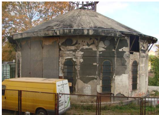
Fig. 9. Fence of a degraded water tower, 2012. Ryc. 9. Ogrózenie zdegradowanej wieży ciśnień, 2012 r.