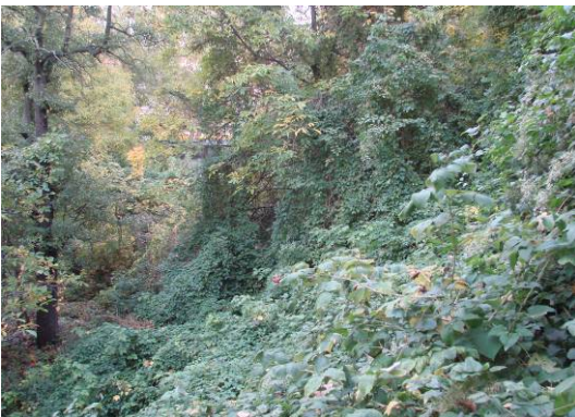
Fig. 8. Escarpment at the bottom of a degraded water tower, 2012. Ryc. 8. Skarpa u podnóża zdegradowanej wieży ciśnień, 2012r.