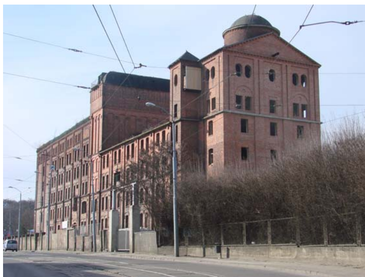
Fig. 12. Steam mill - view from Dębogórska Street, 23.02.2019r.

Proposed function of the object. Due to the large cubature of the building and rich history, proposals for its use do not have to be limited to one function. In addition to the accommodation and hotel function, the facility could also include conference and exhibition rooms as well as a museum section related to the history of the Szczecin industry. The revitalization of the mill would undoubtedly have a positive effect on the image of Żelchowa and other northern districts of Szczecin.