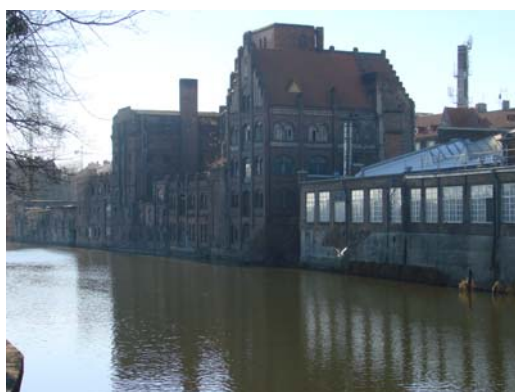
Fig. 11. C. Lefever's factory - view from the Odra River, 23.02.2019r.

Ryc. 10. Fabryka C. Lefewer'a – widok od ul. Kolumba, 23.02.2019r. Źródło: autor