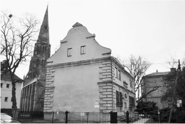
Fig.3 The Old Town Landscape Area - preserved historical buildings: renaissance prince's palace and the Church - Dziennikarska St - 2017, Source: E. Sochacka-Sutkowska

Ryc. 3. Staromiejska strefa krajobrazu - zachowane obiekty zabytkowe: renesansowy pałac księcia i kościół Wniebowzięcia NMP - ulica Dziennikarska, 2017. Źródło: fot. E. Sochacka-Sutkowska