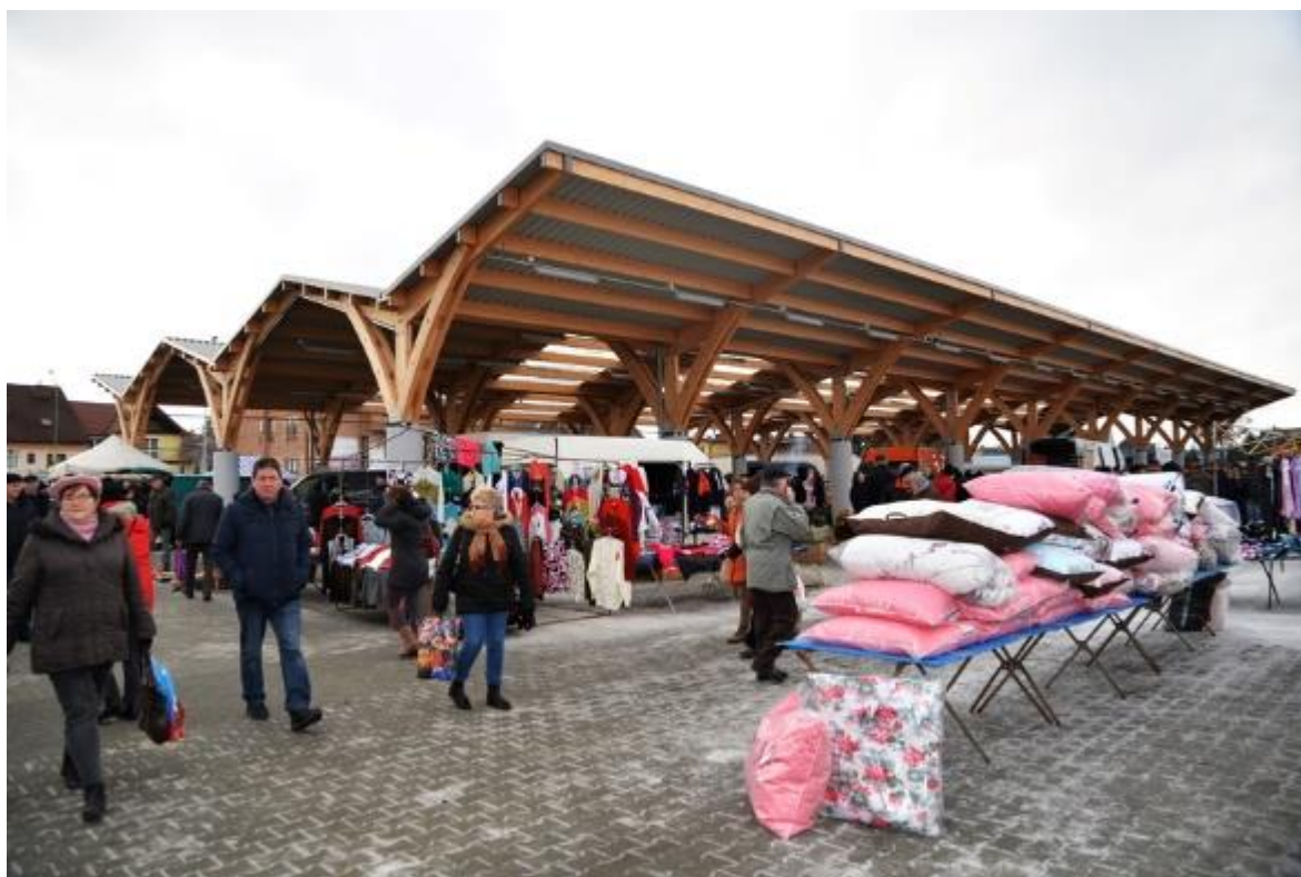
Ryc. 4. Plac targowy w Sędziszowie Małopolskim, Źródło: Plac targowy, 2019.

in this type of action, but it had an effect only in 5.8% of cases (32 people). Despite such low effectiveness, inhabitants of small towns show great interest in open consultations, e.g. during thematic and occasional picnics, information and thematic meetings as part of cultural events. The vast majority would like to have an influence on changes in public spaces in their city, while at the same time they believe that open public consultations could positively influence the results of the transformation and the overall satisfaction of the inhabitants with public spaces. According to those surveyed, the local community should have an influence on the process of shaping public spaces (through NGOs, local leaders, councillors, or institutions dealing with urban development and building infrastructure), but both public opinion and the comments of experts or designers should be taken into account.