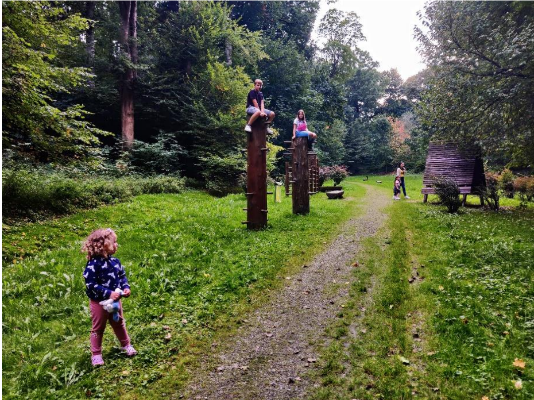
Ryc. 3. Fragment Parku „Buczyna” w Górze Ropczyckiej obok Sędziszowa Młp. Fig. 3. A fragment of "Buczyna" Park in Góra Ropczycka near Sędziszów Młp

The transformations of public spaces are mostly assessed as a change "for the better" or "partly for the better, partly for the worse". Respondents are satisfied with the new paving, lighting and equipment, but complain about the concrete surface of the squares, the lack of trees (natural shade) and greenery in general. A significant problem is also the small number of places to sit and spend time. There is a lack of meeting places that are easy to access, clean, well-maintained and rich in cultural and gastronomic offer. This fact was particularly highlighted by younger respondents. Moreover, the most highly rated spaces that have undergone transformation are the bazaars in Sokołów Młp. and Sędziszów Młp.(Fig.4). These are places where, while buying healthy food, the locals interact by talking to each other and spending some free time together. This underlines how important community integration is for the inhabitants of small towns.