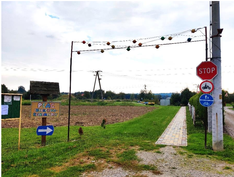
Ryc. 1. Wejście na Plac edukacyjno-rekreacyjny na osiedlu Witkowice w Ropczycach; Źródło: Fot. Autora

All these examples originate from large European cities. However, it is not an obstacle to use public participation in smaller towns, especially if it concerns less invasive solutions. One of the ideas that came to fruition in the studied area is the creation of an educational and recreational square in the Witkowice housing estate in Ropczyce (Fig.1). It was created on the initiative of a resident who noticed the potential of the area and used it for the needs of the local community. He also tried to negotiate with the municipality for additional funding to retrofit the site for children and young people. The site now has a field gym, seating areas and road signs and boards to educate young people about road traffic. There is also a hill, which in winter turns into a natural slide for children. The square is very popular, especially in winter. It is therefore worth engaging in dialogue between the authorities and residents in order to ensure that the local community has the right conditions to function in the city.