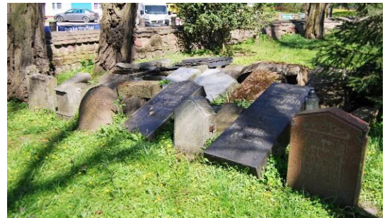
Fig. 4. The old churchyard at Szeroka Street.

Ryc. 3. Dawny cmentarz przykościelny wsi Świerczewo (3), ul. Świerzczewska. Powierzchnia - ha.