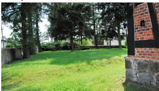
Fig. 14. The old churchyard at Klonowa Street.

Ryc. 13. Dawny cmentarz przykościelny wsi Śmierdnica (13), ul. Nauczycielska. Powierzchnia 0,3 ha.