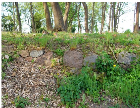
Fig. 17. Old cemetery wall of the churchyard in the village of Klucz (10), Bielańska Street.

Ryc. 16. Stary mur cmentarny cmentarza przykościelnego wsi Osów (5), ul. Miodowa.