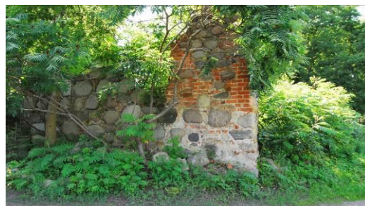
Fig. 13. The old churchyard at Nauczycielska Street.

Ryc. 12. Dawny cmentarz przykościelny wsi Kłęskowo (12), ul. Kolorowych Domów. Pow. 0,51 ha.