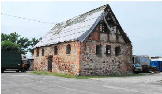
Fig. 3. The old churchyard at Świerzczewska Street.

Ryc. 2. Dawny cmentarz przykościelny wsi Gumieńce (2), ul. Lwowska. Powierzchnia 0,2 ha.