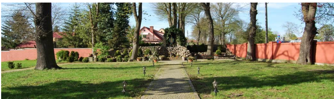
Fig. 11. The old churchyard at Nikłowa Street.

Ryc. 10. Dawny cmentarz przykościelny wsi Klucz (10), ul. Bielańska. Powierzchnia 0,4 ha.