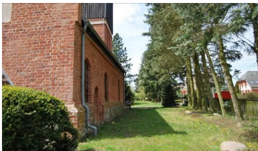
Fig. 9. The old churchyard at Inwalidzka Street.

Ryc. 9. Dawny cmentarz przykościelny wsi Skolwin (9), ul. Inwalidzka. Powierzchnia 0,5 ha.