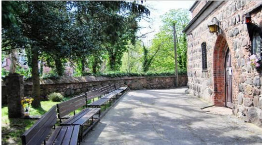
Fig. 1. The old churchyard at Włościańska Street.

Ryc. 1. Dawny cmentarz przykościelny wsi Pomorzany (1), ul. Włościańska. Powierzchnia 0,2 ha.