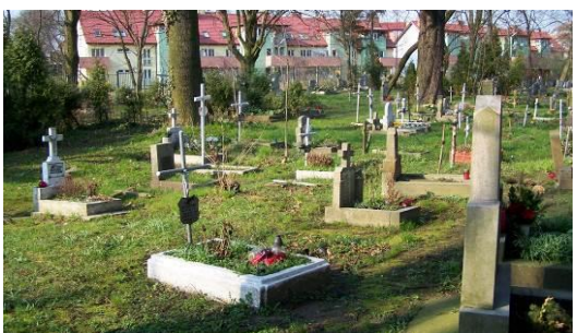
Fig. 7. The old churchyard at Strzałowska Street.

Ryc. 6. Dawny cmentarz przykościelny wsi Warszewo (6), ul. Szczecińska. Powierzchnia 0,25 ha.