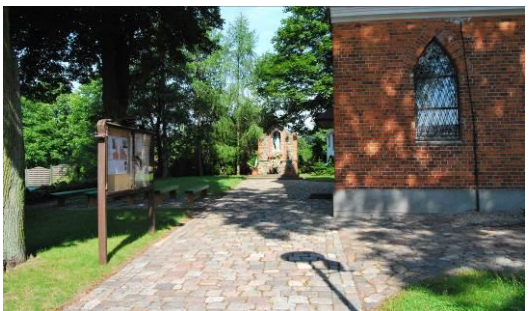
Fig. 5. The old churchyard at Miodowa Street.

Ryc. 4. Dawny cmentarz przykościelny wsi Krzekowo (4), ul. Szeroka. Powierzchnia 0,13 ha.