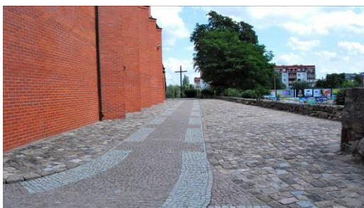
Fig. 12. The old churchyard at Kolorowych Domów Street.

Ryc. 11. Dawny cmentarz przykościelny wsi Podjuchy, ul. Nikłowa (11). Powierzchnia 0,13 ha.