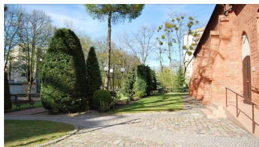
Fig. 15. The old churchyard at Młodzieży Polskiej Street.

Ryc. 14. Dawny cmentarz przykościelny wsi Płonia (14), ul. Klonowa. Powierzchnia 0,31 ha.