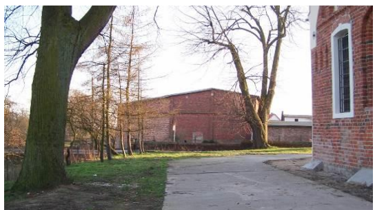
Fig. 8. The old churchyard at Kościelna Street.

Ryc. 7. Dawny cmentarz przykościelny wsi Gołęczyno (7), ul. Strzałowska. Powierzchnia 2,8 ha.