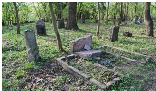
Fig. 10. The old churchyard at Bielańska Street.

Ryc. 9. Dawny cmentarz przykościelny wsi Skolwin (9), ul. Inwalidzka. Powierzchnia 0,5 ha.