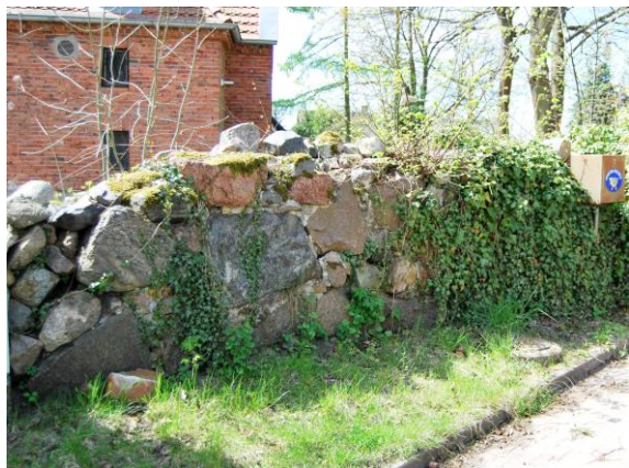
Fig. 16. Old cemetery wall of the churchyard in the village of Osów (5), Miodowa Street.

of a monument conservator, they are collected from the entire area into one place, creating small lapidaries. However, the decision on what to do with them should always be individually made by monument conservation authorities, whether it is better for the preservation of these objects to gather them in a lapidarium on the cemetery's premises, transfer them to another safer location, or leave them in situ as elements inseparably connected with the graves on which they were placed.