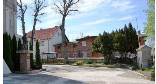
Fig. 2. The old churchyard at Lwowska Street.

Ryc. 1. Dawny cmentarz przykościelny wsi Pomorzany (1), ul. Włościańska. Powierzchnia 0,2 ha.