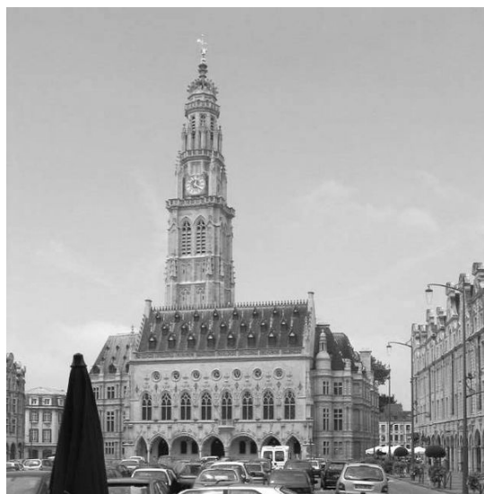
Ryc. 10. Ratusz w Arras.

zynowe lub skład broni. Piętro mieściło reprezentacyjną salę wraz z przylegającymi pokojami administracyjnymi 17 (np. ratusz w Arras – ryc. 10).