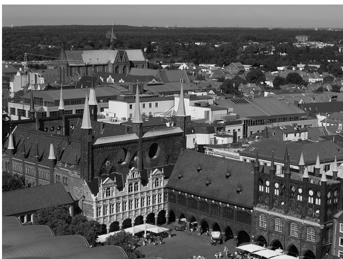
Ryc. 6. Ratusz w Lubece.

Oprócz jednoprzestrzennej Sali Rady na piętrze, mniejszych pomieszczeń w parterze i na pozostałych kondygnacjach, niektóre ratusze posiadały kaplicę (Palazzo Vecchio we Florencji).