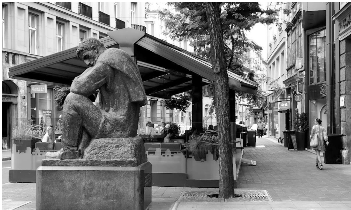
Fig. 4. Constructions without permit in the city streets, Zagreb 2021. Ryc. 4. Obiekty bez pozwolenia na ulicach Zagrzebia, 2021 r.

ture. This particular problem is not exclusively Croatian, namely, it concerns many post-socialist countries, as evidence of disregard for urban planning and planners can also be found in for example Poland, as professional architectural or planning education is not required for assuming the "responsibility both on the scale of the entire city, as well as regarding individual regions of the city, including metropolitan downtowns." (Chudzinska, Guranowska-Gruszecka 2020). The projects are often realized with complete disregard for urban maps and guidelines, as there is no cooperation between different local offices required, and the permits are issued by the branch of the city government. Furthermore, although the permits are issued for temporary objects, these objects remain in space for the whole year, during winter times they are covered with transparent plastic tents and equipped with gas heaters, having therefore even stronger and more defined physical presence and appearance.