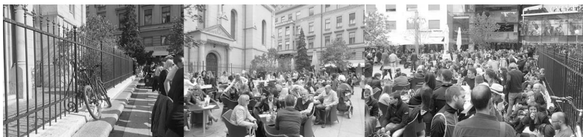
Fig. 3. Citizen protest to regain back the city square and the bench on the Zagreb Flower Square. Ryc. 3. Protest obywateli na rzecz odzyskania placu miejskiego i ławki na Placu Kwiatowym w Zagrzebiu.

sold it to the private investor, allowing the construction of this garage in the close vicinity of the pedestrian zone. The slogan “We will not give Warsaw!” (In Croatian – Ne damo Varsavsku!) has surpassed its original significance and from the initial struggle against the construction became a symbol of the struggle against the usurpation of public space. Paradoxically, Warsaw Street was flooded with terraces in the years that followed (Fig. 2.). Another significant example of the fight against the privatization of the public sphere is the “Flower Square” case (in Croatian Cvjetni trg), which began in 2007. Petar Preradovic Square, as the official name of the square reads, which is better known as Flower Square due to numerous flower stands, has undergone a number of spatial transformations in the last hundred years, but only the latter resulted in a series of protests (Fig. 3.). The reason was the decision of the city authorities to allow construction of a commercial-business-residential complex with a garage in the area of the square.