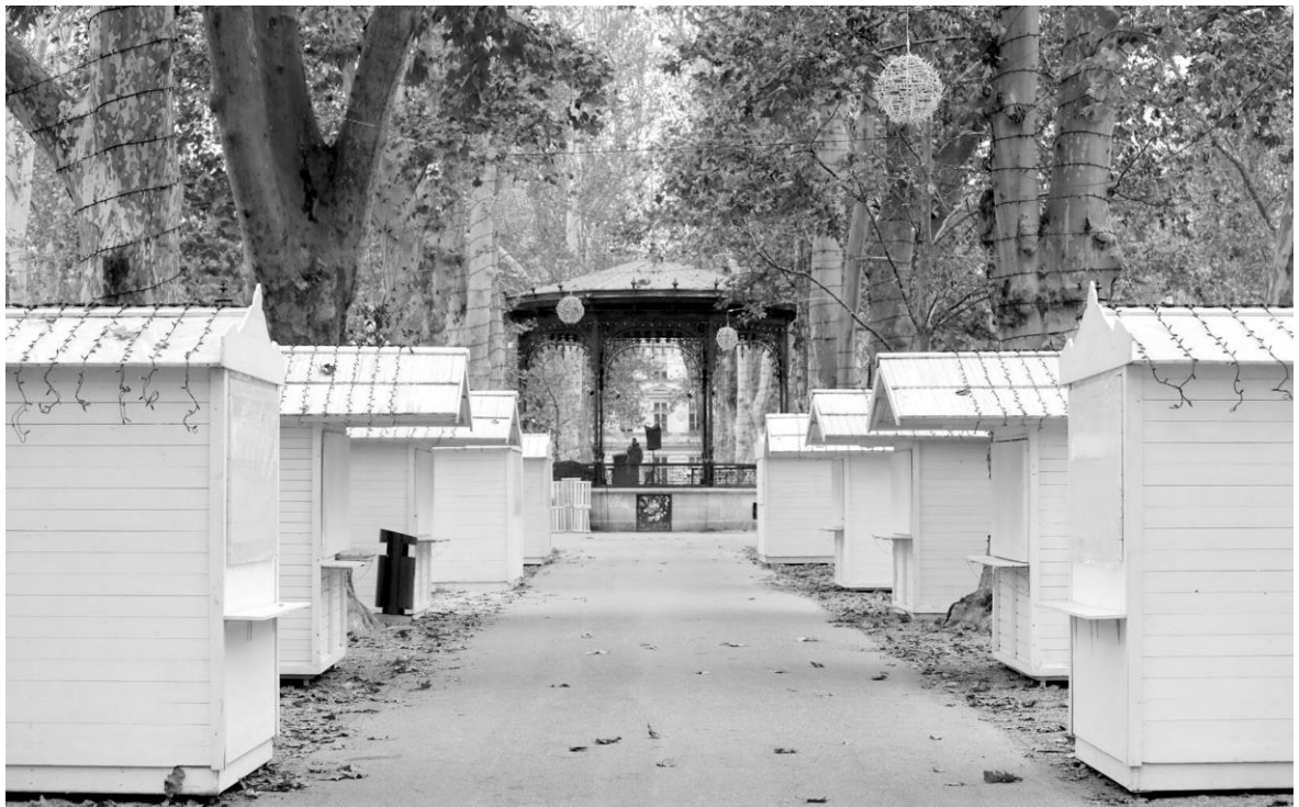
Fig. 5. Privatisation of the green spaces in Zagreb on the Green Horseshoe during festivities. Ryc. 5. Prywatyzacja terenów zielonych w Zagrzebiu przy Zielonej Podkowie podczas festynów.