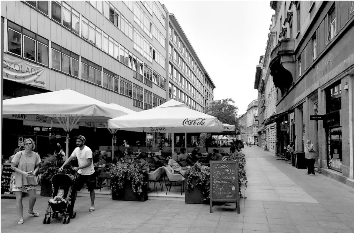
Fig. 2. The usurpation of public space in Zagreb: Varsavska Street flooded with terraces.

city), which deals with urban problems occurring in the city. In 2012, during the public tribune about public spaces of the city Simpraga, one of the speakers, amongst Ana Kutlesa and Sonja Lebos, spoke about how in the transitional changes and the savage neoliberal system, the urbanity of public space was destroyed, primarily due to various manifestations of power that occurred in public spaces in the process of their expropriation and complete privatization.