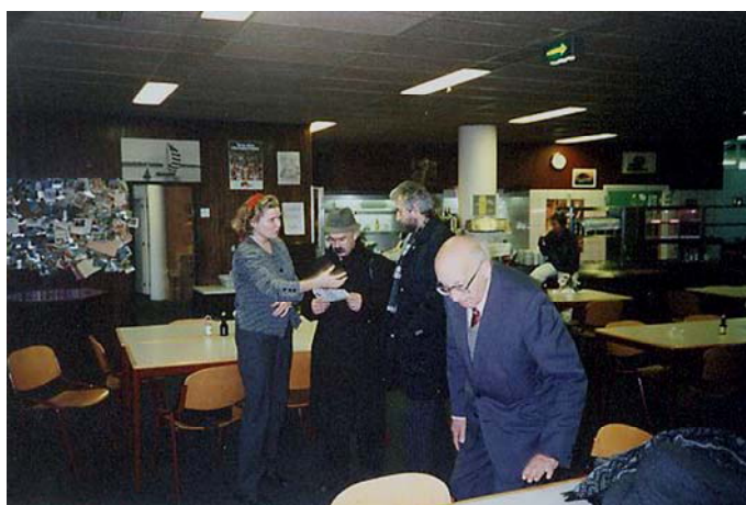
Ryc. 4. Bouwcentrum w Rotterdamie.