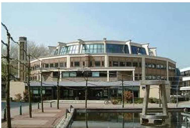
Ryc. 1. Bouwcentrum w Rotterdamie.