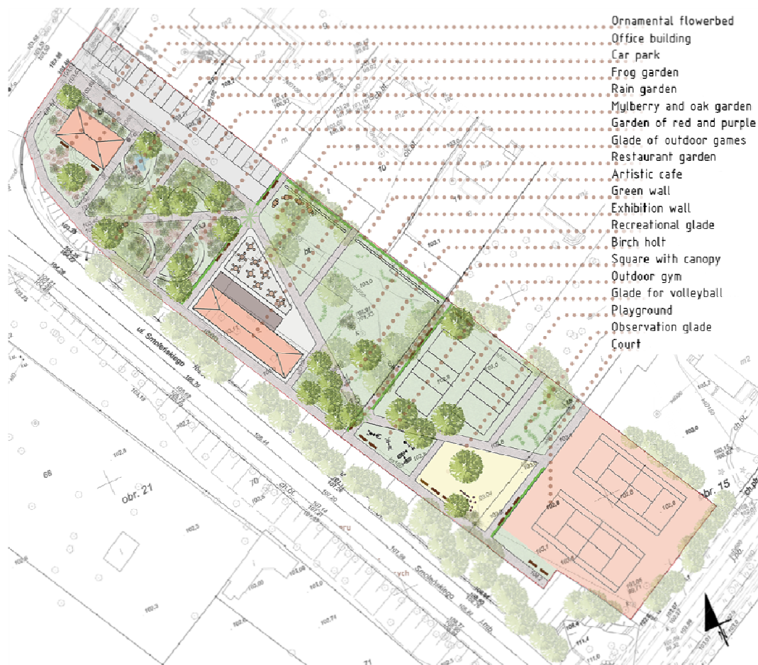
Fig. 3 Project of the park. Author of the drawing: J. Kosno Ryc. 3 Koncepcja zagospodarowania parku. Autor rysunku: J. Kosno