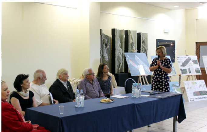
Fig. 2 Meeting with inhabitants of Milanówek

plans, changed their postulates and defined their own vision of each functional fragment of the square (fig.2).