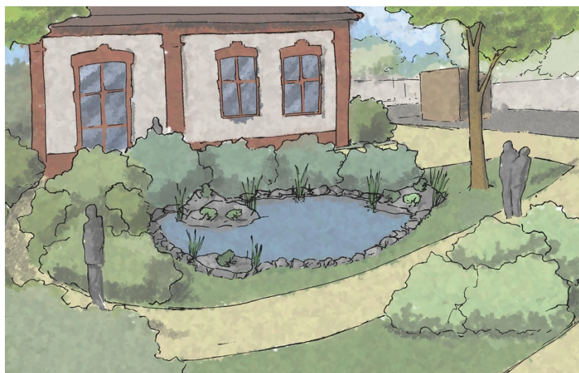
Fig. 4 Visualization: Frog garden. Author of the drawing: J. Krupa Ryc. 4 Wizualizacja: Żabi ogród. Autor rysunku: J. Krupa

At the second, final meeting with the inhabitants in office of Milanówek City, a presentation of the work took place. Each team, which was participating in the competition, briefly