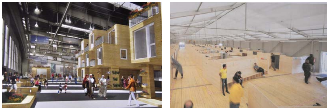
Fig. 10. „Heimat in der Fremde” (ger. “Homeland in the Strange”) the competition for the shelter of refugees in Germany. One of the priced projects proposed a living estate in the post-industrial hall, the other one the boxes for refugees under the huge tent construction.

Ryc. 10. „Heimat in der Fremde” (niem. „Ojczyzna w obcym kraju”) konkurs na schronienie dla uchodźców w Niemczech. Jeden z nagrodzonych projektów zakładał budowę osiedla mieszkaniowego w hali pofabrycznej, inny boksy dla uchodźców w wielkim namiocie.