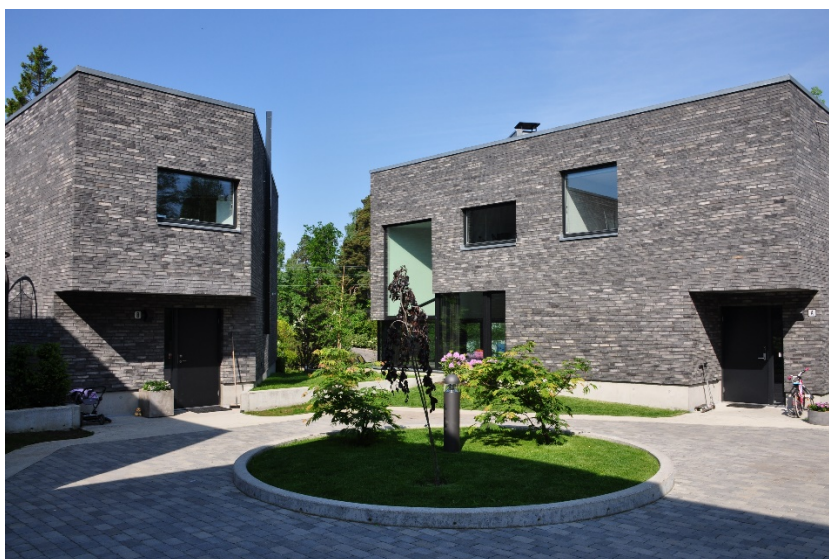
Fig. 3 Socializing arrangement of the housing group around the common semi-public space with the common underground garage in Oslo (Norway).

Ryc. 2. Elementy topograficzne w zespole mieszkaniowym i wielofunkcyjnym w Kopenhadze.