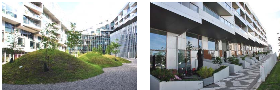
Fig. 2 Topographic architecture in the living estate of multifunctional use in Copenhagen (Denmark).

librium". Among the visited settlements were: references to the natural topography of the area, natural greenery with flowers and herbs, location of residential complexes directly at the edge of water bodies, creation of green spaces between residential development and the release of housing areas from the presence of cars thanks to underground garages, urban interiors within housing estates equipped with works of art. The lack of fences, gates, and defenses created a sense of openness and friendliness - both of one another and of strangers. The use of natural materials in architecture and the shaping of architectural forms in reference to the natural features of the surrounding nature - is the standard of Scandinavian residential architecture. It is evident in this architecture the search for an ideal habitat in particular in the area of references to the basic, endogenous characteristics and preferences of man. Habitat is a way of living a man, understood both in a spatial and social context. The evolution of forms of inhabitation is one of the basic forms of cultural and civilization development. Flat as a form of culture, it is one of its important factors, binding social issues with the development of architectural forms, construction techniques and the organization of living space.