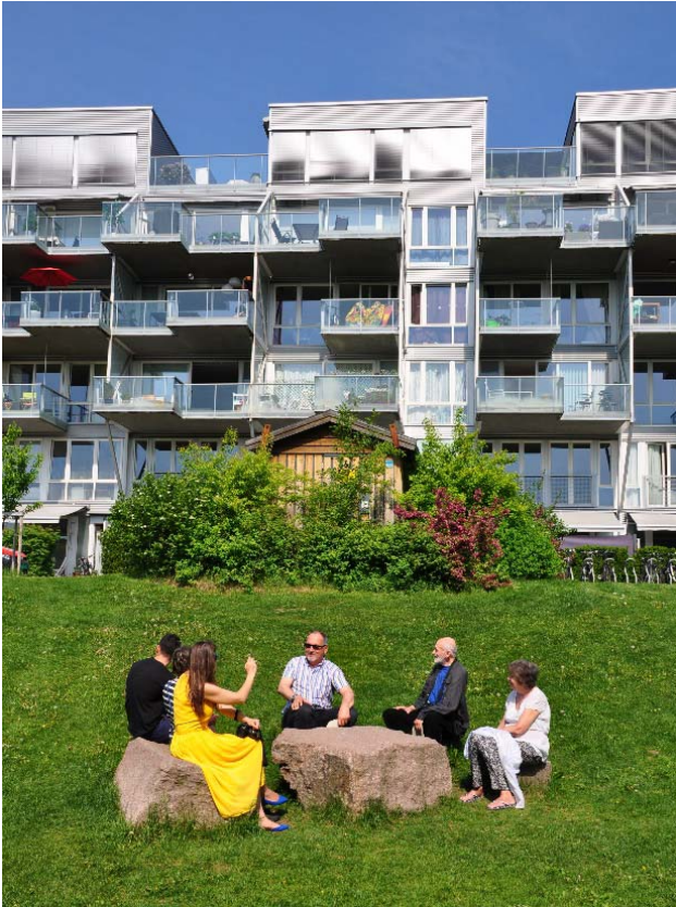
Fig. 4 Open landscape elements in the internal space of the living estate in Oslo (Norway).

Ryc. 4. Elementy otwartego krajobrazu we wnętrzu osiedlowym w Oslo (Norwegia).