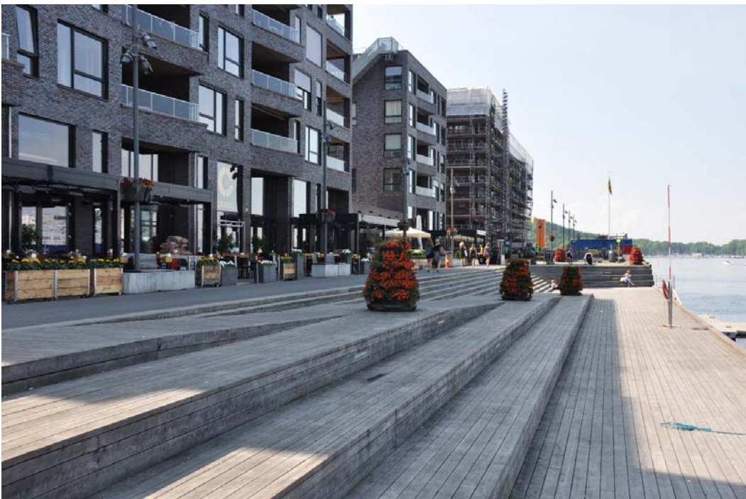
Fig. 5. Social integration due to combination of living spaces with the landscape elements (waterfront) in Oslo (Norway).

Ryc. 4. Elementy otwartego krajobrazu we wnętrzu osiedlowym w Oslo (Norwegia).