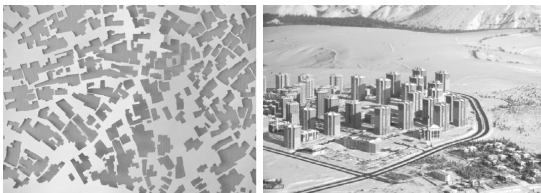
Fig. 11A. A scheme of the informal settlement “gecekondu” in the heart of Ankara (Turkey). Source: authors photo

Ryc. 10. „Heimat in der Fremde” (niem. „Ojczyzna w obcym kraju”) konkurs na schronienie dla uchodźców w Niemczech. Jeden z nagrodzonych projektów zakładał budowę osiedla mieszkaniowego w hali pofabrycznej, inny boksy dla uchodźców w wielkim namiocie. Źródło: Fot. autora na wystawie projektów w hali dawnego lotniska Tempelhof w Berlinie