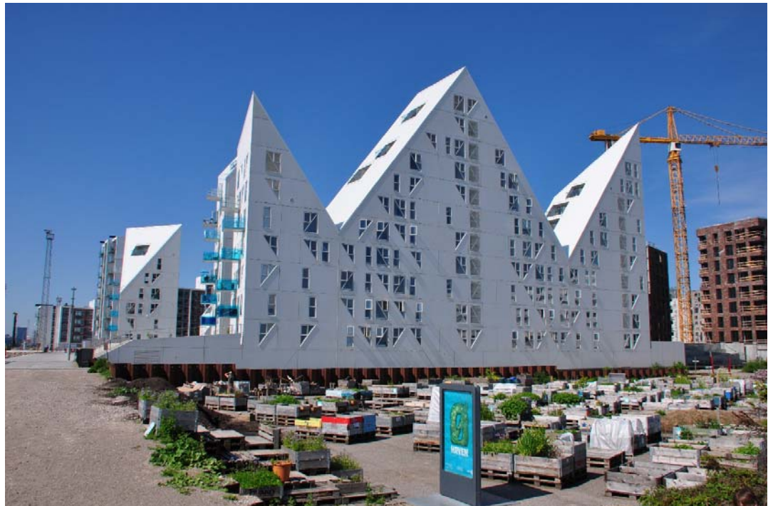
Fig. 7. Market of plants and herbs as an element of the new living estate in Arhus (Danmark).

Ryc. 6. Otwarty ogród wewnątrz nowego kwartału zespołu mieszkaniowego w obszarze nadwodnym w Oslo (Norwegia).