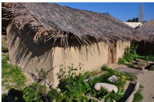
Fig. 1A Reconstruction of the primitive house from the Neolit period with a front garden - the Archeological-Museum Yesilova in Izmir, Turkey.

Ryc. 1A. Rekonstrukcja domu mieszkalnego z epoki neolitycznej z przedogródkiem - Muzeum Archeologiczne Yesilova w Izmirze, Turcja.