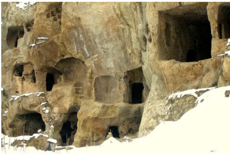
Fig. 8. Housing carved in the rocks of Capadocia, Turkey. The form of habitat giving impression of security.

The essence of the "habitat" concept is the cohabitation of a specific territory by 3-150 families, forming a group of up to 500 people in a structured way, enabling at least basic aspects of life, relating to security, the possibility of feeding and raising children, the development of culture. These habitat features tend to consider anthropological issues in terms of the primitive characteristics of the coexistence of tribal or national groups, in terms of their habitat and group organization. Of particular importance in general analysis is the consideration of external factors that influence behavior and creation of interpersonal relationships. These factors include the climatic conditions, the natural environment, the environment which allows one to live on one hand, and the other to create specific threats to be faced. The surroundings are a standard of Scandinavian residential architecture. It is evident in the architecture of the search for an ideal habitat in particular in the area of references to the basic, endogenous characteristics and preferences of man.