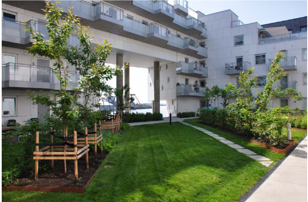
Fig. 6. The open garden i the interior of the new housing block within the waterfront area in Oslo (Norway).

Ryc. 6. Otwarty ogród wewnątrz nowego kwartału zespołu mieszkaniowego w obszarze nadwodnym w Oslo (Norwegia).