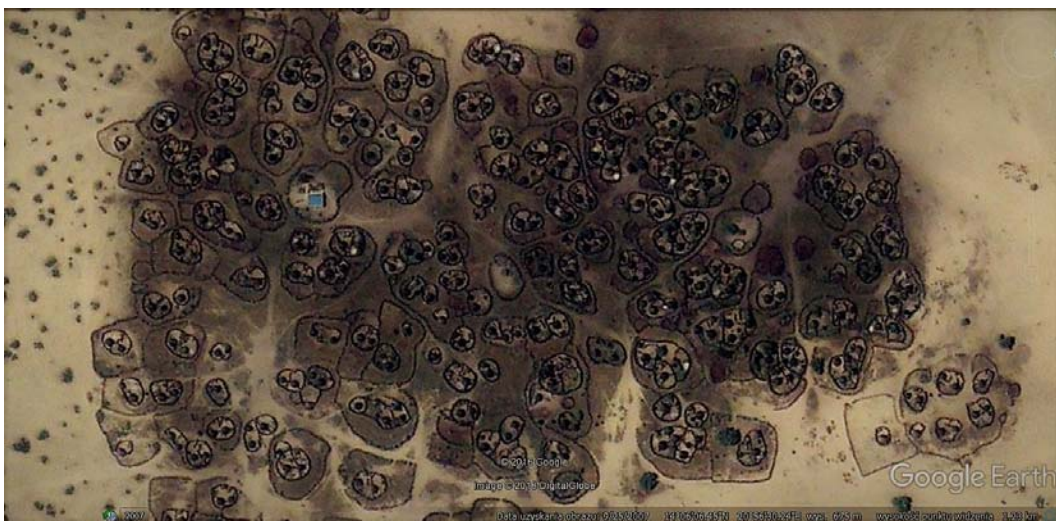
Fig. 9. A satellite photo (Google Earth, 2007) of the village in the central deserted area of Chad having a structural organization mirroring its social structure.

Ryc. 8. Groty mieszkalne wydrążone w skałach Kapa-docji, Turcja. Forma zamieszkiwania dająca poczucie bezpieczeństwa.