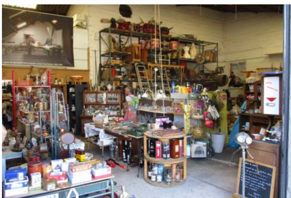
Fig. 2. Fashion for the "Past": a shop with antiques, in la Gacilly, a small Breton town, 5000 inhabitants (genuine articles).

Mass tourism is now enabled by the whole set of globalization factors. It is the ease and cheapness of moving around the world thanks to the development of a fleet of huge tourist vessels sailing all over the seas and oceans of the world (COSTA, MSC and others). These ships take on board several thousand tourists, with a diverse sociological typology, supported by a multitude of workers (sometimes reaching two thousand and representing many nationalities). In the visited ports, passengers mainly travel by bus on prepared routes and every day, waking up in the same cabin, they are already in another, big port. Every evening, the properly prepared lectures expand their knowledge and prepare them for sightseeing.