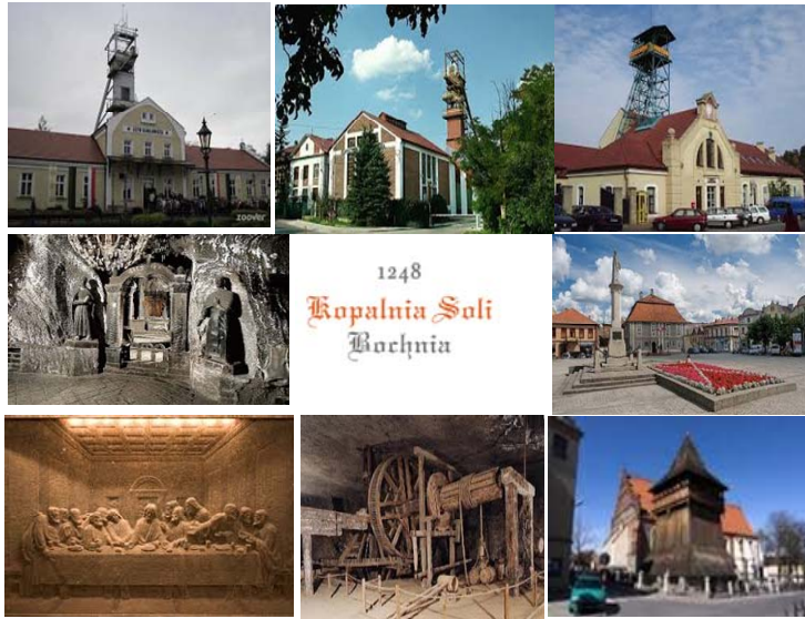
Fig. 6. Bochnia; a unique tourist offer supports the success of small towns. Photo. [8]

information and the simultaneous distribution of information folders for the entire region. From this demand for high quality of the whole environment transpires the necessity of revitalization on a supra-local scale, its openness to new projects and improvements.