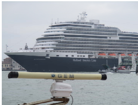
Fig. 4. Mass tourism generally caters to the needs of other tourists than those who visit the cities of the Cittaslow Network and their surroundings. In the background, there is a snippet of the Venice landscape. Photo by author, 2017

"Free time" is a period often intended in European countries for a one-week trip, sometimes a few days longer. With the current trend to divide holidays into short periods, but frequent during the year, often great historic cities are the destination of the trip. This, of course, favours the development of mass urban tourism in Europe. Modern and rich cities on other continents also win on facilitating accessibility.