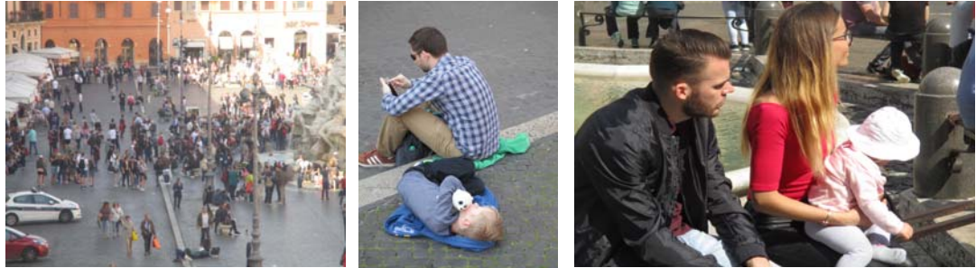
Fig. 3. Rome Piazza Navona, Even children are sometimes victims of mass tourism, april 2017. Ryc. 3. Nawet dzieci są niekiedy ofiarą turystyki masowej, Rzym, Piazza Navona, kwiecień 2017.

"Free time" is a period often intended in European countries for a one-week trip, sometimes a few days longer. With the current trend to divide holidays into short periods, but frequent during the year, often great historic cities are the destination of the trip. This, of course, favours the development of mass urban tourism in Europe. Modern and rich cities on other continents also win on facilitating accessibility.