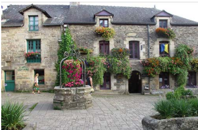
Fig. 5. Rochefort en Terre, has belonged to the Breton network of "Small towns with character" for 30 years Photo by the author, 2017

For those who have not forgotten about the traditional forms of tourism associated with physical effort, adventure and surprise, small towns with a historic past need to show both inventiveness and consistency in action. Let us not forget, however, that even this still virtual clientele is also looking for comfort and modern equipment for the realisation of their specific interests. It is for those crowds of native and foreign tourists that is possible and worthwhile to create a specific offer, let us call it "niche" or "thematic".