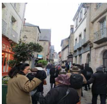
Fig. 7, Vitré, a city in Brittany (XV - XVI century) Electric and telephone cables and TV antennas have disappeared from the city landscape (from the visit of Polish cities of "model revitalization", November 2017).

Ryc. 7. Vitré, miasteczko w Bretanii (XV - XVI wiek). Kable elektryczne, telefoniczne i anteny telewizyjne zniknęły z krajobrazu miasta (wizyta polskich miast "modelowej rewitalizacji", listopad 2017).