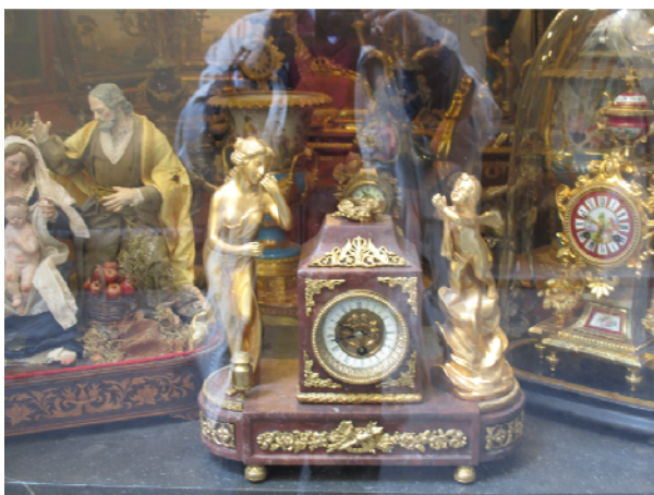
Fig. 1. Fashion for the "Past": a shop with antiques (made in China) in Rome.

various fashion manifestations on the widely understood "Past". The economic dimension of this concept generates, according to the authors, a vast new product market, where the tourist is a consumer (travel expenses), but often also a bidder - an intermediary and sometimes even a speculator on the market of antiques, collections, art, crafts, trading in old handicrafts, furniture, ceramics, glass or metal products.