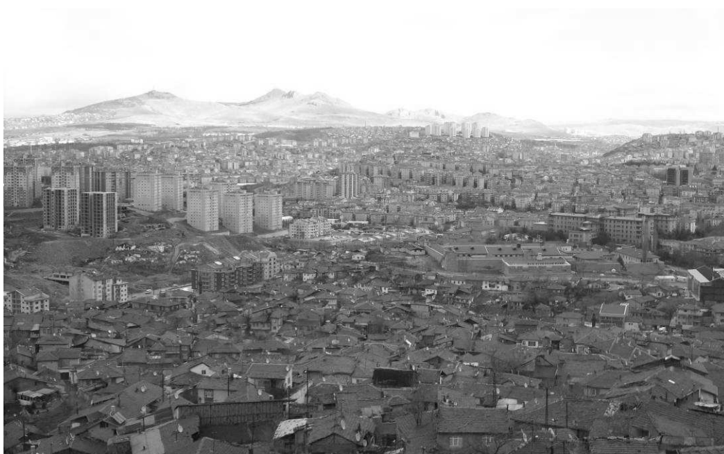
Ryc. 1. Część dzielnicy slumsów zwanych „gecekondu” w Ankarze . Źródło: fot. J. Arlet Fig. 1. A part of the slum area named “gecekondu” in Ankara, Source: photo J. Arlet

W kolejnej już edycji warsztatów postawiono przed nami zadanie opracowania projektu urbanistycznego zagospodarowania fragmentu dzielnicy Aktas, położonej w centralnej części Ankary. To specyficzny problem, żywiłowo rozwijającego się miasta. Masowo przybywający do stolicy ludzie, poszukujący lepszych warunków życia, a przede wszystkim pracy, zamieszkują „na dziko” olbrzymie przestrzenie w mieście. Te dzielnice slumsów nazywane są „gecekondu”. Proces ten próbują opanować władze miasta i kraju, ale wobec jego skali jest to niezwykle trudne. Kolejne dzielnice slumsów są burzone, a na ich miejscu powstają niemal identyczne wieżowce, zaprojektowane w sposób nie liczący się z potrzebami przesiedlanych tam mieszkańców „gecekondu”, ani z bardzo zróżnicowanym ukształtowaniem terenu. Ludzie, którzy przybyli tu wcześniej z małych miast lub wsi, z trudnością adaptują się do nowych warunków.