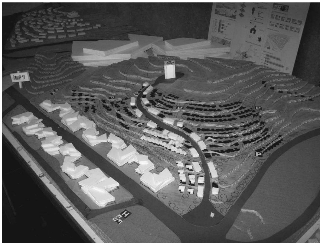
Ryc. 6. Makieta projektu grupy 11, w skali 1:1000. Fig. 6. Model in the scale of 1:1000.