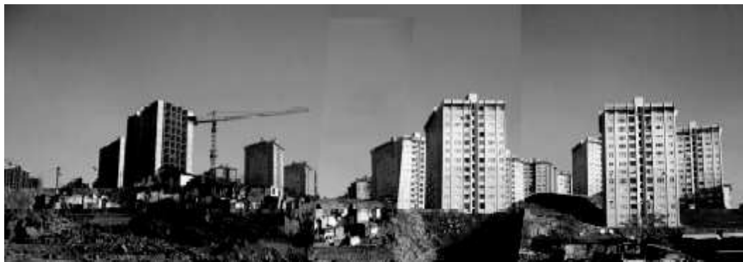
Ryc. 4. Nowe wieżowce w dzielnicy Aktas, zwane Toki Towers. Fig. 4. The new Toki Towers in Aktas district.

Moją uwagę zwróciła duża wrażliwość społeczna studentów i troska o poprawę standardów życia mieszkańców dzielnicy. Priorytetem okazał się lepszy dostęp do edukacji, następnie opieki medycznej i rekreacji. Studenci zastanawiali się, jak zaktywizować dzielnicę i jak zapewnić mieszkańcom nowe miejsca pracy. Jednocześnie zauważyli, że podstawowymi wartościami społecznymi w analizowanych dzielnicach slumsów są zarówno silne więzi rodzinne, jak i sąsiedzkie. Kolejne elementy, które koniecznie chcieli zachować, to organiczny kształt budynków, ich różnorodność, zróżnicowany kształt dachów i kolory elewacji. Wyraźnie akcentowali konieczność podziału na prywatną i publiczną przestrzeń.