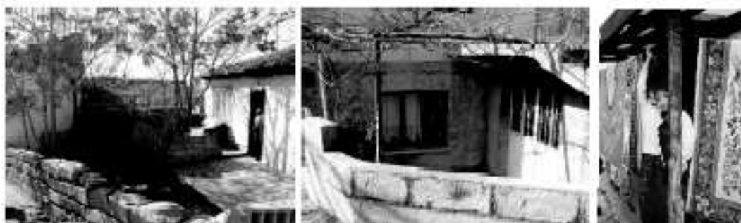
Ryc. 3. Cenne elementy warte ochrony: relacje dobrosąsiedzkie, skala człowieka. Fig. 3. Important values worth protecting: neighbourly relationships human scale.

Po inwentaryzacji fotograficznej i wstępnych szkicach przyszedł czas na prace koncepcyjne. Została wykonana makieta terenu w skali 1:1000 oraz makiety wybranych typów zabudowy. Zaskoczyła nas niezwykła w tym biegłość studentów z Turcji. Projektowanie za pomocą makiet okazało się bardzo twórcze. Równocześnie pracowano nad przygotowaniem prezentacji końcowej. Wszystkie etapy były żywo komentowane, a rozwiązania przegłosowywano.