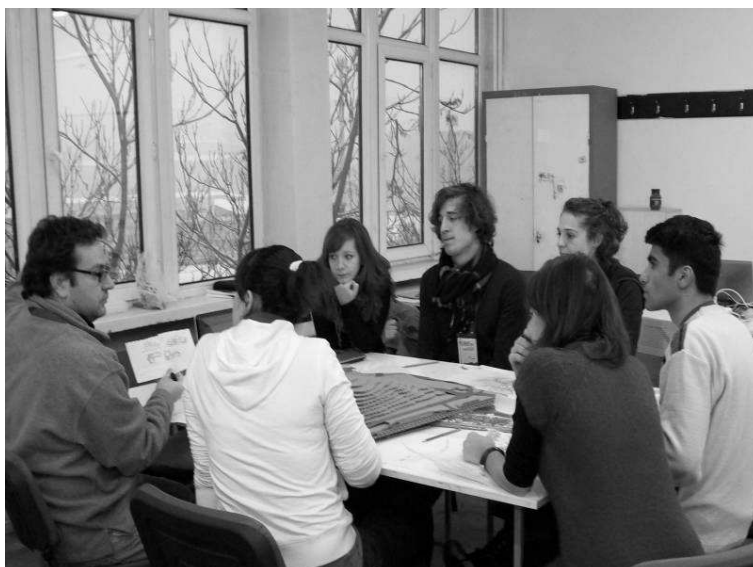
Ryc. 2. Zespół 11.

Chciałabym przedstawić spostrzeżenia i przyjęte przez moją grupę metody pracy. Wszystkie kolejne kroki były dyskutowane i uzgadniane w zespole. Pierwszym problemem, który musiałam rozpoznać to możliwości i predyspozycje poszczególnych studentów. Okazało się, że byli w naszym zespole studenci drugiego, trzeciego roku a także roku dyplomowego z Argentyny, Austrii, Niemiec i Turcji. Mieliśmy w naszej grupie studentów architektury ale również planowania urbanistycznego. W ciągu kilku dni trzeba było znaleźć ich najmocniejsze strony. Już pierwszego dnia, na gorąco, poprosiłam wszystkich studentów o narysowanie wstępnych, szkicowych propozycji. Były one podstawą dyskusji o przyszłym projekcie. Okazały się interesujące. W każdej propozycji staraliśmy znaleźć inspirację do dalszych etapów. Ważne dla mnie było to, by każdy ze studentów mógł się utożsamić z końcowym projektem.