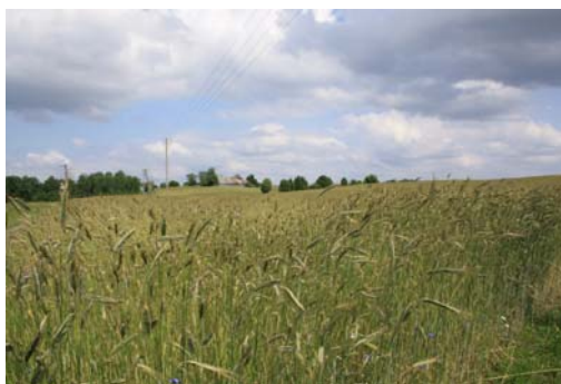
Ryc. 5. Widok na oziminę na polu uprawnym w Miesiączkowie koło Brodnicy, VI 2009

Fig.4. Meadow in organic farm in Pokrzydowo village near Brodnica, VI 2009