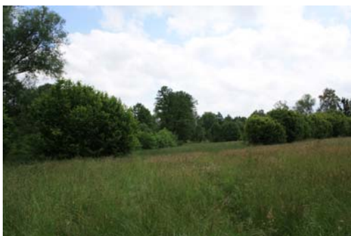
Ryc. 4. Łąka na gospodarstwie ekologicznym w Pokrzydowie koło Brodnicy, VI 2009, Autor: Konrad Majtka

Fig.4. Meadow in organic farm in Pokrzydowo village near Brodnica, VI 2009, Author: Konrad Majtka