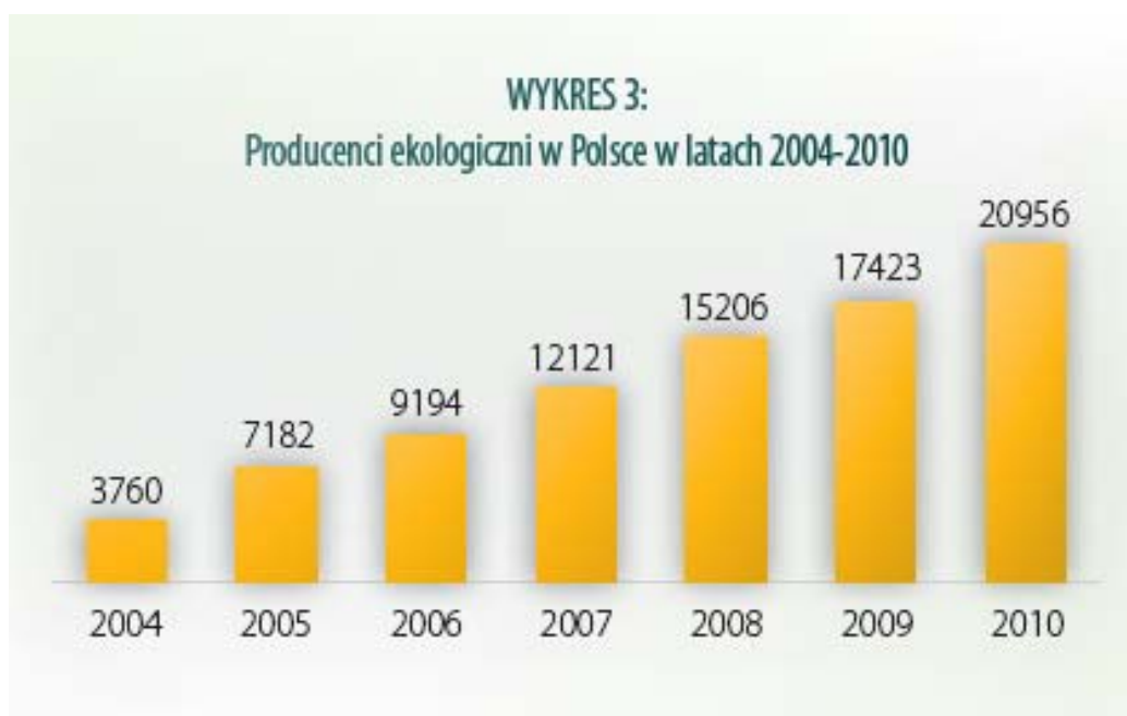
Ryc. 1. Dynamika wzrostu producentów ekologicznych w poszczególnych latach.

Rolnictwo ekologiczne zdobywa coraz większe uznanie wśród producentów żywności i rolników [Kuś i in.2004,2006]. Minione lata cechują się stałą dynamiką zarówno w zakresie ilości gospodarstw ekologicznych, wzrostem upraw przeznaczonych pod powierzchnię zasiewów, jak i zainteresowaniem ze strony przetwórców. Dane przedstawione w najnowszym opracowaniu raportu [GIJHARS,2011], wskazują na ponad 20 % wzrost ilości gospodarstw ekologicznych w roku 2010, w stosunku do roku 2009 w skali całego kraju.