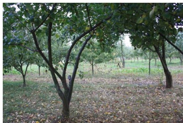
Ryc. 3. Sad ekologiczny w gospodarstwie Nr.1 w Pokrzydowie koło Brodnicy, X-2009 Autor: Konrad Majtka

Fig.3. Ecological orchard in organic farm in Pokrzydowo near Brodnica, X-2009 Author: Konrad Majtka