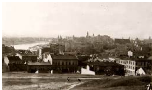
Ryc. 6 Widok na Wawel ze stoków Krzemionek – dawna widokówka. Fig.:6 View on Wawel Castle from the slopes of Krzemionki Hill – an old postcard.