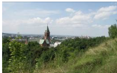
Ryc. 7 Widok na Wawel ze stoków Krzemionek (kościół Redemptorystów na pierwszym planie, Wawel w oddali po prawej stronie) stan na dzień 2011r.