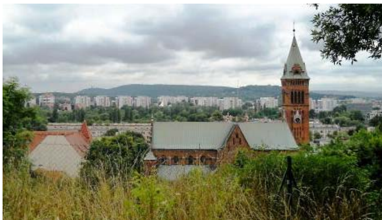
Fig.1 View of the monastery of the Redemptorists (first plan), The Podwawelskie housing development (second plan), Kościuszko Mound and monastery in Bielany (in the background).

Podsumowując, podczas definiowania kluczowych pojęć, określono: czym jest i co wchodzi w skład planu miejscowego, jak rozumieć zapisy odnoszące się do walorów architektonicznych i krajobrazowych , a w związku z występowaniem na obszarze wytworów cywilizacji oraz elementów przyrodniczych przywołano również zapisy odnoszące się do krajobrazu kulturowego oraz zasad jego ochrony .