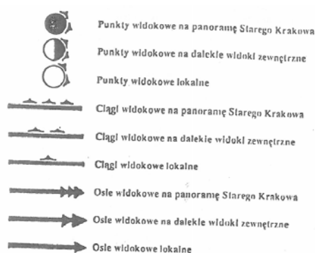
Ryc. 4 Fragment legendy odnoszący się do elementów kompozycji przestrzennej. Źródło/Source: BP UMK.

Fig. 4 Part of captions to General Spatial Plan, concerning the composition aspect of the plan's graphical part.