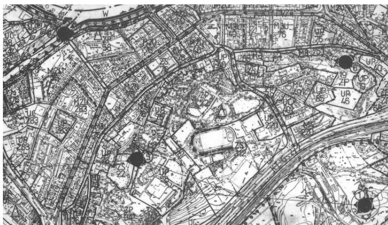
Ryc. 5 Fragment części graficznej Miejsowego Planu Ogólnego Zagospodarowania Przestrzennego Miasta Krakowa z wyszczególnionymi osiami, punktami i ciągami widokowymi.

W tym miejscu, kończąc rozważania odnoszące się do walorów architektoniczno krajo- brazowych przyznać należy za I. Syktą, że plan ogólny w sposób bardziej wyrazisty i skuteczny niż dotychczas wykonywane opracowania planistyczne w skali całego miasta – eksponował walory krajobrazowe i kompozycyjne w planowaniu, a także znaczenie krajobrazu miejskiego i zieleni jako tzw. Klinów kontr urbanizacji.