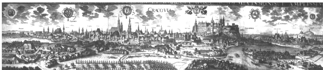
Ryc.2 Kraków od północnego zachodu, widok wykonany w 1619r. - po prawej widoczne wzgórza Krzemionek wraz z kościołem św. Benedykta.

Na samym Wzgórzu Krzemionek znajduje się niewielki Kościółek św. Benedykta, a niedaleko kościółka wznosi się baszta Maksymiliańska (tzw. fort św. Benedykta) z 2 poł. XIX w., pozostałość po austriackich fortyfikacjach, cenny zabytek architektury fortyfikacyjnej, przypuszczalnie zaprojektowany przez Feliksa Księgarskiego. W południowej części wzgórza ponad korony drzew wybija, uznana za dobro kultury współczesnej, wieża telewizyjna TVP Kraków 8 .