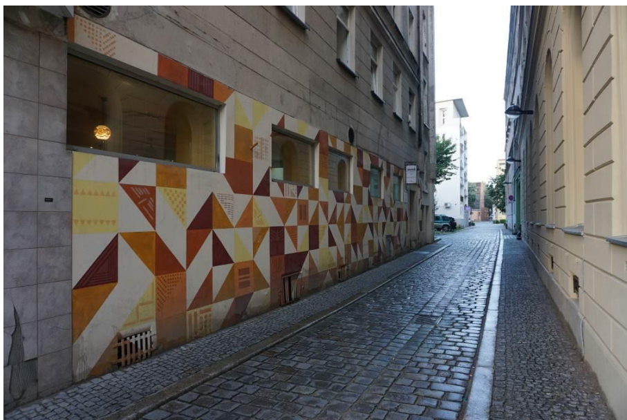
Fig. 3. Mural Trójkąty i kwadraty on the facade at Świdnicka Street 24-26 in Wrocław.

uczna realized in 2012 by the Contemporary Museum in Wrocław. The venture shows the artist's attempt to go beyond the universally accepted frames and formats, the positioning of art in public space and the involvement of others to co-create the work. In addition, as Andrzej Saj 7 rightly notes, this work is an example of painting in nature, a theme that remains close to the artist in every period of his work (Saj A. 2012).