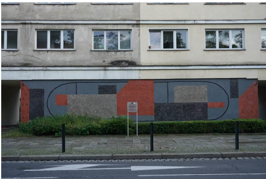
Fig. 2. Ceramic mosaic on the facade of the building at Podwale Street 45 in Wrocław by Józef Hałas.

Ryc. 1. Józef Hałas z rękami w kieszeniach, w ciemnych okularach nadzoruje układanie mozaiki przy ul. Podwale 45.