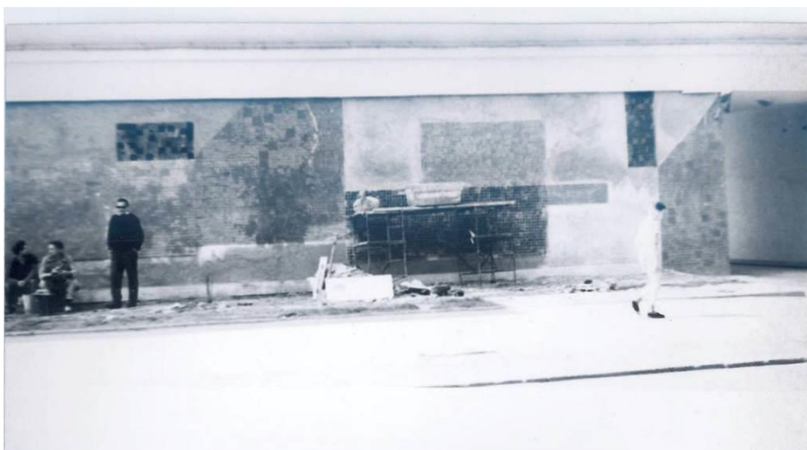
Fig. 1. Józef Hałas with his hands in his pockets, in dark glasses, oversees the mosaic laying at Podwale Street 45.

Ryc. 1. Józef Hałas z rękami w kieszeniach, w ciemnych okularach nadzoruje układanie mozaiki przy ul. Podwale 45.