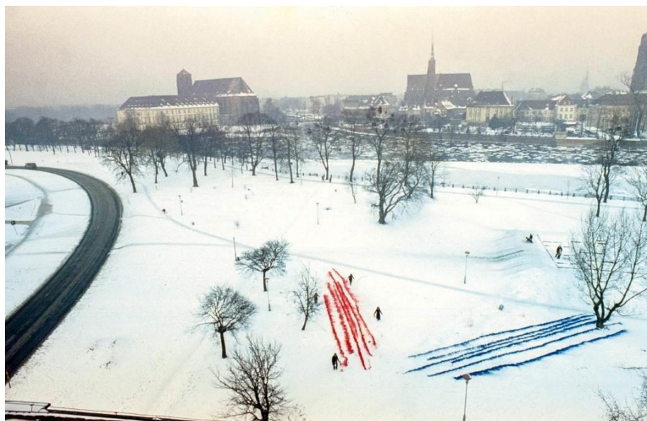
Fig. 4. Malarstwo na śniegu , Polski Square 3/4 in Wrocław.

Ryc. 3. Mural Trójkąty i kwadraty na elewacji przy ul. Świdnickiej 24-26 we Wrocławiu.