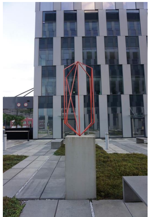
Fig. 6. IQ geometric sculpture between the twin buildings of Green Towers at Strzegomska Street in Wrocław.

Ryc. 6. Geometryczna rzeźba IQ pomiędzy bliźniaczymi budynkami Green Towers przy ul. Strzegomskiej we Wrocławiu.