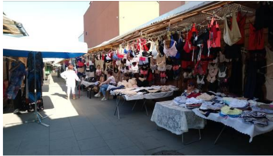
Fig. 2. Bazar Różyckiego Ryc. 2. Bazar Różyckiego, X 2018.]