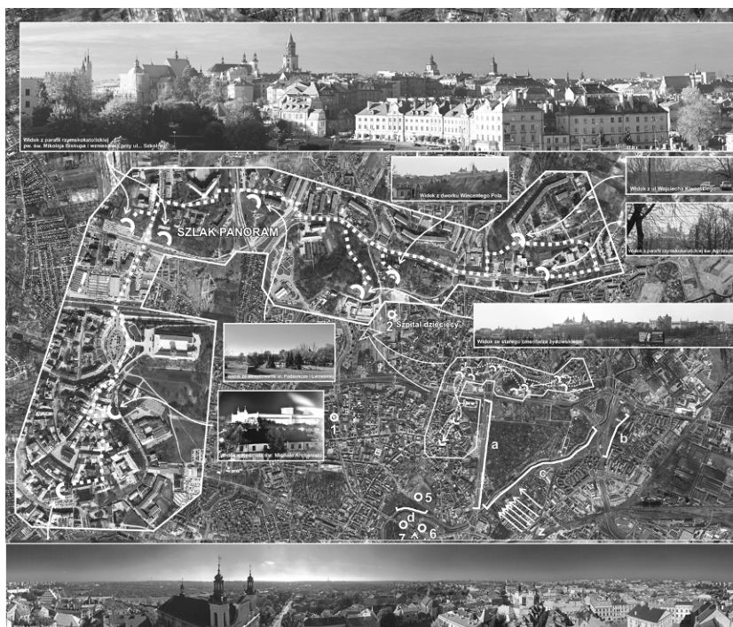
Ryc. 1. „Szlak panoram Lublina”. Fig. 1. Lublin Router of Panoramas.

Kiperskiego, aby dojść w okolice skrzyżowania z ul. Józefa Kustronia. W tym miejscu jest zlokalizowana zatoczka parkingowa, z której rozciąga się kolejny widok na lubelską starówkę (ryc. 3). Zatoczka parkingowa góruje nad niewielkim obszarem zielonym. Po zbudowaniu schodów terenowych możliwe będzie zejście przez ten teren w kierunku trzeciego miejsca obserwacji zabudowy staromiejskiej Lublina. W tym celu należy wrócić na ulicę Kalinowszczyzna i dojść do muzeum Wincentego Pola. Zabytkowy dworek położony jest w pobliżu wysokiej skarpy, z której również widać historyczne centrum Lublina (ryc. 4). Kolejnym przystankiem na szlaku może być stary cmentarz żydowski. Położony jest on na wzgórzu otoczonym ceglany murem. W chwili obecnej jest to obszar niedostępny, ale po planowanych pracach renowacyjnych miejsce dawnego cmentarza może stać się jednym z ważniejszych punktów widokowych Starego Miasta (ryc. 5).