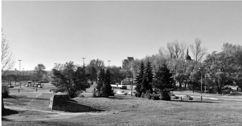
Ryc. 6. Widok na starówkę Lubelską ze skweru w rejon skrzyżowania z ulicami Lwowską i Podzamcze.

rzeć na niedawno przebyty Szlak Panoram, gdyż z jej wierzchołka doskonale widać wszystkie wcześniej odwiedzone punkty widokowe.