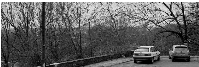
Ryc. 3. Widok na starówkę Lubelską z ul Kwierskiego.

Fig. 3. Scenic view towards old-town of Lublin from Kwierskiego street.