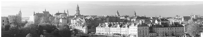
Ryc. 7. Widok na starówkę Lubelską ze Wzgórza Czwartkowego.

Fig. 6. Scenic view towards old-town of Lublin from square at Lwowska and Podzamcze streets.