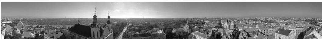
Ryc. 9. Widok na zabudowę Lublina z wieży Trzynitsarskiej..

Fig. 9. Scenic view towards city of Lublin from Trzynitsarska tower.