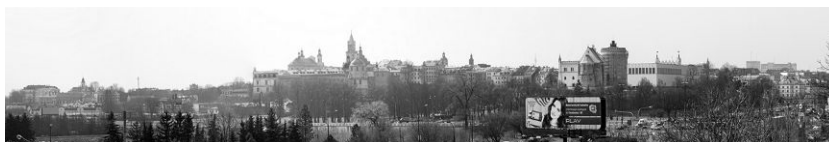
Ryc. 5. Widok na starówkę Lubelską z starego cmentarza żydowskiego.

Fig. 4. Scenic view towards old-town of Lublin from little manor of Wincenty Pol.