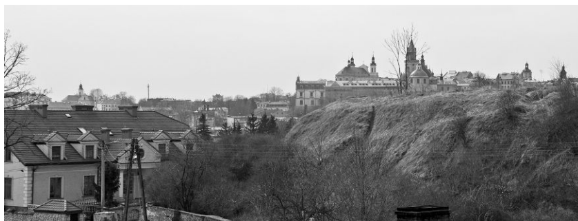
Ryc. 4. Widok na starówkę Lubelską z dworku Wincentego Pola.

Fig. 3. Scenic view towards old-town of Lublin from Kwierskiego street.