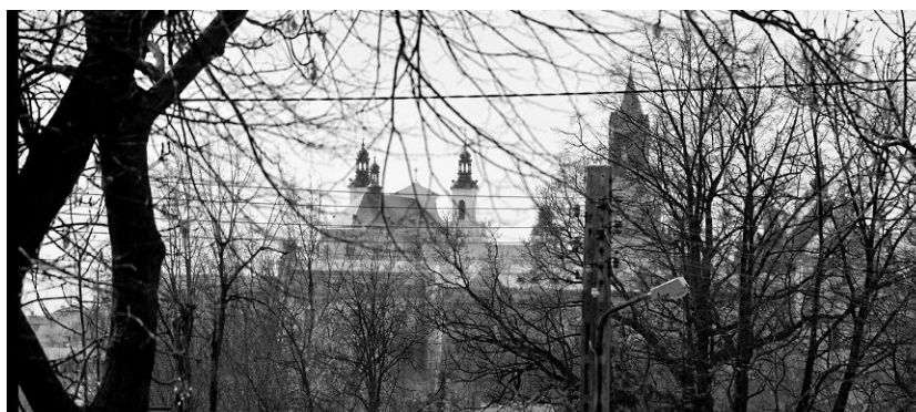
Ryc. 2. Widok na starówkę Lubelską od strony Parafia Św. Agnieszki. Fig. 2. Scenic view towards old-town of Lublin from parish of St. Agnes.