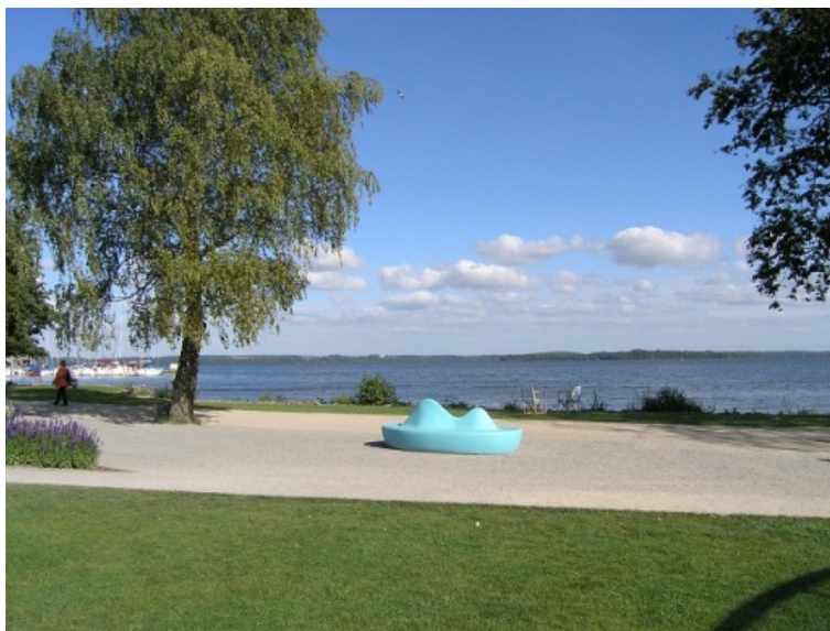
Il. 10. Ścieżka w parku osiedlowym, Malmö, Szwecja. Źródło: fot. autorka 2009

Fig. 9. The boat-bench, Exhibition Area BUGA, Schwerin, Germany. Source: photo by author 2009