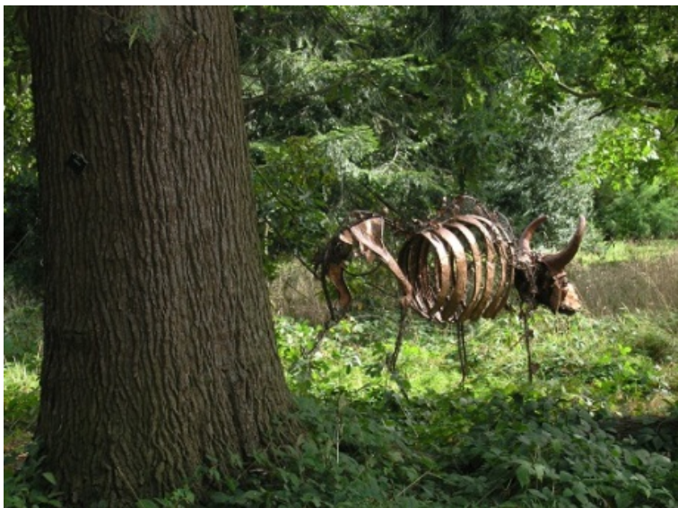
Il. 12. Jedna z przejmujących rzeźb w parku w Kew, Londyn, Wlk. Brytania.

Fig. 11. The place and the sculpture distinguished for the joke with its author, Millesgarden, Stockholm, Sweden.