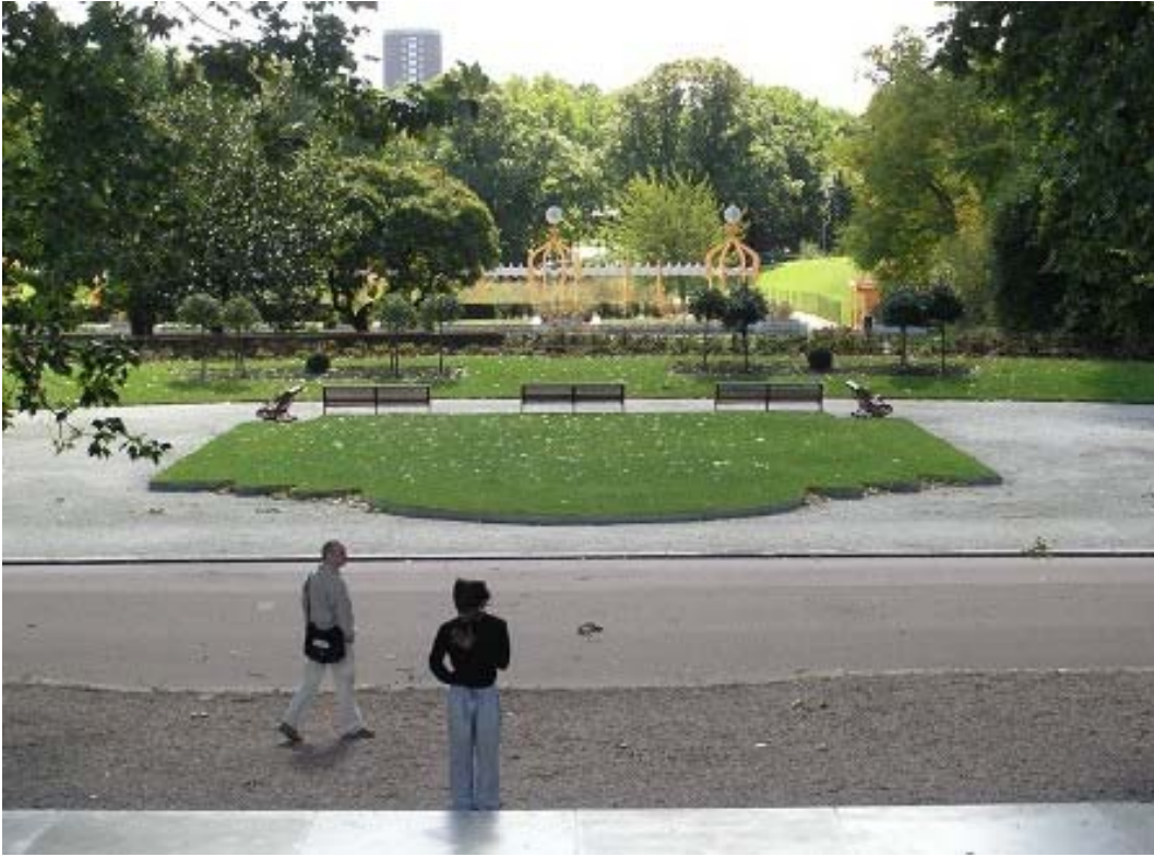
Il. 2. Ikona widokowa parku Battersea, Londyn, Wlk. Brytania.

Fig. 2. The signature view of Battersea Park, London, England.