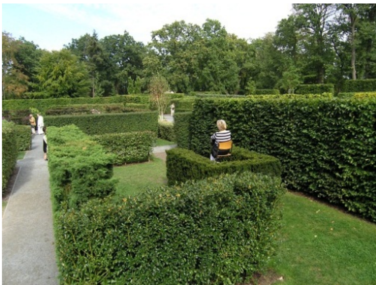
Il. 8. Punkt widokowy i jednocześnie miejsce kontemplacji w ogrodzie-labiryncie, Schwerin, Niemcy.

Fig. 7. The view place arranged in nature style forward to Schwerin Castel, Exhibition Area BUGA, Germany.