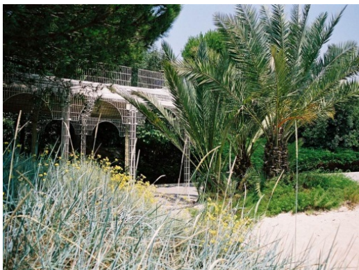
Fig. 16. „Anamorphosis” – one of art arrangements created as a result of the competition in „New View of Kew”. It presents a portrait of two imported for Kew Gardens characters (dr Mike Fay i sir Joseph Hooker). Their faces one can see on polished fences of steel cylinders, Kew Gardens, London, England.

Il. 17. Ogród Wulkanu – instalacja/aranżacja ogrodowa, która wywołuje odczucia gorąca, nasyczonego, ciężkiego zapachu i dźwięku, nasuwających skojarzenia z obecnością wulkanu, Park Feniksa w Nicei, Francja.