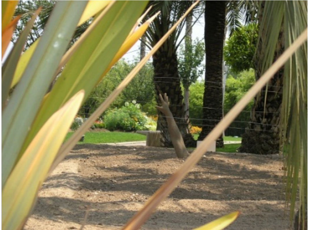
Il. 13. Rzeźba – żart w Parku Feniksa w Nicei, Francja. Fig. 13. The sculpture – jest in Phoenix Parc, Nice, France.