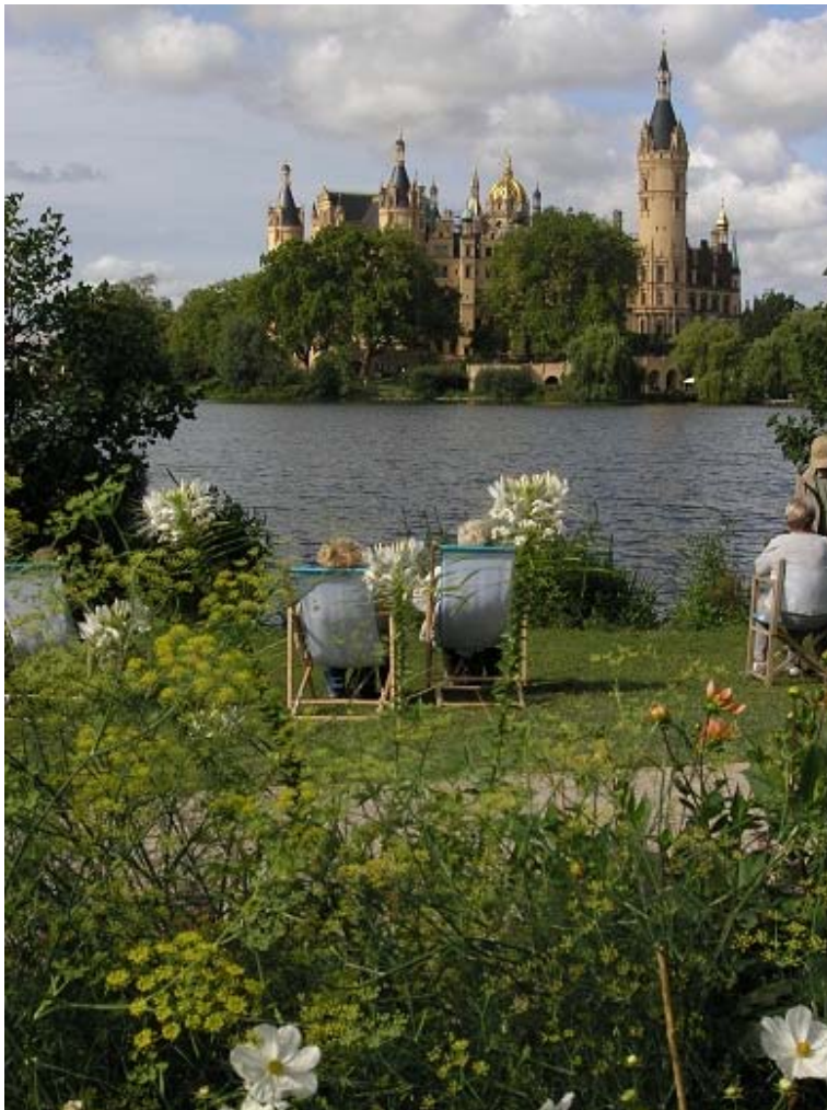
Il. 7. Naturalistyczna kompozycja miejsca z widokiem na Zamek w Schwerin, teren wystawy ogrodowej BuGa, Niemcy.

Fig. 7. The view place arranged in nature style forward to Schwerin Castel, Exhibition Area BUGA, Germany.