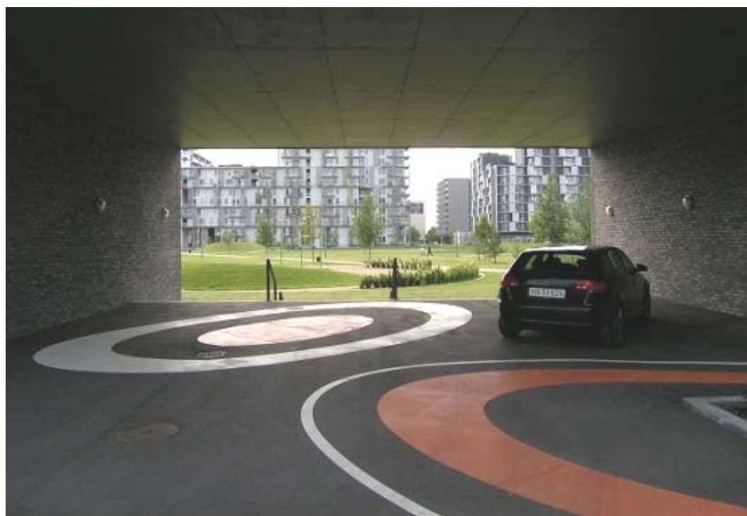
Il. 1. Widok z wnętrza osiedlowego na pobliski park, Kopenhaga, Dania.

Piękny widok nie miałby właściwej siły oddziaływania gdyby nie jego oprawa. Aranżacja punktów widokowych może obejmować samo „okno widokowe”, jego kształt, barwę, bezpośrednie otoczenie (il. 5-7) lub całą kompozycję miejsca (il. 8).