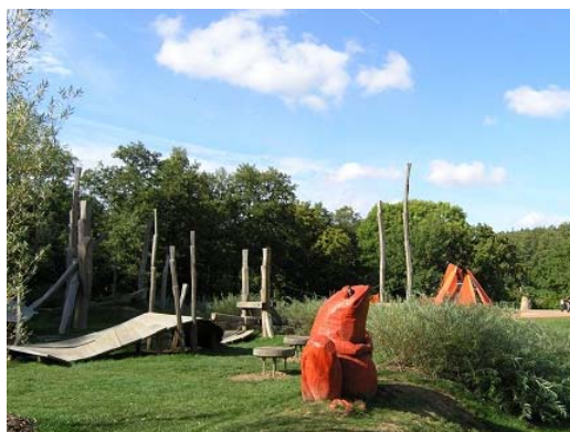
Il. 14. Plac zabaw z rzeźbami zwierząt, wprowadzający w świat wyobraźni nie tylko dzieci, Schwerin, Niemcy.