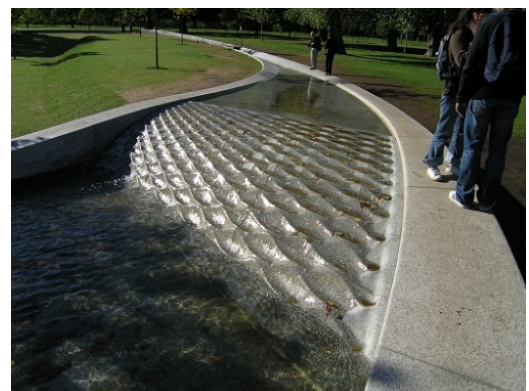
Il. 15. Fontanna Diany – rzeźba-pomnik, a także forma strumienia wtopionego w naturalistyczny krajobraz Hyde Parku, Londyn, Wlk. Brytania