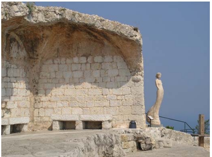
Fig. 6. The viewpoint on the top of the Tropical Garde in Eze – the medieval town near Nice, France