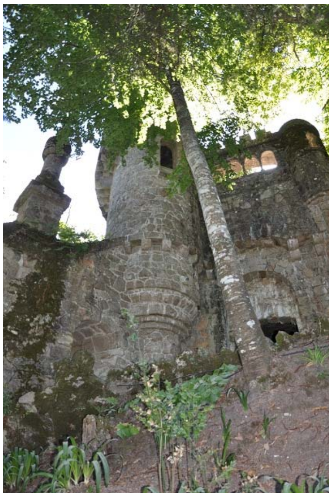
Fig. 19. Cintra gardens – the XIX-century's picturesque example of thematic park. Its leitmotiv is masonic symbolism and the world of old legend, Cintra, Portugal. Source: photo by author 2010

Il. 19. Ogród w Cintrze jest malowniczym przykładem parku tematycznego z początku wieku XX-go, którego tematem przewodnim jest symbolika masońska oraz świat starych legend, Portugalia. Źródło: fot. autorka 2010