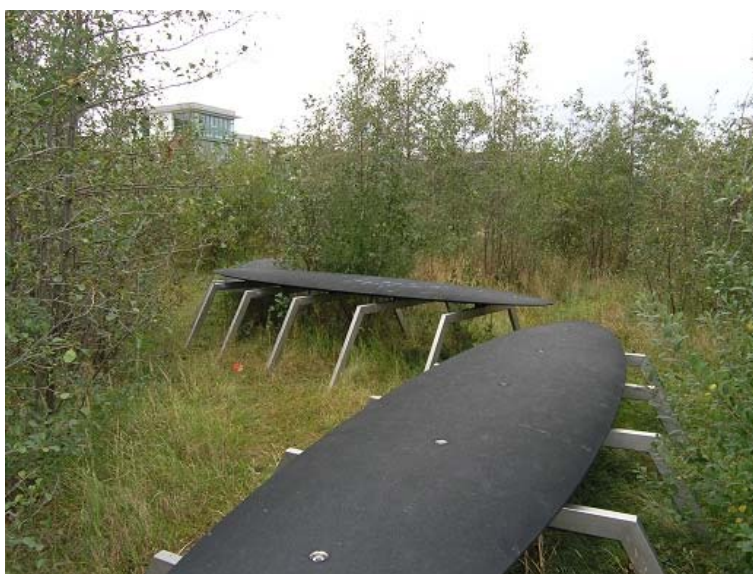
Fig. 10. The “pavement” in condominium, Malmö, Sweden.