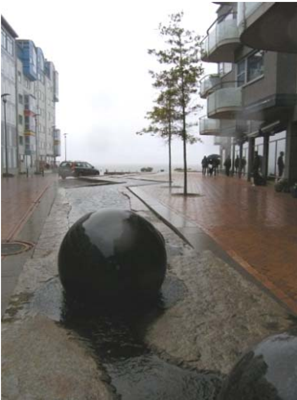
Il. 3. Deptak prowadzący w kierunku parku – bulwaru położonego nad brzegiem morza, Malmö, Szwecja.

Fig. 2. The signature view of Battersea Park, London, England.