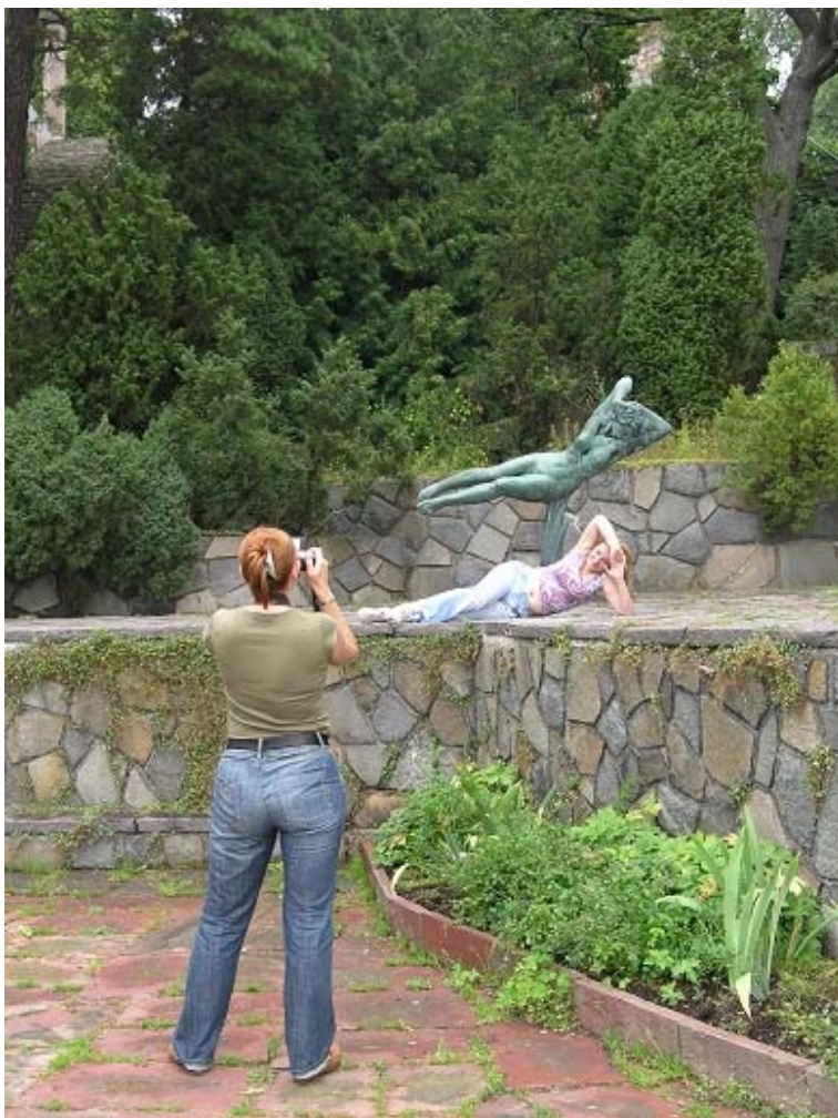
Il. 11. Rzeźba, przy której jest miejsce na zabawę – grę z jej autorem, park rzeźby Millesgarden, Sztokholm, Szwecja.

Fig. 11. The place and the sculpture distinguished for the joke with its author, Millesgarden, Stockholm, Sweden.