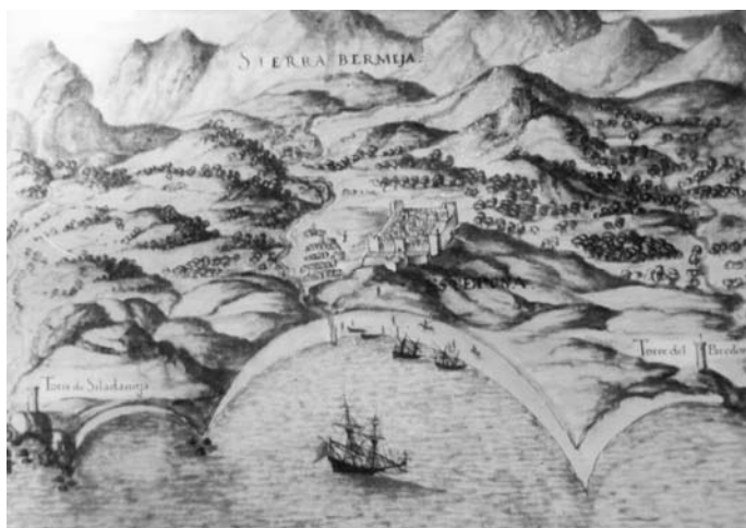
Ryc. 1. Fragment historycznej mapy wybrzeża Andaluzji.

Historia tego obszaru wskazuje, że przyjazny klimat tego obszaru ściągał tu osadników już w czasach fenickich. Przy dobrej widoczności z plaż Costa del Sol zobaczyć można góry Atlas leżące po drugiej stronie Morza Śródziemnego, na terenie Maroka. Świadczy to również o wyjątkowości położenia tego miejsca – bliskości Afryki – co również istotne jest z punktu widzenia bezpieczeństwa europejskiego i relacji transkontynentalnych.