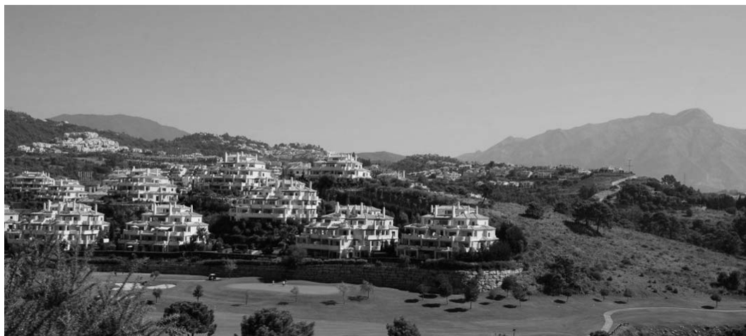
Ryc. 6. Jedno z pól golfowych i nowa zabudowa apartamentowa nawiązująca do stylu andaluzyjskiego.

ilości klubów nocnych i szerokich plaż, stał się ikoną wybrzeża. Wokół Marbelli powstały też osiedla domów jednorodzinnych, ukryte w piniowych lasach, o charakterze „pałacowym”, w których zamieszkali bogaci klienci z Europy, Afryki, a także z Arabii Saudyjskiej i emiratów arabskich.