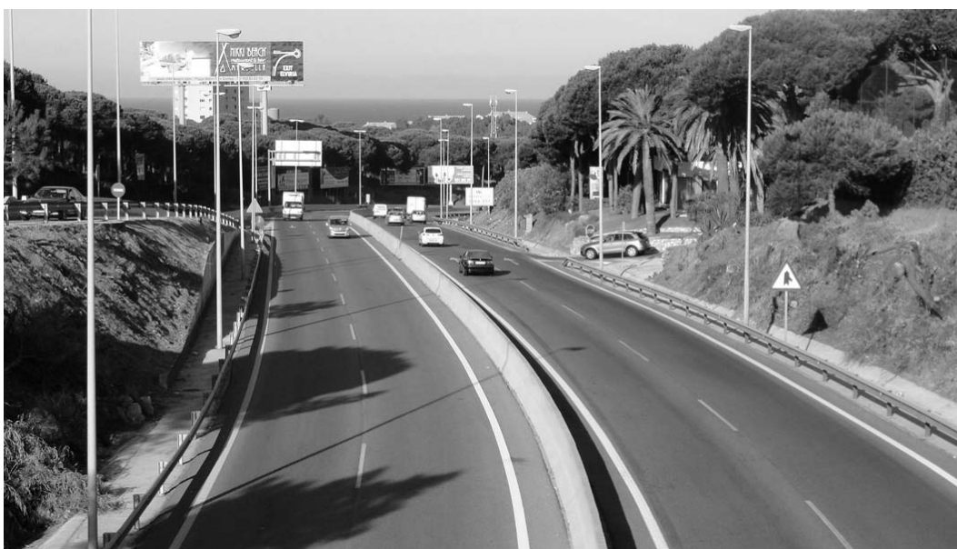
Ryc. 5. Costa del Sol - trasa drogi ruchu szybkiego łączącej poszczególne miejscowości nadmorskie.

saże nadmorskie, ocienione wysokimi palmami, z podziemnymi parkingami, szerokie plaże komunalne, strefy wyłącznego ruchu pieszego w historycznych obszarach miast z chodnikami wyłożonymi mozaiką z pieczołowicie ułożonych drobnych otoczków. Wyremontowano również wiele starych budynków, przywracając im ich pierwotny charakter. Stare dzielnice średniowiecznych arabskich miasteczek, takich jak Torremolinos, Marbella czy Estepona, stały się kolejnymi punktami przyciągającymi rzesze turystów.