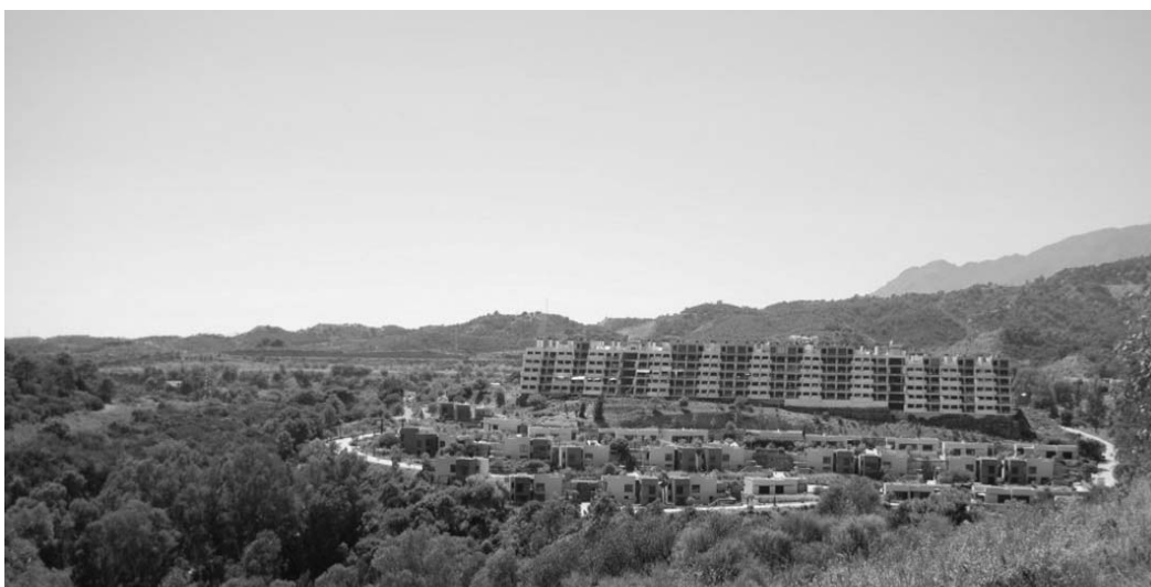
Ryc. 3. Nowe formy zabudowy apartamentowej na zboczach Sierra Blanca. Fig. 3. New forms of apartment houses on the slopes of Sierra Blanca.

Ale również, a może przede wszystkim, na terenach nadmorskich Andaluzji inwestowali Hiszpanie mieszkający w zatłoczonych miastach hiszpańskiego interioru, gdzie przeżycie gorącego okresu letniego w temperaturach ok. 40 st.C wydaje się graniczyć z niemożliwością. Wraz z wzrostem dobrobytu społeczeństwa hiszpańskiego, cykliczna, doroczna migracja całych rodzin nad Morze Śródziemne w okresie letnim, stała się bezpośrednią i najbardziej powszechną przyczyną rozwoju inwestycji turystycznych w pasie nadmorskim, w szczególności obiektów apartamentowych. O ile duża część wczasowiczów korzystała i nadal korzysta z licznych kempingów nadmorskich, coraz większa grupa Hiszpanów kupuje apartamenty i domy wakacyjne.