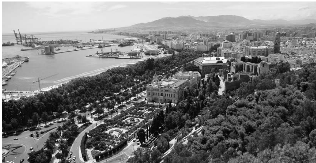
Ryc. 2. Widok miasta Malaga i portu ze wzgórza twierdzy Gibralfaro.