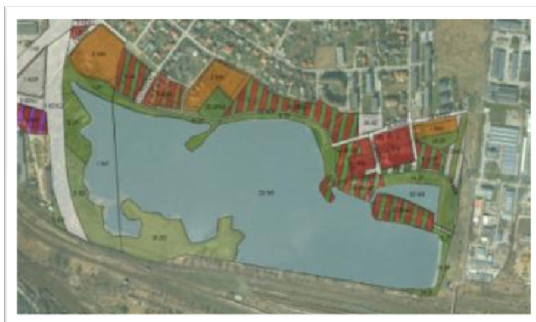
Fig. 1. Map illustrating two of the local spatial development plans (routes Nowopłaszowska and lagoon area bagry)

Kolejną fazą studiów uwarunkowań było szczegółowe przeanalizowanie terenu pod względem wytycznych, jakie znajdują się w studium zagospodarowania i kierunków przestrzennych miasta Krakowa. Wydobyto z map uwarunkowań i kierunków szczególnie takie informacje jak: