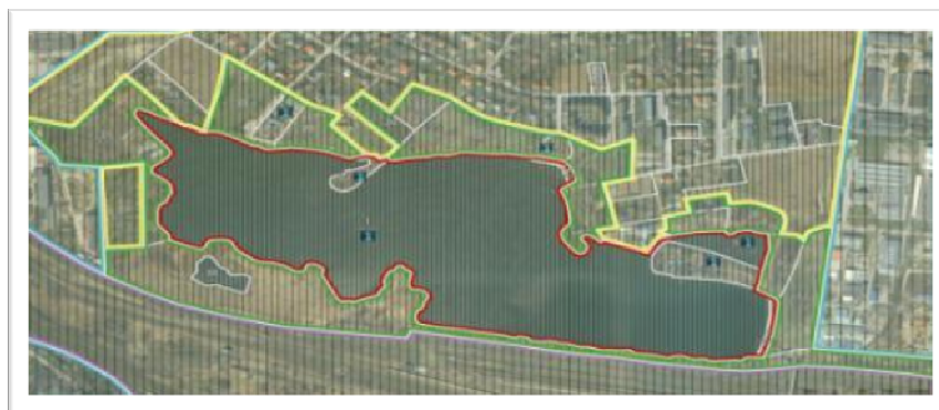
Ryc. 2. Mapa przedstawiająca waloryzację i wytyczne dla terenu opracowania Fig. 2 Map showing the valorization and guidelines for land development

Aby uzyskać zamierzony efekt należy się posłużyć odpowiednimi sposobami działań odpowiednich dla danych stref ochrony.