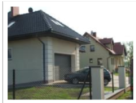
Fot. 2. Zabudowa jednorodzinna. Pic. 2. Single-family houses.