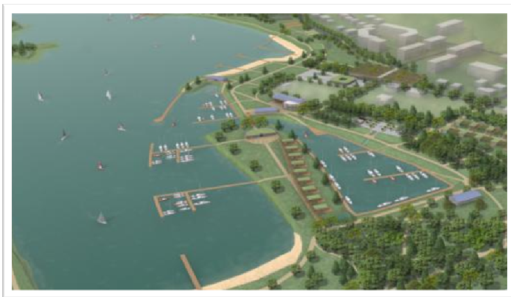
Ryc. 4. Widok z lotu ptaka

sującym miejscu, jakim jest wagon kolejowy. Natomiast południowe nabrzeże zalewu bagry zostało w większości pozostawione w takim stanie, jakim jest, ponieważ znajdują się tam szuwary w postaci pałek i traw wodnych, które są miejscem gnieźdzenia się ptaków. W nielicznych miejscach wprowadzono drewniane nieduże platformy dla wędkarzy. Zaprojektowano również szpaler drzew od strony nasypu kolejowego, aby stworzyć naturalną zaporę dźwiękoszczelną i poprawić panoramę od strony kolei, która w dużym stopniu zniweluje widzianą infrastrukturę kolejową.