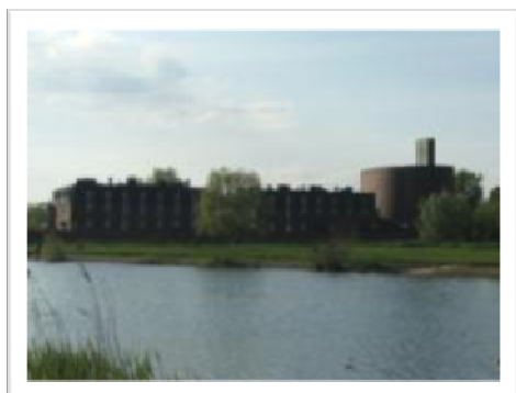
Fot. 3. Zalew i Kościół Trynitarzy. Pic. 3. Lagoon and Trinitarian church.