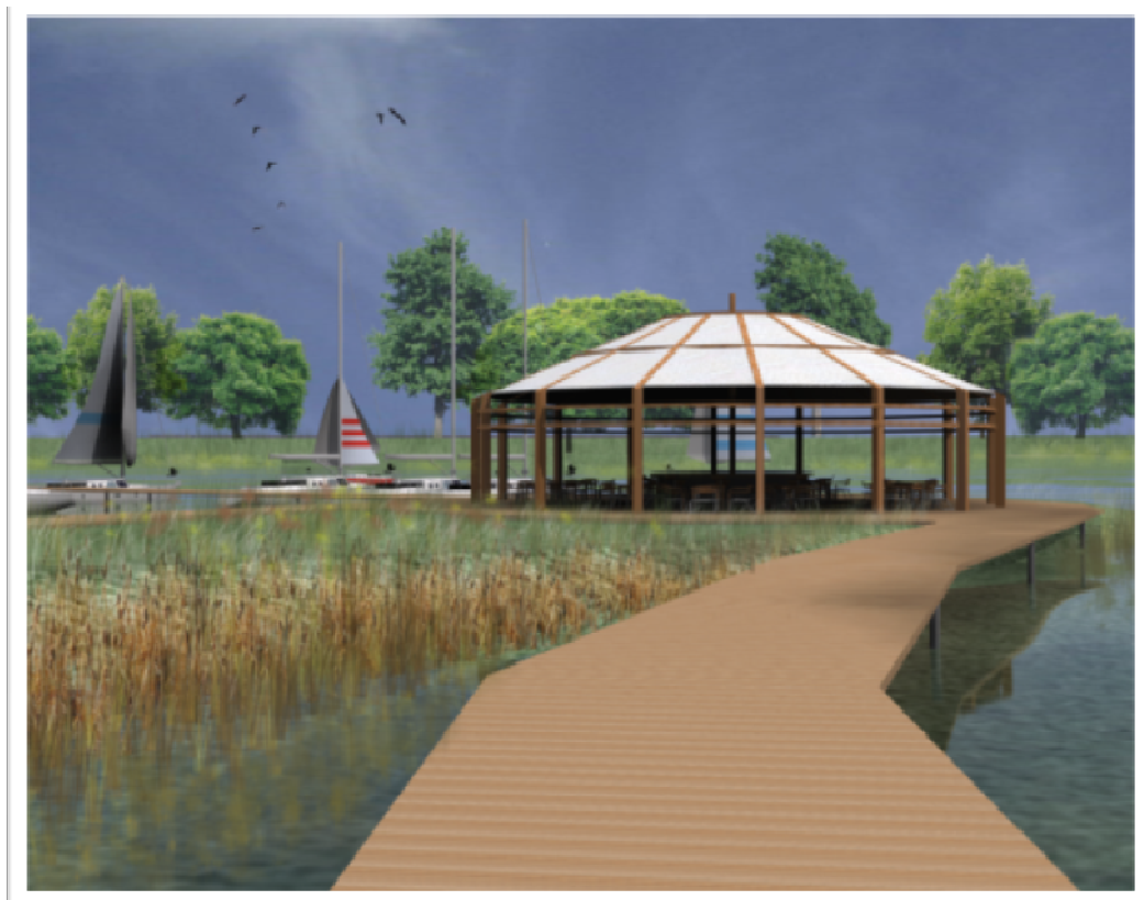
Ryc. 5. Wizualizacja altany

wania i co najważniejsze z dala od części rekreacyjnej, będzie to miejsce spokojnie i zdecydowanie bardziej ciche, co umożliwi prowadzenie na tym obszarze spotkań towarzyskich, a nawet biznesowych.