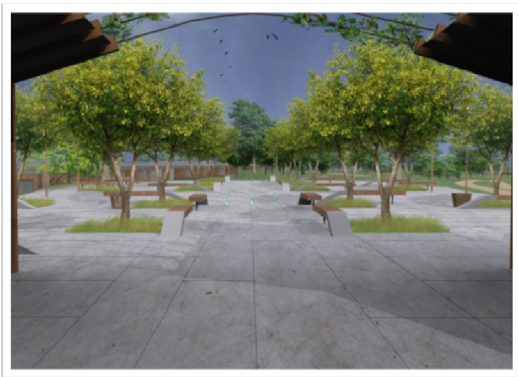
Ryc. 6. Wizualizacja placu głównego.

ne. Nawierzchnia została wykonana z płyt betonowych, które jak w wypadku placu przy parkingu idealnie współgrają z całym otoczeniem. Projekt został tak zrobiony, aby na placu można było realizować imprezy dla młodzieży, takie jak: żeglarskie, wystawy plenerowe, czy koncerty. Będzie to też idealne miejsce do spędzania wolnego czasu dla gości korzystających z domków letniskowych.