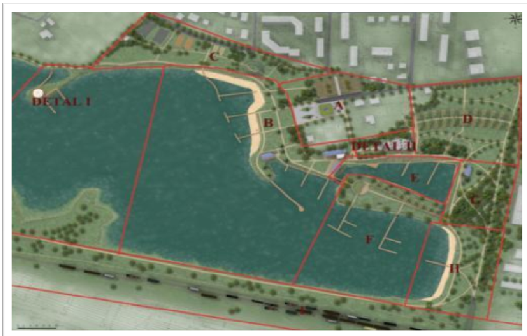
Ryc. 3. Rzut całości z podziałem terenu na strefy, źródło: projekt autora, 2011

Układ komunikacyjny ze względu na zły stan lub w niektórych miejscach jego brak został zaprojektowany od nowa, a co najważniejsze utwardzony. Projektowany system ścieżek został tak poprowadzony, aby można było się szybko i komfortowo dostać na każdą część terenu. Są również miejsca, gdzie poprowadzono je faliście, zwłaszcza w części parkowej założenia, co umożliwi spacerowanie i zmniejszy natężenie w głównych ciągach komunikacyjnych. Główna aleja została poprowadzona od kładki pieszej nad torami, aż do altany kawowej, gdzie w pierwszej kolejności biegnie wzdłuż plaży, mijając część parkową, a następnie rozgałęzia się. Jedna została poprowadzona przez plac główny do budynku gastronomicznego i parkingu, natomiast druga idzie pomiędzy budynkami restauracji i mostu zwodzonego na półwyspie. Kolejnym ważnym punktem jej przebiegu jest Ośrodek Żeglarski „Horn”, a następnie część sportowa (plaża, boiska), w tym miejscu dla zabezpieczenia terenu przed podnoszeniem się poziomu wody i zalaniem, aleja została poprowadzona na sztucznie usypanym wale gdzie na samym jego końcu jest możliwość przejścia przez pomost do pawilonu kawowego lub udania się na tereny nieobjęte projektem koncepcyjnym.