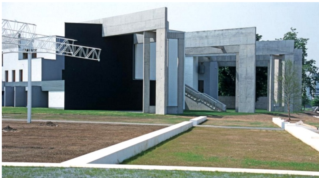
Fig. 1. Z. Hecker, Jewish Community Centre, Duisburg, Germany.

Ryc. 1. Z. Hecker, Centrum Wspólnoty Żydowskiej, Duisburg, Niemcy.