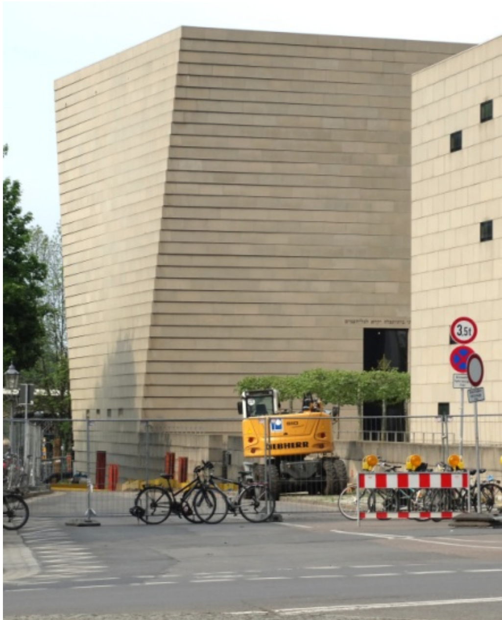
Fig. 3. Nikolaus Hirsch, Wolfgang Lorch, New Synagogue, Dresden, Germany. Ryc. 3. Nikolaus Hirsch, Wolfgang Lorch, Nowa Synagoga, Drezno, Niemcy.

The name New Synagogue in Dresden (Fig. 3) built in 2001 actually means the complex that consists of the house of prayer and community centre as well. It is designed by Nikolaus Hirsch and Wolfgang Lorch 4 . The coloured massive concrete blocks imitate stone [10, p. 107]. This material solution provides the impression of dignified architecture that is dynamic at the same time.