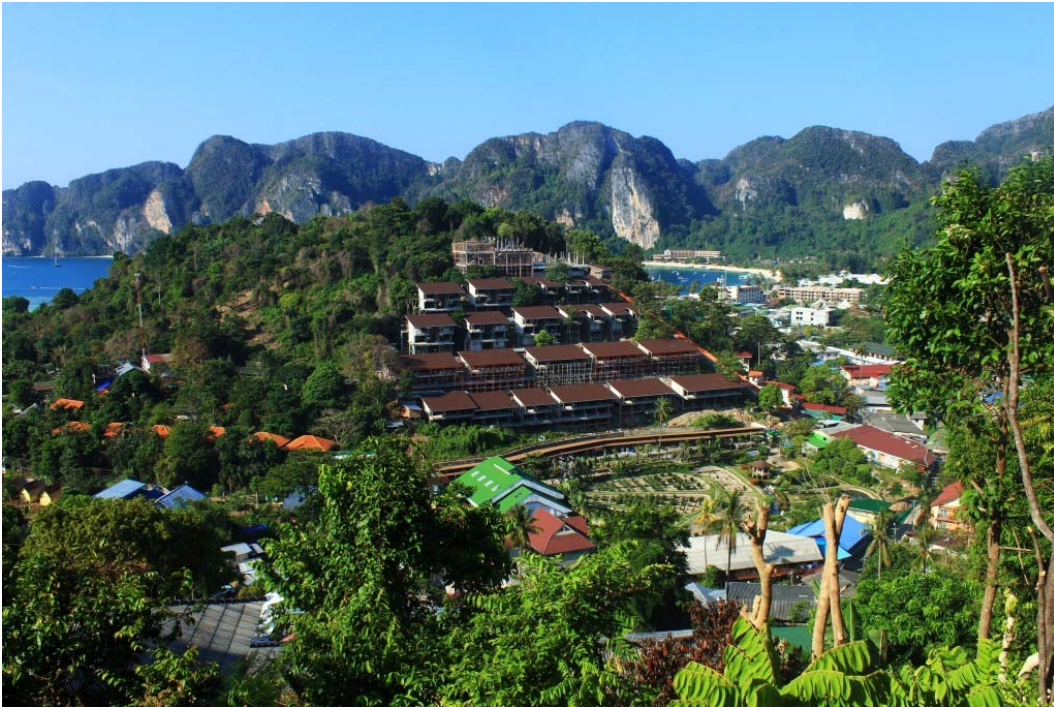
Fig. 10. View on Ko Phi Phi Don.

The buildings fit into the unchanged terrain, but the place where they are located is devoid of greenery. Each additional building placed in such a unique environment influences the perception of visitors and residents of this place.