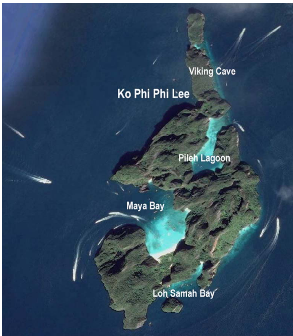
Fig. 4. Ko Phi Phi Lee, the view from Maya Bay.

Ko Yung, also called Mosquito Island, is located in the north of the archipelago, 5 km from Ko Phi Phi Don. It is a small island, about 700 meters long, with a sandy beach surrounded by cliffs and forest. Its common name is associated with the mosquitoes that appear on the island at sunset. In the cove in the north sharks can be seen.