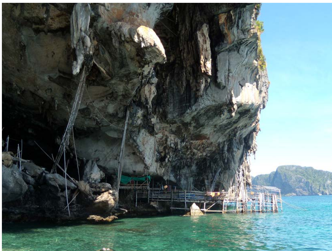
Fig. 8. Viking Cave.

The Tham Phaya Nak cave is also place where edible bird nests by the Swiftlet can be found. Due to the presence of the bird nest collectors, the access to the cave is strictly forbidden . [6] When travelling by boat it is possible to admire the cave, because most of the tour boats are stopping by the cave or slow down.