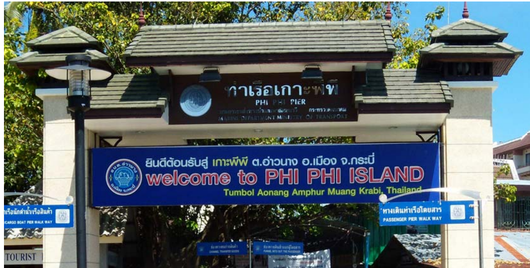
Fig. 2. Ko Phi Phi Don.

Ryc. 2. Ko Phi Phi Don.