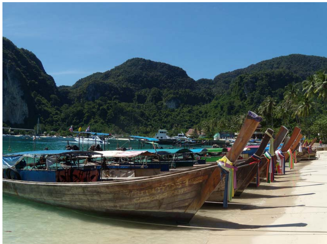
Fig. 3. Boats on Ko Phi Phi Don.

Ryc. 2. Ko Phi Phi Don.