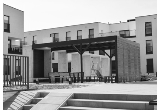
Fig. 7. Nowe Źerniki, meeting area

Ryc. 6. Nowe Źerniki, widok ogólny