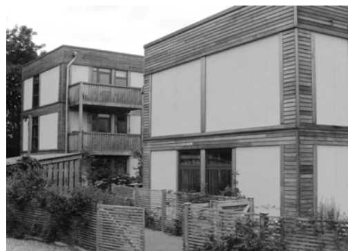
Fig. 4. LILAC, private houses

Ryc. 3. LILAC, zewnętrzna część wspólna