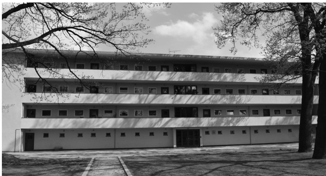
Fig. 8. Breslau, one of the buildings at housing estate near Zielonego Dębu St., designed for WuWa exhibition in 1939. This housing estate was main inspiration for recently built Nowe Źerniki.

Ryc. 7. Nowe Źerniki, miejsce spotkań