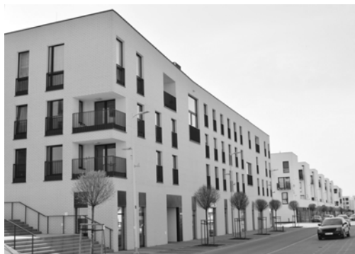
Fig. 6. Nowe Źerniki, main perspective

Ryc. 6. Nowe Źerniki, widok ogólny