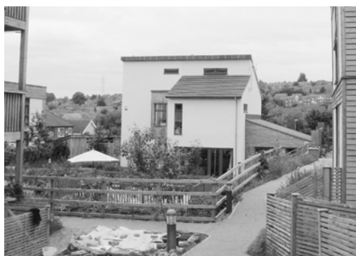
Fig. 3. LILAC, shared common area

Another example of cohousing is LILAC (Low Impact Living Affordable Community) created in Leeds, United Kingdom in 2013. On site, there are 20 residential units with 43 inhabitants of different sex, age, financial standing and interests. Apart from two- and three-storey private houses (Fig.4), there is a common house (Fig.3) and a common meeting area at the centre of a lake (Fig.5). At the further end of the plot there are gardens, while parking spaces and bike racks are situated in its corners. An important aspect of this cohousing project was the residents' joint effort to reduce carbon dioxide emissions; therefore, buildings were erected in technology using straw and clay in a wooden construction 5 .