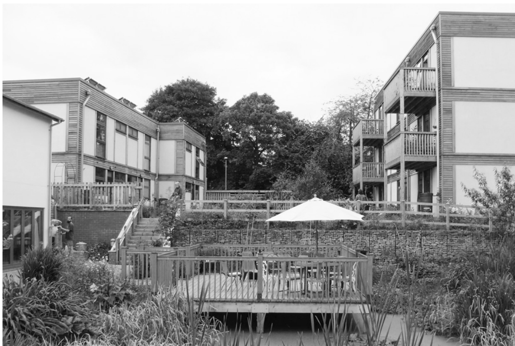
Fig. 5. LILAC, shared common area

Ryc. 5. LILAC, zewnętrzna część wspólna