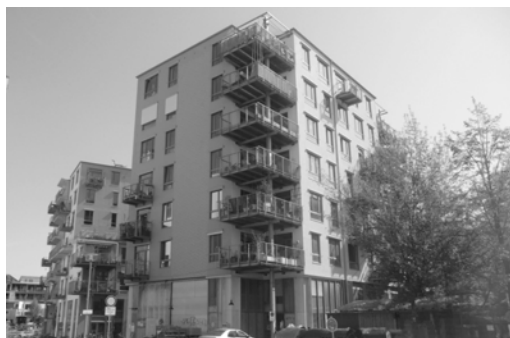
Fig. 1. Spreefield, view from street side

Ryc. 1. Spreefield, widok od strony ulicy