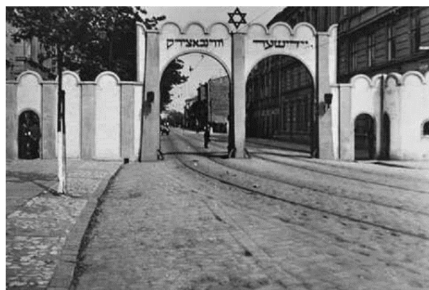
Ryc. 8. Brama do getta w Podgórzu, źródło: www.holocaustresearchproject.org/ghettos/krakow/krakow

zagłady. Wydarzenia te niejednokrotnie były okrutne i krwawe. Na tym placu również wymordowano dzieci i starców podczas likwidacji getta. Podczas wysiedleń z krakowskiego getta rozpoczęto równocześnie budowę obozu koncentracyjnego na terenie cmentarza żydowskiego w Płaszowie. Budowa obozu koncentracyjnego przyspieszyła decyzję o likwidacji podgórskiego getta, która zapadła ostatecznie 13 marca 1943 roku. Część Żydów zostało wywiezionych do obozu koncentracyjnego Auschwitz, pozostali do obozu płaszowskiego.