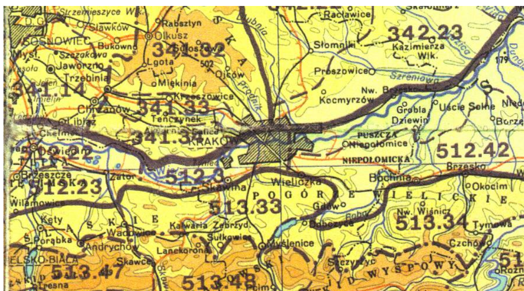
Il.2. Położenie Krakowa na tle krain fizycznogeograficznych Polski, źródło: Kondracki J., Geografia Polski. Mezoregiony fizycznogeograficzne , Wyd. Nauk. PWN, Warszawa, 2002

szości w granicach Podgórze, zbudowane są z utworów górnourajskich, na których miejscami zalegają pokrywy kredowe. Istotnym walorem budowy geologicznej dzielnicy jest występowanie na powierzchni obszaru utworów górnej jury, reprezentujących typ wapienia skalistego i ławicowego (il. 3). Skąły te są najstarszymi utworami makroregionu, wyraźnie zaznaczającymi się w rzeźbie izolowanych wzgórz. Na wapieniach pochodzących z okresu górnej jury, w niektórych miejscach zalegają młodsze skąły kredowe. W okresie kredy, w wyniku kilkakrotnie wkraczącego na ten obszar morza powstały platformy abrazyjne, czyli płaskie fragmenty skalnego dna wygładzane przez morze. Na tej płaskiej powierzchni dobrze widoczne są uskoki. Najlepiej zachowana kredowa platforma abrazyjna znajduje się w Rezerwacie Przyrody Nieożywionej „Bonarka”. W pobliskim kamieniołomie Liban występuje platforma, na powierzchni której zalegają osady okresu kredy. Obszar Bramy Krakowskiej pod względem rzeźby terenu charakteryzuje się występowaniem pagórz zrębowych rozdzielonych rowami tektonicznymi, powstałych w okresie miocenu, podczas fałdowania Karpat Fliszowych. W tym okresie tworzyły się uskoki, które pocięły południową część obszaru na zręby i rowy tektoniczne. Zręby tektoniczne, zbudowane są z wapieni górnourajskich oraz wapieni i margli pochodzących z okresu górnej kredy i tworzą na niskie izolowane wzniesienia. W obrębie dzielnicy XIII Podgórze występują izolowane zręby Krzemionek Podgórskich.