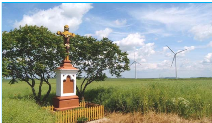
Ryc. 4. Ważny symbol kultu religijnego w sąsiedztwie Farmy Wiatrowej „Lipniki” wsi Lipniki.

Fig. 3. The wind farm "Lipniki" in the immediate vicinity of residential area of the Chociebórz village.