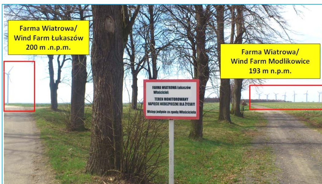
Ryc. 6. Ostrzeżenie przed wejściem w strefę farm wiatrowych „Łukaszów” i „Modlikowice” ustawione z ponad kilometrowym wyprzedzeniem.

Fig. 5. Signs prohibiting entry into the wind farm "Łukaszów" zone.