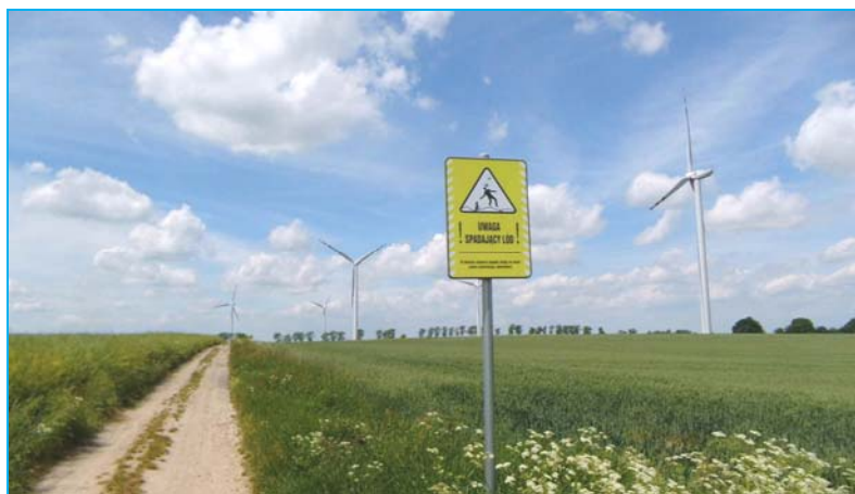
Ryc. 7. Oznaczenie przed wejściem w strefę niebezpieczną w Farmie Wiatrowej „Lipniki” wsi Lipniki.

Analizowane farmy wiatrowe zostały oznaczone, ale w oznaczeniach tych są różne przekazy. Zasadne jest ostrzec użytkowników dróg i pól, które farma obejmuje, przed możliwością oderwania się lodu od łopat wirnika, co uczyniono w przypadku Farmy Wiatrowej „Lipniki”. Przyjęto zasadę rozmieszczenia oznaczeń na drogach przebiegających pomiędzy elektrowniami w odległości minimum 150% w stosunku do wysokości wieży i średnicy wirnika [9, s. 7–8; 11] (ryc. 7). Nie utrudnia to ruchu wewnątrz farmy i nie daje poczucia wstępowania na teren „otwarty”, lecz „prywatny”. Dzięki temu nie potęguje to negatywnych odczuć i tak już nienaturalnego „nowego” krajobrazu, który został stworzony przez powstałą farmę.