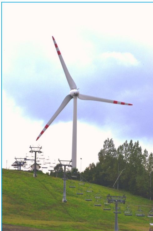
Ryc. 9. Wyciąg narciarski obok Farmy Wiatrowej „Kamieński”. Źródło: fot. autora

Fig. 8. Warning sign with description at the entrance to WF "Jarogniew Moltowo". Source: [27]