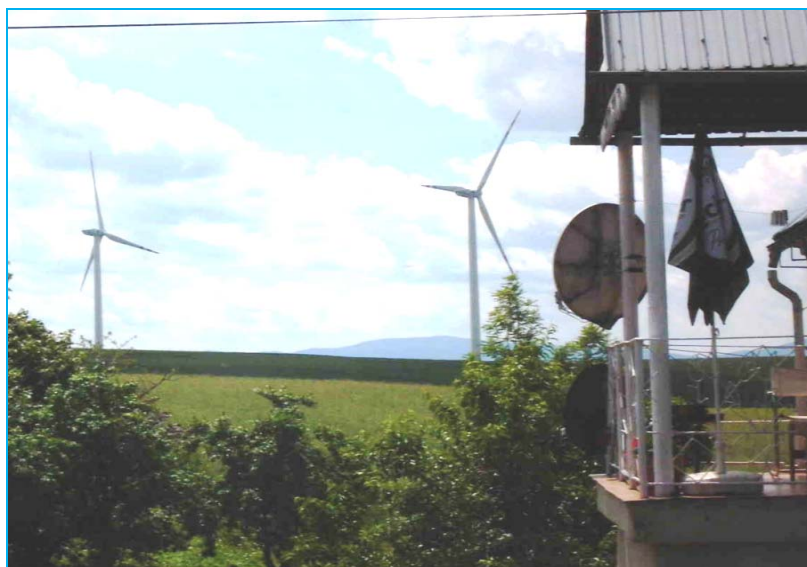
Ryc. 3. Farma Wiatrowa „Lipniki” w bezpośrednim sąsiedztwie zabudowy mieszkaniowej wsi Chociebórz.

Fig. 2. Communication within the WF "Lipniki".