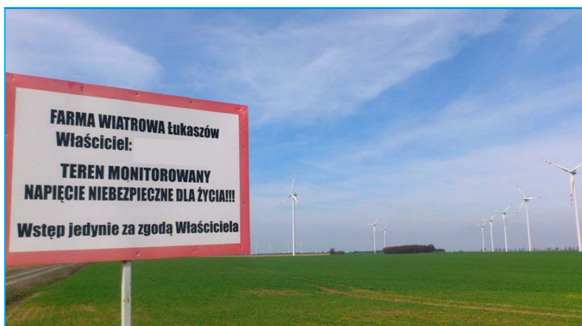
Ryc. 5. Oznaczenie przed wejściem w strefę Farmy Wiatrowej „Łukaszów”.

ce”, optycznie powiększa zasięg ich wizualnego oddziaływania. Przybliża farmy do mieszkańców i innych użytkowników najbliższych terenów, dając poczucie sąsiedownia z rozległą prywatną własnością, której przekroczenie grozi różnymi konsekwencjami, w tym utratą zdrowia i życia (rys. 5). Duże tablice wyraźnie ostrzegają przed zbliżeniem się do farm, dają wrażenie odarcia z ogólnodostępnej własności. Stanowią wyrwę w dotychczasowej percepcji tego miejsca, potęgują i tak już niełatwą sytuację tego regionu związaną ze zmianą krajobrazu w wyniku budowy farm. Farmy wkraczają w głąb i tak już pomniejszonej przestrzeni prywatnej i społecznej mieszkańców sąsiadujących wsi. Zakaz obejmuje z całym rozmachem już nie tylko bezpośrednie sąsiedztwo poszczególnych elektrowni, ale także zabrania korzystania z pól, a nawet dróg śródpolnych, którymi zawsze spacerowało się w niedzielne popołudnie lub które (jak w przypadku omawianych farm) prowadziły do punktów widokowych na Góry Kaczawskie, pasma wulkaniczne pn. Szlak Wygasłych Wulkanów oraz średniowieczny zamek Grodziec (rys. 6). To, co stanowi fundament i wyróżnik tego miejsca, zostało wirtualnie i rzeczywiście przysłonięte przez farmy wiatrowe.