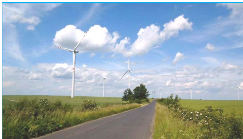
Ryc. 2. Komunikacja wewnątrz Farmy Wiatrowej „Lipniki”.

Fig. 2. Communication within the WF "Lipniki".