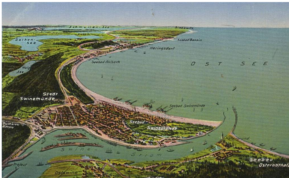
Fig. 1. Panoramic view " baltick Kurort on Uznam Island (the postcard from the beginning of XX centaury).

The three Baltic islands that were unknown to broad public: Wolin, Uznam and Rugia with their sandy shores became the favourable location for organization of sea baths and holidays for the Berlin elites of that time.