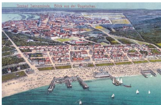
Fig. 8 a. development of the spa area - the 19th and 20th centuries (occasional postcard). Source: [28]

traditions, and shaping a completely new seaside landscape. There are several significant achievements connected therewith... (Figs. 11, 12a, b) 11