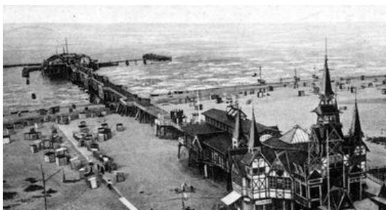
Fig. 7 a. Old pier in Herigensdorf - view around 1924.