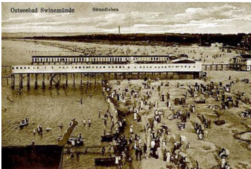
Fig. 4. Bath pavilions in Świnoujście -1903.

Ryc. 4. Pawilony kąpielowe w Świnoujściu -1903r.