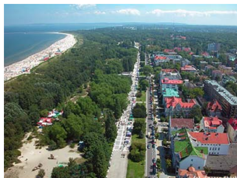
Fig. 8 b. A fragment of the new promenade in Świnoujście, 2012. Source: archives KAWTiMP

Ryc. 8a zagospodarowanie dzielnicy uzdrowskiej - przełom XIX i XX wieku (okolicznościowa pocztówka). Źródło: [28]