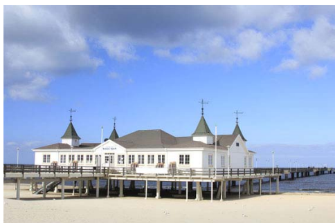
Fig. 6 b. Entrance pavilion at the pier in Ahlbeck on the island of Usedom. Ryc. 6b. Pawilon wejściowy na moło w Ahlbeck na wyspie Uznam