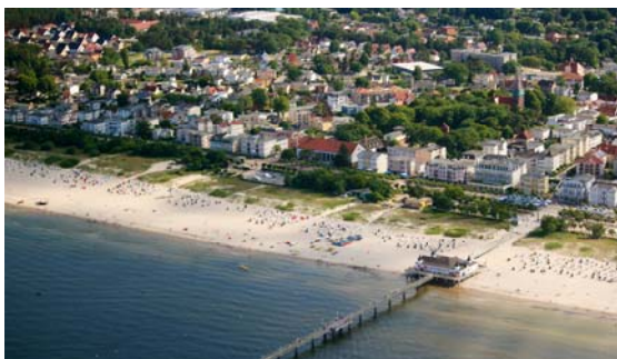
Fig. 6 a Pier in Ahlbeck.. Ryc.6a Moło w Ahlbeck.