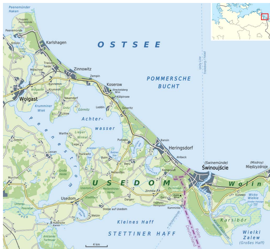
Fig. 2 Uznam Island.

The Uznam (Ger. Usedom) Island is located between the Baltic Sea, Szczecin Lagoon and the rivers Peene (from the west) and Świna (from the east). It has an area of 445 km 2 . Since 1945 72 km 2 of it (including the town of Świnoujście) is on the Polish side of the border. Highly scattered, with numerous peninsulas, it has all the features of both the seaside and inland ecosystems, which form the remains of the primeval (postglacial) peninsula (Fig. 2).