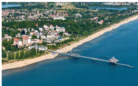
Fig. 7 b. New pier in Herigensdorf with a shop pavilion and restaurant.