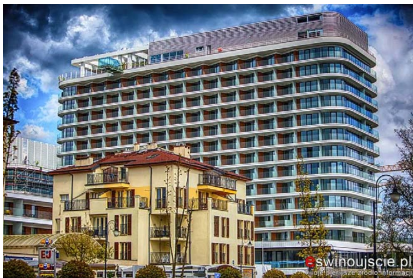
Fig. 9. At the new promenade: the Radisson Blu Resort hotel. Source: [13]

Ryc. 8b Fragment nowej promenady w Świnoujściu, 2012 r. Źródło: archives KAWTiMP