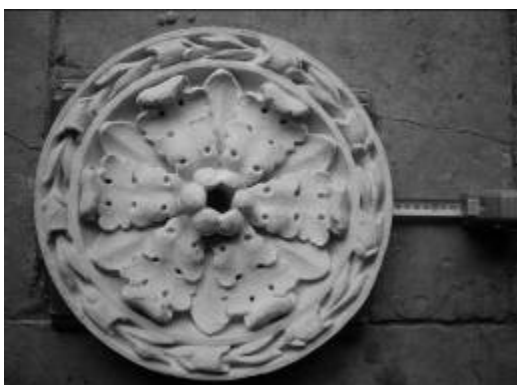
Ryc. 10. Zespół pałacowo-parkowy w Przeworsku – sztukateria w budynku oranżerii Fig. 10. The Palace – Park Complex in Przeworsk – conservatory building stucco.

W budynku koniuszego projekt objął remont kapitalny oraz adaptację budynku na cele muzealne (wystawienniczo-magazynowe i biurowe). Zmianie uległa elewacja, zdewastowana w latach PRL. Obecnie, pomimo braku zachowanych materiałów dokumentacyjnych przywrócono jej historyczny, uporządkowany i stonowany charakter. 14