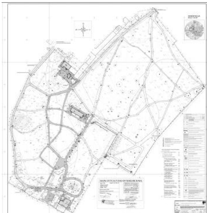
Ryc. 13. Zespół pałacowo-parkowy w Przeworsku – projekt zagospodarowania parku Fig. 13. The Palace – Park Complex in Przeworsk – project management of the park

Tak rozumiany wachlarz działań ma szansę na doprowadzenie do aktywizacji kulturowej i społecznej wywołującej pożądane efekty, w tym efekt ekonomiczny. Jest przykładem szerokiej i dalekosiężnej polityki samorządu terytorialnego i prawidłowego planowania w skali województwa i miasta.