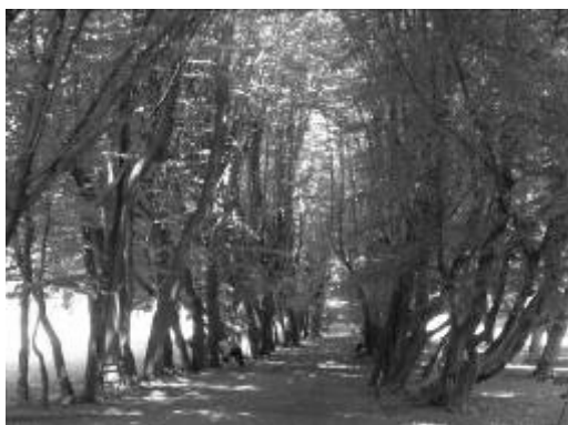
Ryc. 2. Zespół pałacowo-parkowy w Przeworsku – aleja grabowa

Fig. 1. The Palace – Park Complex in Przeworsk - park