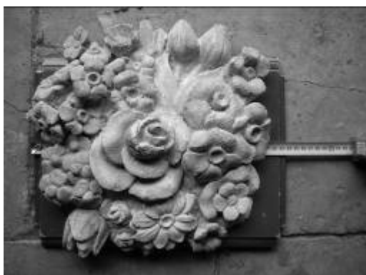
Ryc. 11. Zespół pałacowo-parkowy w Przeworsku – sztukateria w budynku oranżerii Fig. 11. The Palace – Park Complex in Przeworsk – conservatory building stucco.