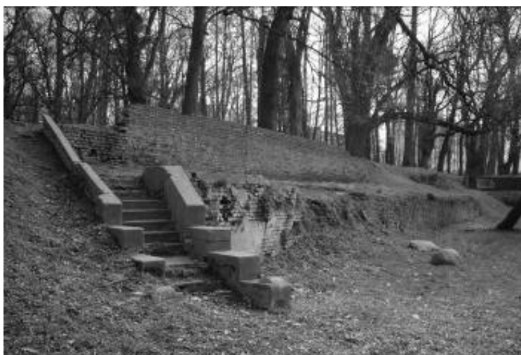
Ryc. 8. Zespół pałacowo-parkowy w Przeworsku – skarpy Fig. 8. The Palace – Park Complex in Przeworsk – embankment.

artykułu, bezpośredni zamawiający (dyrekcja Muzeum w Przeworsku) postawił szereg zadań, które dotyczyły zarówno założenia krajobrazowego jak i twardej substancji architektonicznej. Należy podkreślić, że pomimo kompleksowości dokumentacji projektowej ważkim aspektem podejmowanych prac projektowych była szczupłość funduszy zarezerwowanych na późniejsze prace wykonawcze. 12