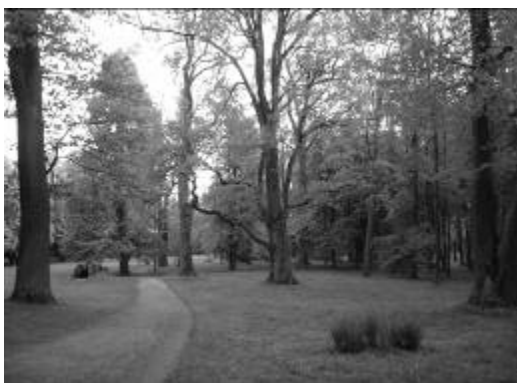
Ryc. 1. Zespół pałacowo-parkowy w Przeworsku - Park

Park dzieli się na park dolny południowy oraz górny północny. Na jego terenie znajdują się liczne pomniki przyrody: aleja grabowa (76 szt grabow), 7 szt. lip szerokolistnych, 2 jesiony wyniosłe, 3 platany klonolistne, 1 szt. lipy drobnolistnej, 1 szt. sosny amerykańskiej, 1 szt. buku pospolitego i 4 dęby szypułkowe. Teren parku objęty jest ochroną konserwatora zabytków. W układzie kompozycji roślinnej zachowało się też sporo okazów egzotycznych tj. cyprysyk, klek kanadyjski czy korkowiec amurski. 10