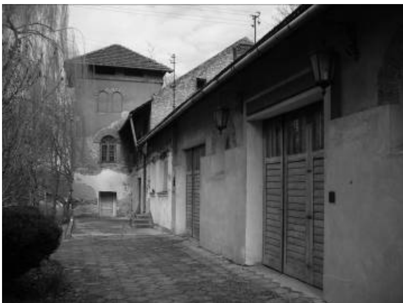
Ryc. 7. Zespół pałacowo-parkowy w Przeworsku – Dom Koniuszego.

W głębi parku znajduje się budynek koniuszego, stajnie i powozownia. Budowla powstała zapewne na początku XIX wieku. Jest możliwym, że początkowo użytkowana była jako obora z częścią mieszkalną. Wskazywałaby na to jej pierwotna nazwa – Holendernia. Dopiero w późniejszym okresie, kiedy wybudowano drugą oborę, zamieniono przeznaczenie obiektu na stajnię i wozownię z domem koniuszego. Skromna architektura budynku nawiązuje do stosowanej na zachodzie Europy na przełomie XIX /XX wieku architektury budowli sytuowanych w ogrodach i parkach, a czerpiących wzorce z renesansu. Architektura ta, charakteryzowała się malowniczo zestawionymi bryłami, z kwadratowymi wieżami akcentującymi narożniki, ze skromnym podziałem powierzchni ścian i delikatnymi obramieniami okien.