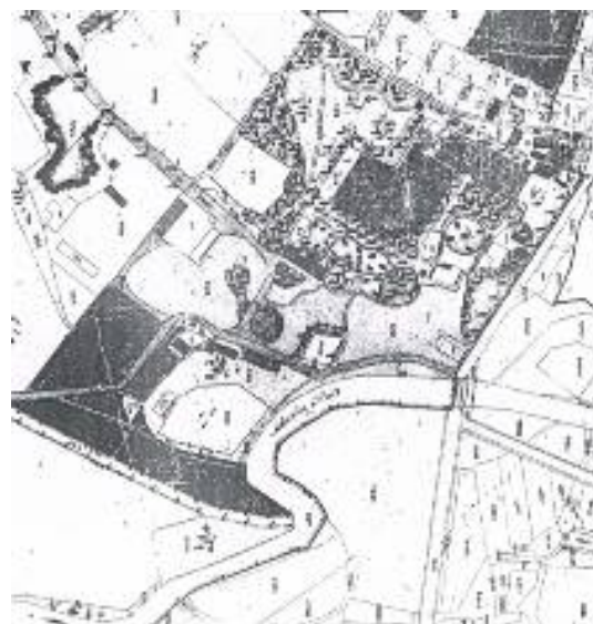
Ryc. 5. Zespół pałacowo-parkowy w Przeworsku – plan katastralny z 1849r.

Pierwsze prace budowlane, które przy pałacu prowadził jeszcze nadworny architekt księżnej Izabeli Lubomirskiej Jan Griesmayer , dokończyli Piotr Aigner oraz sztukator Fryderyk Bauman , który zaprojektował dekoracje wnętrz. W miejscu istniejącego późno-renaesansowego dworu obronnego, architekci wzniesli niewielki pałacyk o cechach angielskiego klasycyzmu. Obiekt, którego budowę zakończono ok. 1807 r., w połowie XIX w. został rozbudowany według projektów Feliksa Księżarskiego i zyskał obecny kształt architektoniczny. Pałacyk to piętrowy, z poddaszem, częściowo podpiwniczony budynek, posiadający dach czterospadowy o małym kącie nachylenia i ciekawym ryzalicie na parterze. Budynkowi estetycznego i funkcjonalnego smaku dodają ośmiofilarowa galeria od strony zachodniej i dwie klatki schodowe (jedna ukryta w drugiej i przeznaczona dla służby). W murach pałacu ciągle można odnaleźć elementy systemu ogrzewania Meisnera (nawiew ogrzany powietrzem) zaprojektowanego przez inż. Józefa Bema, późniejszego generała i bohatera wojsk polskich. 11