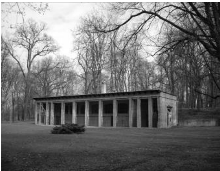
Ryc. 6. Zespół pałacowo-parkowy w Przeworsku – budynek oranżerii

Fig. 6. The Palace – Park Complex in Przeworsk – conservatory building.