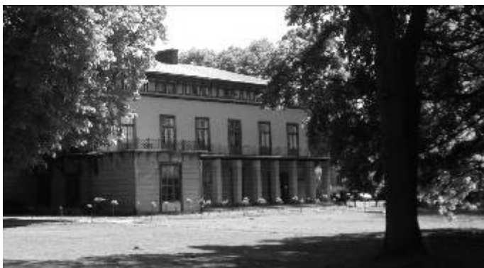
Ryc. 3. Zespół pałacowo-parkowy w Przeworsku – Pałac, galeria zewnętrzna

Fig. 2. The Palace – Park Complex in Przeworsk - hornbeam alley.