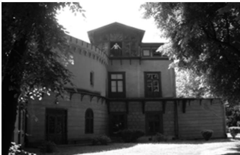
Fig. 4. The Palace – Park Complex in Przeworsk – palace.

Pierwsze prace budowlane, które przy pałacu prowadził jeszcze nadworny architekt księżnej Izabeli Lubomirskiej Jan Griesmayer , dokończyli Piotr Aigner oraz sztukator Fryderyk Bauman , który zaprojektował dekoracje wnętrz. W miejscu istniejącego późno-renaesansowego dworu obronnego, architekci wzniesli niewielki pałacyk o cechach angielskiego klasycyzmu. Obiekt, którego budowę zakończono ok. 1807 r., w połowie XIX w. został rozbudowany według projektów Feliksa Księżarskiego i zyskał obecny kształt architektoniczny. Pałacyk to piętrowy, z poddaszem, częściowo podpiwniczony budynek, posiadający dach czterospadowy o małym kącie nachylenia i ciekawym ryzalicie na parterze. Budynkowi estetycznego i funkcjonalnego smaku dodają ośmiofilarowa galeria od strony zachodniej i dwie klatki schodowe (jedna ukryta w drugiej i przeznaczona dla służby). W murach pałacu ciągle można odnaleźć elementy systemu ogrzewania Meisnera (nawiew ogrzany powietrzem) zaprojektowanego przez inż. Józefa Bema, późniejszego generała i bohatera wojsk polskich. 11