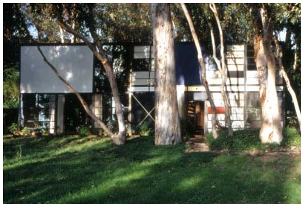
Fig. 2 Charles and Ray Eames. Private house, 1945.

Projektem wyróżniającym się, najbardziej innowacyjnym, który odniósł największy sukces był dom nazwany: Dom studialny nr 8 zaprojektowany przez małżeństwo Charlesa i Ray Eames jako ich własny dom. Składał się on z dwóch oddzielnych części. Jedną z nich była część mieszkalna, drugą - pracownia. Idea pokazywała możliwości projektowania z ograniczonej ilości prefabrykowanych elementów. Każdy z nich był zamawiany z katalogu producenta, łącznie ze stalowymi elementami konstrukcyjnymi, panelami okładziny zewnętrznej z różnych materiałów i kolorów, elementami szklanymi itd. Projektanci głównie skoncentrowali się na uzyskaniu jak największych wolnych przestrzeni przy użyciu ograniczonych nakładach, uzyskując ponad pięciometrową wysokość w pokoju dziennym.