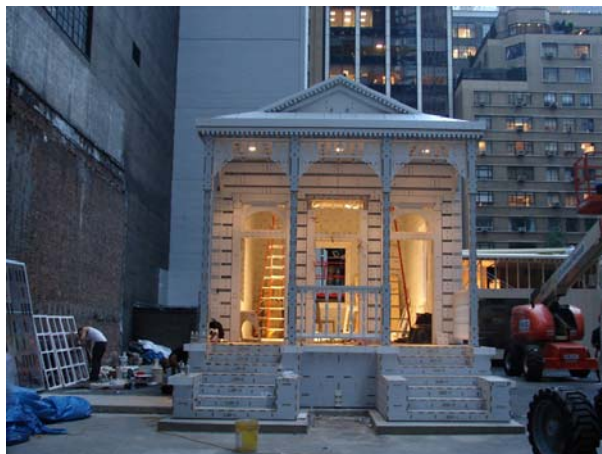
Fig. 3 One of prototypes of houses designed for New Orleans, presented on MOMA's exhibition, New York 2008.

Ryc.3. Jeden z prototypów domów opracowanych dla Nowego Orleanu, wystawa w MOMA Nowy Jork, 2008.