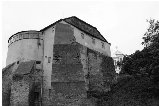
II. 5. Ostrog – Wzgórze Zamkowe