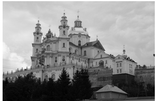
II. 8. Poczajów – Wzgórze z Soborem