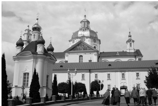
II. 7. Poczajów – Sobór Prawosławny