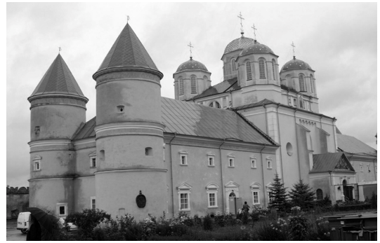
II. 6. Międzyrzecz Ostrogski – Cerkiew