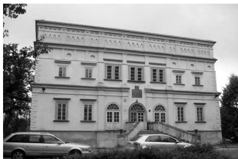
II. 1. Czemierniki – kompleks fortyfikacji k/Kocka