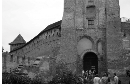
II. 4. Łuck – Zamek