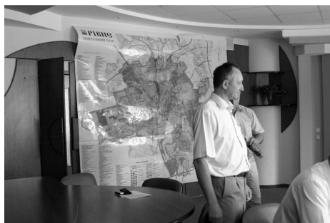
II. 2. Spotkanie u Mera Miasta Równie

się w ważny ośrodek handlowy(...)Do ważnych zabytków należy tutejsza Brama Łużycka z przełomu XV i XVI w., łącząca niegdyś funkcje baszty obronnej i bramy miejskiej(...) Encyklopedia Kresów, DTP, Kraków 2007, s. 105-106.