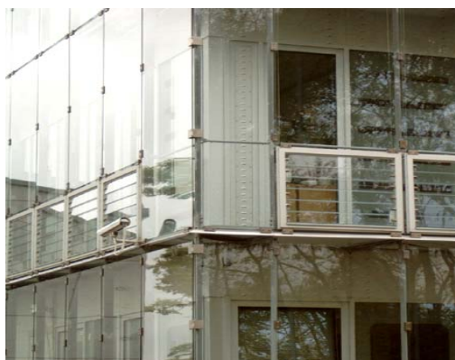
Ryc. 6. Fasada Budynku P.L.L LOT w Warszawie. Stefan Kuryłowicz. Źródło: Materiały własne. Fot. Mateusz Mateńko.

Fig. 5. Facade of Art Museum in Bregenz. Peter Zumthor. Source: Kunsthaus Bregenz . Peter Zumthor. „Baumeister“ nr 9 /1997r.