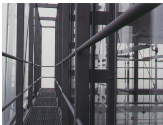
Ryc. 5. Fasada Muzeum Sztuki Współczesnej w Bregenz. . Peter Zumthor.

Współczesna podwójna fasada składa się z dwóch warstw: wewnętrznej, która jest termoizolacyjną, przeszkloną przegrodą z uchylnymi oknami, i zewnętrznej, wykonanej najczęściej z pojedynczych tafli szkła (ryc. 5,6).