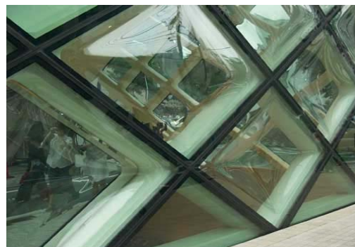
Ryc. 4. Fasada Prada Flagship Store w Tokio. Herzog & de Meuron.

Fig. 3. Facade of the French National Library in Paris. Dominique Perrault.