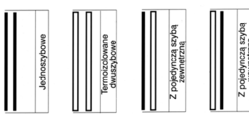
Ryc. 2. Fasady podwójne - schemat. Źródło: Celadyn Waclaw: Przegrody przeszklone w architekturze energooszczędnej , Kraków 2004r. Str. 91.

Fig. 1. Single leaf facades -scheme. Source: Celadyn Waclaw: Przegrody przeszklone w architekturze energooszczędnej , Kraków 2004r. Str. 91.