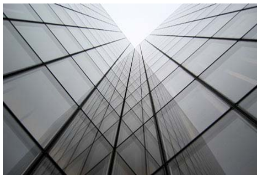
Ryc. 3. Fasada Francuskiej Biblioteki Narodowej w Paryżu. Dominique Perrault.

Są rozwiązaniami tradycyjnie stosowanymi od początków historii szkła w budownictwie. Skonstruowane są na zasadzie pojedynczej przegrody oddzielającej przestrzeń wewnętrzną od otoczenia. Mogą być zbudowane z jednej, lub połączonych i tworzących całość funkcjonalno konstrukcyjną, dwóch lub trzech tafli szkła. Są to tzw. szyby zespolone lub zestawy szklane (ryc.3). Do nich też zalicza się także fasady z pustaków szklanych oraz masywne fasady ze szkła profilowanego (ryc. 4).